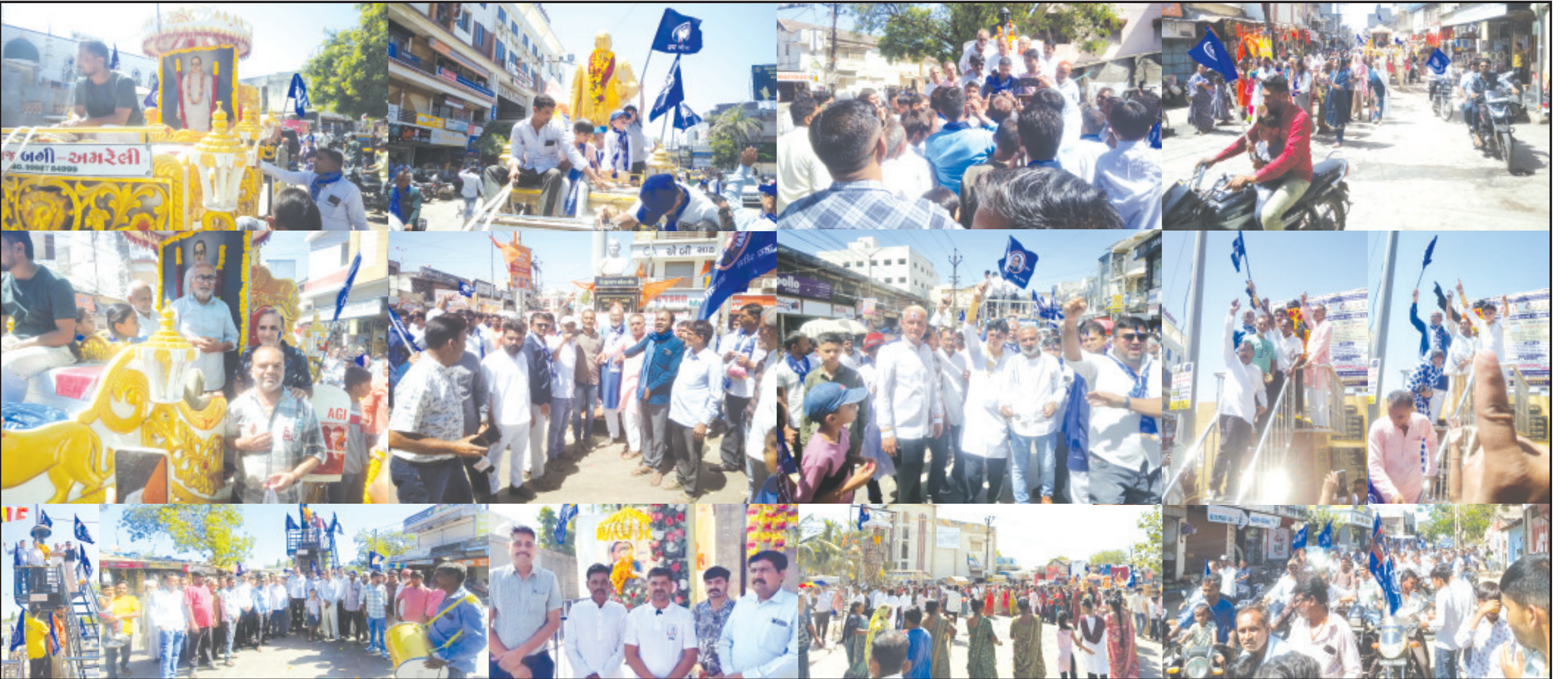
અમરેલી, તા. ૧૪ ભારતનાં બંધારણનાં ઘડપૈયા, ભારતરત્ન અને કરોડો નાગરિકોનાં ઉદ્ધારક ડૉ. બાબાસાહેબ આંબેડકરની ૧૩૫ મી જન્મજયંતીની આજે જિલ્લાનાં મુખ્ય મથક અમરેલીથી લઈને દરેક શહેરો અને છેવાડાનાં ગામ સુધી ઉત્સાહભરે ઉજવણી કરવામાં આવી હતી અને વાતાવરણમાં "જય ભીમ"નો નાદ ગુંજી ઉઠ્યો હતો. અમરેલીમાં ચિતલ રોડ અને બહારપરા સહિતનાં વિસ્તારમાં ઘણા આકર્ષક કમાન અને રોશનીનો ઝગમગાટ ઉભો કરવામાં આવ્યો હતો અને સવારે શહેરમાં વિશાળ રેલી યોજાઈ હતી. જેમાં હજારોની સંખ્યામાં સો કોઈ ઉપસ્થિત રહ્યા હતા. શહેરનાં રાજમાર્ગો પર ફરીને એસ.ટી. બસપોર્ટ નજીક ડૉ. બાબાસાહેબની પ્રતિમાને પુષ્પાંજલિ અનુસંધાન પાના ૬ ઉપર

ડૉ. બાબાસાહેબ કરોડો નાગરિકોનાં ઉદ્ધારક અને પ્રેરણાદાયી બની રહ્યા છે