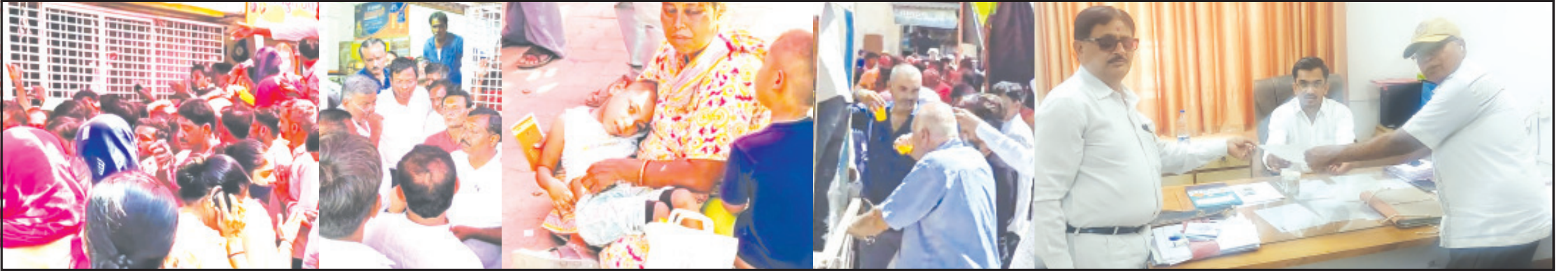
સાવરકુંડલા, તા. ૧૪

પુરવઠા વિભાગે અમરેલીની ગેસ એજન્સીને યુદ્ધના ધોરણે સિલિન્ડરની જવાબદારી સોંપવી જરૂરી બની