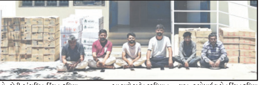
હતો, જેની અંદાજિત કિંમત રૂપિયા ૧૬.૯૧ લાખ થાય છે. આ સાથે જ રેડ દરમિયાન ૪ વાહનો કિંમત રૂપિયા ૪૦.૪૦ લાખ, ૭ મોબાઈલ ફોન કિંમત રૂપિયા અનુસંધાન પાના ૬ ઉપર

અમરેલી, તા. ૧૪ દામનગર ગામે સ્ટેટ મોનીટરીંગ સેલ દ્વારા કરવામાં આવેલી પ્રોહિબિશન રેડ દરમિયાન એક ગોડાઉનમાંથી મોટી માત્રામાં વિદેશી દારૂ, વાહનો, મોબાઈલ અને રોકડ મળી કુલ રૂપિયા ૫૭.૮૯ લાખનો મુદ્દામાલ જપ્ત કરવામાં આવ્યો હતો. પોલીસે આ મામલે ૬ આરોપીઓને ઝડપી લીધા છે જ્યારે વધુ ૬ આરોપીઓ ફરાર છે.