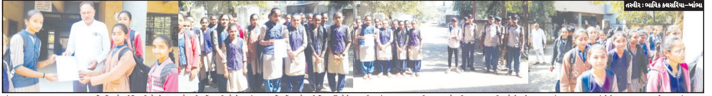
ખાંભા, તા. ૧૪ : ખાંભા તાલુકાના ગ્રામ્ય વિસ્તારના વિદ્યાર્થીઓને અભ્યાસ અર્થે આવવા જવાની એસ.ટી. બસો અનિયમિત હોવાથી વિદ્યાર્થીઓ પરેશાન બન્યા છે. ત્યારે ખાંભા જે. એન. મહેતા હાઈસ્કૂલના વિદ્યાર્થીઓ દ્વારા એસ.ટી. બસ અનિયમિત હોવાથી અને બંધ હોવાથી વિદ્યાર્થીઓએ ખાંભા મામલતદારને આવેદનપત્ર પાઠવ્યું હતું. રાજુલા-ખાંભા-રાજુલા તેમજ ધારી-ખાંભા-લાસા એસ.ટી. બસ અનિયમિત હોવાથી વિદ્યાર્થીઓને ખાંભા અભ્યાસ અર્થે આવવા જવામાં મુશ્કેલી પડી રહી છે. રાજુલા કે પોની રાજુલા-ખાંભા અને ધારી કે પોની ધારી-ખાંભા-લાસા રૂટની બસ નિયમિત કરવા વિદ્યાર્થીઓ માંગ કરી રહ્યા છે. ખાંભા અભ્યાસ અર્થે આવતા વિદ્યાર્થીને એસ.ટી. બસો અનિયમિત હોવાથી અભ્યાસ બગડી રહ્યો છે અને વિદ્યાર્થીઓને તગડી રકમ આપી પ્રાઈવેટ વાહનમાં જવા મજબૂર બન્યાં છે તેવું વિદ્યાર્થીઓએ જણાવ્યું હતું. આવેદનપત્રમાં જણાવ્યા અનુસંધાન પાના ૬ ઉપર

વિદ્યાર્થીઓને શાળામાં અભ્યાસ કરવા માટે બસનાં અભાવે નાણુકે ખાનગી વાહનોમાં અપડાઉન કરવું પડે છે રાજુલા-ખાંભા-રાજુલા અને ધારી-ખાંભા-લાસા રૂટની એસ.ટી. બસની અનિયમિતતાથી પરેશાની અમરેલી જિલ્લામાં દિનપ્રતિદિન એસ.ટી. સેવાની હાલત કથળી રહી હોય વિભાગીય નિયામક આગળ ખંખેરે તે જરૂરી જનપ્રતિનિધિઓ ચૂંટણી પ્રચારકાર્યમાં વ્યસ્ત હોવાથી અધિકારીઓને જનતાની ચિંતા નથી