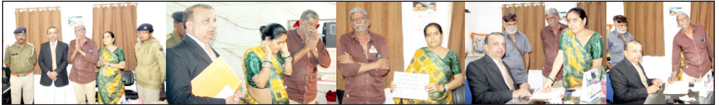
અમદાવાદ, તા. ૧૪

ભુઈ-ભુવાએ કબુલાતનામું આપી લોકોની માફી માંગી બંધની જાહેરાત કરી