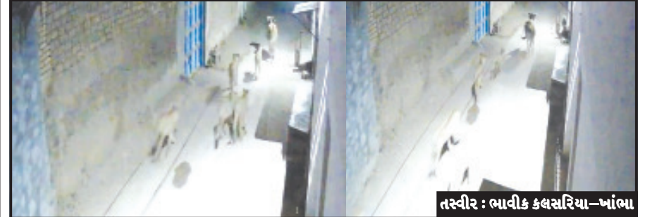
ખાંભા, તા. ૧૫ ખાંભાતાલુકાના ભાડ ગામની મીતીયાળા બોડર નજીક આવેલું ગામ છે. ગામના રહેણાંક વિસ્તારમાં લટાર મારતા ત્યારે અવારનવાર સિંહો શિકાર અર્થે ભાટ અનુસંધાન પાના ૬ ઉપર