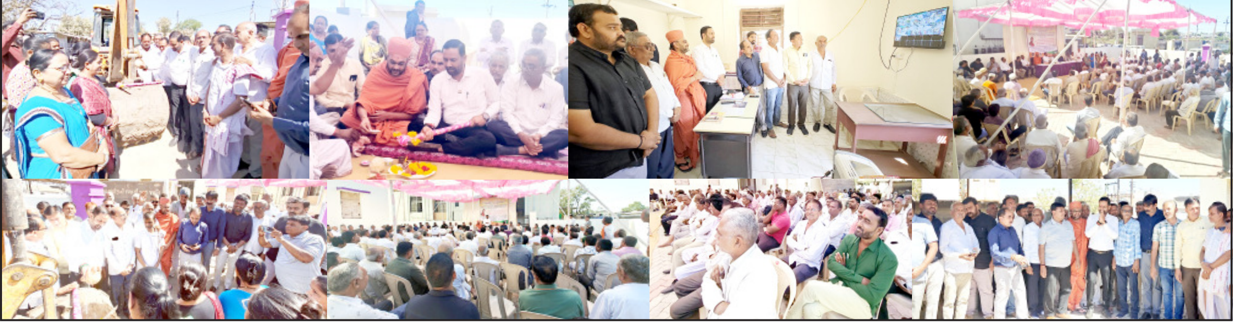
અમરેલી, તા. ૧૫

સમગ્ર વિધાનસભા વિસ્તારને વિકાસનાં મુખ્ય પ્રવાહ સાથે જોડવામાં આવશે : વેકરિયા