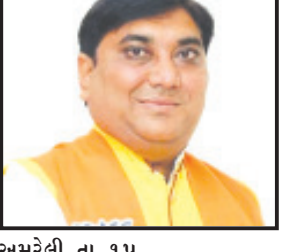
અમરેલી, તા. ૧૫

બનાવવા માટે રૂપિયા ૨.૯૪ કરોડની મંજૂર કરતાં ૧૨ ગામોનાં નાગરિકો વતી સરપંચે ધારાસભ્યને આભાર માનેલ છે. બાબરાનાં ફલગર, વાંડળિયા, ખાનપુર, ભીલડી, લોનકોટડા, ખીજડીયા, કોટડા, ગળકોટડી, ખાખરીયા અને લુણકી ગામોને નવા ગ્રામ પંચાયત ઘરનો લાભ મળશે. દરેક ગ્રામ પંચાયત માટે ૨૫ લાખ રૂપિયાની રકમ ફાળવવામાં આવશે. જ્યારે લાકીના લુણકીયા અને હાલકત ગામોને પણ નવા ગ્રામ પંચાયત ઘર મળશે અને દરેક ગામ માટે ૨૨ લાખ રૂપિયા મંજૂર કરવામાં આવ્યા છે.