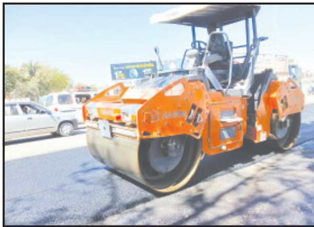
અમરેલી, તા. ૧૫ લાઈ-દામનગરનાં