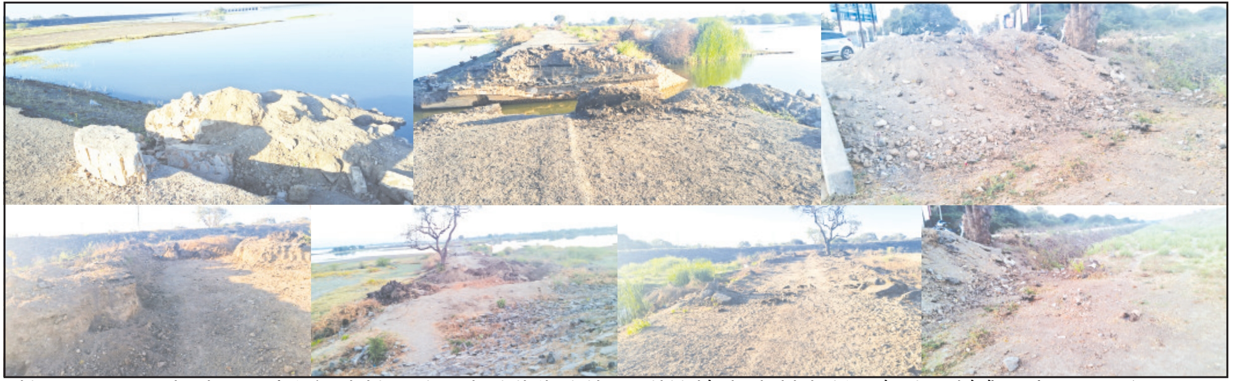
અમરેલી, તા. ૧૫ અમરેલીનાં પાટરમાં આવેલ અને જનતા જનાર્દનનાં પરસેવાનાં કરોડો રૂપિયાનાં ખર્ચથી તૈયાર થયેલ ઠેલી જળાશયની જાળ વણીમાં સિંચાઈ વિભાગની ગંભીર બેદરકારી ઉઠીને આંખે વળગી રહી છે. સવારથી જેસીબી અને લોડર વડે મનફાવે ત્યાં ખોદકામ કરવામાં આવ્યા બાદ ઠેકઠેકાણે માટીનાં ઢગલા જોવા મળી રહ્યા છે. તો વર્ષો પુરાણા માર્ગ ઉપર પણ અનુસંધાન પાના ૬ ઉપર

થોડા દિવસ પહેલા ઢેલી સવારથી જેસીબી, લોડર દ્વારા વડે મનફાવે તે રીતે ભાંગતોડ કરવામાં આવી જનતા જનાર્દનનાં પરસેવાનાં પૈસાથી થયેલ કામગીરી કયાં પ્રકારની હતી તેની કોઈને જાણકારી નથી ઠેકઠેકાણે માટીનાં ઢગલાઓ છતાં પણ અધિકારીને ખબર નથી કે જળાશયના પટાંગણની શું હાલત છે મહાકાય જળાશયની જવાબદારી એક રોજમદાર કર્મચારીની હોય તેવું લાગી રહ્યું છે