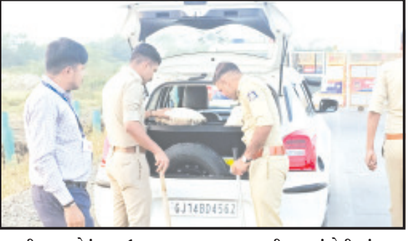
લાખથી પણ વધુનો દંડ સ્થળ ઉપર વસુલ કરવામાં આવ્યો હતો અને કલમ ૨૦૭ મુજબ ૧૪ વાહનો ડીટેન કરવામાં આવ્યા હતા. આગામી સમયમાં પોલીસ તંત્ર દ્વારા આ ટ્રાફિકની કડક કામગીરી ચાલુ રાખવામાં આવશે તેવું જણાવ્યું હતું.