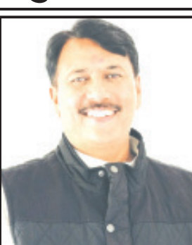
માનવ અધિકાર આયોગની સુચનાઓ અને નિયમોની અવગણના કરે છે. મહિલા આરોપીની સૂચિ સ્ત બાદ

ગાંધીનગર, તા. ૨ ગુજરાત વિધાનસભાનાં વિપક્ષ નેતા અમિત ચાવડાએ મુખ્યમંત્રી ભુપેન્દ્ર પટેલને પત્ર પાઠવેલ છે. પત્રમાં જણાવેલ છે કે અમરેલી જિલ્લાનાં ભાજપના આગેવાનો સભ્યો અને કાર્યકરોના બનેલ ગ્રુપમાં લેટરકાંડ થયેલ તેમાં લેટર ટાઈપ કરનાર યુવતીની લેટર ટાઈપ કરવા બદલ યુવતીને આરોપી બનાવી રાત્રે ૧૨ કલાક ધરપકડ કરીને બીજા દિવસે જાહેરમાં સરઘસ કાઢવામાં આવેલ. જેના કારણે યુવતીની વ્યક્તિગત છબીને નુકસાનની સાથે માનવ અધિકારોના ઉલ્લંઘન અને કાયદાની પ્રક્રિયાની ગંભીર અવગણના છે. કાયદાકીય જોગવાઈઓ મુજબ મહિલાની રાત્રિ દરમિયાન ધરપકડ ના કરવી તેમજ કોઈપણ મહિલાનો ફોટો પણ નાગરિકો સામે ન આવે તેની તકેદારી રાખવાની જોગવાઈ છે. આમ, અમરેલી પોલીસ દ્વારા પ્રસ્તુત કિસ્સામાં યુવતી સામે જાહેરમાં કરવામાં આવેલ કાર્યવાહીથી યુવતીના વ્યક્તિગત જીવનને અસર કરનારી અને સુપ્રિમ કોર્ટના નિર્દેશો અને રાષ્ટ્રીય