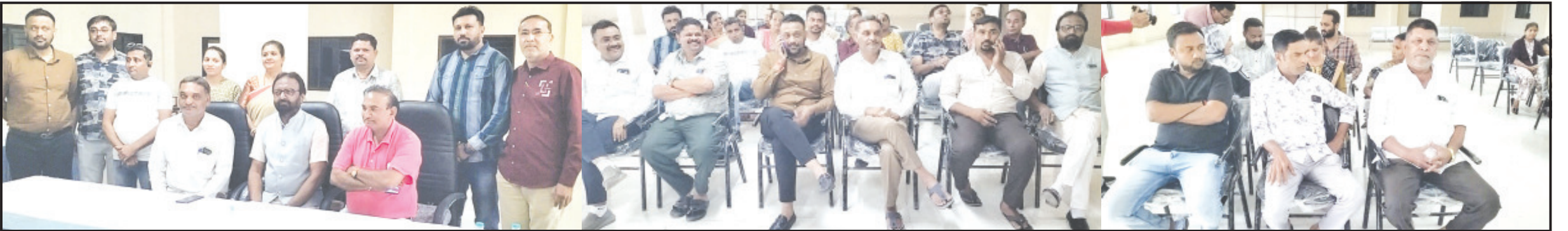
અમરેલી, તા. ૨૮ ભાજપ શાપિત અમરેલી | નગર પાલિકામાં ભાજપના જ ૧૭ સદસ્યોએ પ્રમુખ સામે કરેલ અવિશ્વાસ | દરખાસ્તમાં આજે કલેક્ટરના આદેશ મુજબ નાયબ કલેક્ટરના અધ્યક્ષ સ્થાને મળેલ અવિશ્વાસ દરખાસ્ત બેઠકમાં ૨૮ વિરૂધ્ધ ૮ મતે અવિશ્વાસ દરખાસ્તનો ફિયાસ્કો થયેલ હતો. જોકે અવિશ્વાસની દરખાસ્ત કરનારાઓ ખુદ પ્રમુખની તરફેણમાં ઊંચી આંગળી કરતા ધીના ઠામમાં ઘી પડી ગયેલ હતું. જિલ્લા ભાજપ આગેવાનોની દરમિયાનગીરીથી અવિશ્વાસ દરખાસ્ત અગાઉ પરત પેંચી લેવામાં આવેલ હતી. પ્રામવિગત મુજબ અમરેલી નગર પાલિકામાં અગિયાર વોર્ડનાં ૪૪ સદસ્યોમાંથી ૩૫ સદસ્યો ભાજપના ચૂંટાયેલ હતાં. હાલની કાર્યરત બોડીને હવે એક વર્ષ જેટલો સમય બાકી રહેલ છે ત્યારે જ ગત નવેમ્બર માસમાં ભાજપના જ ૧૭ સદસ્યોએ પ્રમુખ સામે અવિશ્વાસની દરખાસ્ત કરેલ હતી. જેમાં ભાજપના જિલ્લાના મોવડી મંડળ અને નાયબ મુખ્ય દંડકની મહેનતથી અવિશ્વાસની દરખાસ્ત પરત પેંચાયેલ હતી. પરંતુ નિયમાનુસાર પ્રમુખ કે ઉપ પ્રમુખ દ્વારા આ અંગે કોઈ કથંવાહી કરવામાં આવેલ ન હતી તેથી કલેક્ટર દ્વારા ૨૮મી જાન્યુઆરીના રોજ ભાર કલાકે અમરેલી પાલિકા કચેરીમાં અવિશ્વાસ દરખાસ્ત અંગે કાર્યવાહી કરવા આદેશ કરવામાં આવેલ હતો. જે આદેશ મુજબ આજે બપોરે બાર કલાકે નાયબ કલેક્ટરના અધ્યક્ષ સ્થાને તેમજ ડીએસઓ પ્રતિક કુંભાણીની ઉપસ્થિતિમાં અવિશ્વાસ દરખાસ્તની કાર્યવાહી હાથ ધરવામાં આવેલ હતી. જેમાં અવિશ્વાસની દરખાસ્ત કરનારા સહિત ભાજપના ૨૮ સદસ્યો તેમજ કોંગ્રેસના ૮ સદસ્યો હાજર રહેલ હતા. અવિશ્વાસની દરખાસ્તમાં આવેલ હતું. જેમાં ભાજપના તમામ સદસ્યોએ અવિશ્વાસ દરખાસ્ત વિરૂધ્ધમાં મતદાન કરેલ હતું. જયારે ઊંચી આંગળી કરી મતદાન કરાવવામાં અવિશ્વાસ દરખાસ્ત અનુસંધાન પાના ૬ ઉપર

કલેક્ટરની સુચનાથી નાયબ કલેક્ટરનાં અધ્યક્ષ સ્થાને મળેલ બેઠકમાં ધીનાં ઠામમાં ઘી પડી ગયું