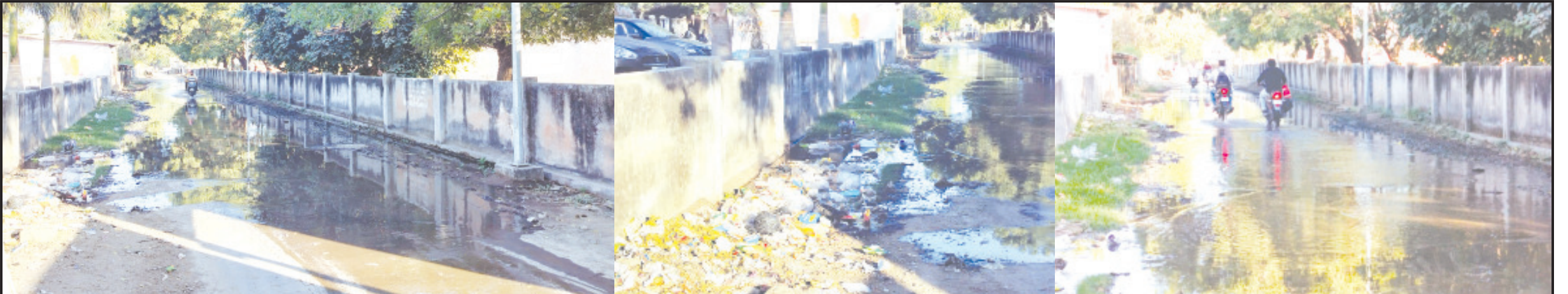
અમરેલી, તા. ૨૮ અમરેલીનાં રાજમાર્ગ સમાવિત લગભગ ૩ કી.મી. લાંબા કોલેજ, મહિલા કોલેજ, તરફ જતાં માર્ગ ઉપર છેલ્લા એક મહિનાથી ગટરનું ગંધાતું પાણી માર્ગ પર જમા થતું હોય સેંકડો વિદ્યાર્થીઓ ગંદકીમાંથી પસાર થવા મજબુર બની રહ્યા છે. શૈક્ષણિક સંસ્થાઓએ અવારનવાર રજૂઆત કરી છતાં પણ પાલિકાનાં આગળ શાસકો સમસ્યાનું સમાધાન કરતા નથી. અમરેલી શહેરમાં થોડા દિવસો પહેલાં સ્વચ્છતા અભિયાન અંતર્ગત ટોચનાં પદાધિકારીઓ અને અધિકારીઓએ કોટો સેશન કરાવીને મીડિયા દ્વારા વાહવાલી મેળવી લીધા બાદ શહેરમાં ફેલાયેલ ગંદકી સામે ક્યારેય નજર સુધ્ધા કરી નથી. અમરેલીની રાધિકા હોસ્પિટલ, આયુર્વેદિક કોલેજ, લો કોલેજ, અંધશાળા, મહિલા કોલેજ, પ્રાદેશિક તાલીમ ભવન સહિતની સંસ્થાઓની નજીકમાં ઘણા દિવસોથી અનુસંધાન પાના ૬ ઉપર

રાધિકા હોસ્પિટલ, આયુર્વેદિક કોલેજ, અંધશાળા સહિતની અનેક શૈક્ષણિક સંસ્થાઓ પણ નજીકમાં પાલિકાનાં શાસકો સમક્ષ અવારનવાર રજૂઆત કર્યા બાદ પણ સમસ્યાનું કોઈ નિરાકરણ થતું નથી સ્વચ્છતા અભિયાનની નાટકબાજી બંધ કરીને પાલિકાનાં શાસકો યુદ્ધનાં ધોરણે ગટરનાં ગંધાતા પાણી બંધ કરાવે જો ગટરનાં ગંધાતા પાણીની સમસ્યાનું નિરાકરણ ન થાય તો માનવ અધિકાર આયોગમાં પણ ફરિયાદ કરાશે