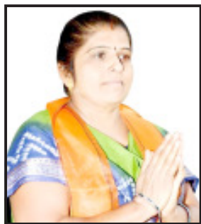
ફરિયાદ વગર કોઈ પગલા ભરવામાં આવેલ ન હતા. અને સામાન્ય લોકો

અમરેલી, તા. ૨૦ અમરેલી શહેરના ગાંધી બાગ સામે આવેલ નગર પાલિકાના એમ્યુઝન પાર્કમાં રવિવારી બજાર ભરાય છે. તેમજ જરૂરત મંદ લોકો આ સ્થળ ઉપર સીડનેબલ ધંધો કરતા હોય છે. તેમજ અન્ય ગરીબ લોકો સીડનેબલ ધંધો કરી રહેલ છે. ત્યારે આ પાર્કની દીવાલે સરકારી જમીન ઉપર દબાણ કરી ઝૂંપડા આવેલ છે. આ ઝૂંપડામાં વસતા લોકો અહીં વેપાર કરતા લોકોનો માલ સામાન ચોરી કરી લઈ જતા હોવાના કારણે આવા ગુન્હાહિત દુષણને ડામવા આવા દબાણ કરેલા ઝૂંપડાઓને કાઢવા પાલિકાના સદસ્ય દ્વારા માંગણી કરવામાં આવેલ હતી.