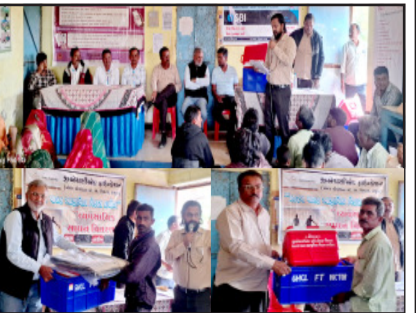
રાજુલા, તા. ૨૦

જીએસસીએલ ફાઉન્ડેશન દ્વારા પોતાની ઔદ્યોગિક સામાજિક જવાબદારી અંતર્ગત અમલીકૃત માછીમારી આજીવિકા વિકાસ કાર્યક્રમ અંતર્ગત ૧૨૦ જેટલા પગડીયા માછીમારી પરિવારોને માછીમારી માટે જરૂરી એવી પ્લાસ્ટિક કેટ, તાડપત્રી, આઈસ બોક્ષ, રીલી તગારા વિગેરે જેવા ઉપયોગી સાધન સહાયનું વિતરણ કરવામાં આવ્યું હતું.