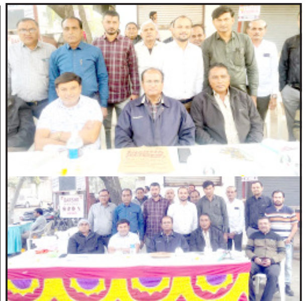
અલગ અલગ વિસ્તારોમાં મકરસંક્રાંતિ ના પાવન પર્વ એ પરોપકારની ઉદત ભાવનાએ અખોલ જીવો માટે યાચીકા કરતા યુવાનોની અદભુત સેવા સર્વત્ર

દામનગર હિન્દુ સંસ્કૃતિના દરેક તહેવારો દાન પુણ્ય પરમાર્થનો સદેશ આપે છે તેમાં મકરસંક્રાંતિ એટલે વિશેષ મહત્વ દાનધર્મનું અનુમોદન કરે છે ત્યારે બળદો નું લાલન પાલન કરતી જીવદયા નંદી સેવા ટ્રસ્ટ સંસ્થાના સ્વયંમ સેવકોએ દાન દ્રવ્ય માટે ‘મરૂં પછા માર્ગુ’ નહિ પછા પરમાર્થ કાજે મને માંગતા ન આવેલાજ’ રોડરસ્તા જાહેર ચોરાચાવી ઉપર સ્ટોલ ઉભા કરી દિવસ દરમ્યાન અખોલ જીવો માટે દાન દ્રવ્ય એકત્રિત કરવાના સેવા યજ્ઞમાં સતત ખડે પગે સ્વયંમ સેવકોએ જીવદયા નંદી શાળામાં આશ્રિત અખોલ જીવો માટે યાચીકા કરી પતંગોત્સવના બદલે પરમાર્થ પ્રવૃત્તિ કરતા અસંખ્ય યુવાનોની સેવાને સલામ છે ભાગદોડ વાળી જિંદગીમાં એક દિવસની રજામાં ઘર પરિવારથી પર રહી પર સેવા માટે તત્પર રહેતા જીવદયા નંદી સેવા ટ્રસ્ટના ટ્રસ્ટી ઉદારદિલ દાતા અને સ્વયંમ સેવકોની વંદનીય સેવા જોવા મળી સુરત શહેરમાં