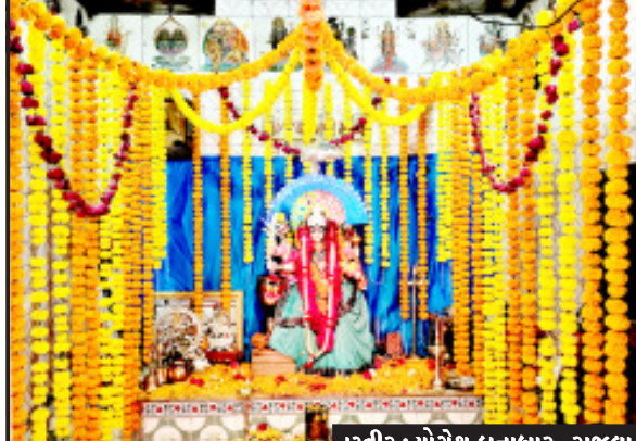
રાજુલા, તા. ૧૫

રાજુલા શહેરમાં આવેલ ગલ્સ હાઈસ્કૂલ નજીક અંબાજી માતાજીના મંદિરનો પ્રાગટ્ય મહોત્સવ ધામધૂમથી ઉજવાયો આ દિવસે વિવિધ કાર્યક્રમનું આયોજન કરવામાં આવેલ છે આ પ્રાગટ્ય દિવસે દર્શન અભિષેક ના