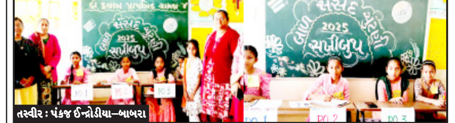
બાબરા, તા. ૧૬

બાબરામાં પોલીસ ગ્રાઉન્ડ ખાતે કાર્યરત ડો. અબ્દુલ કલામ પ્રાથમિક શાળા માં બેગલેસ ડે ની ઉજવણી નિમિત્તે શાળા પરિવાર દ્વારા બાળ સંસદનો કાર્યક્રમ કરવામાં આવ્યો હતો જેમાં લોકસભાની ચૂંટણી કેવી રીતે થાય સાંસદ કેમ બની શકાય સહિતની બાબતોનું માર્ગદર્શન વિદ્યાર્થીઓ ને આપવામાં આવ્યું હતું. અહીં શાળામાં મતદાન મથક તરીકે ‘સપ્તી બુથ’ની રચના કરવામાં આવી હતી. પ્રિસાઈડિંગ ઓફિસર, પીઓ-૧, પીઓ-૨,