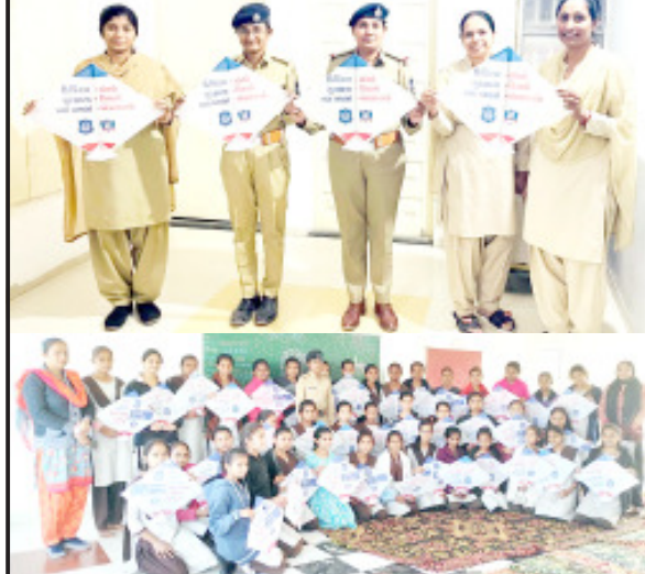
લીલીયા, તા. ૧૬

લીલીયા મોટા પોલીસ સ્ટેશનના પી.આઈ આઈ. જે ગીડાની ઉપસ્થિતિમાં ઉત્તરાયણ પર્વ નિમિત્તે પે.સેન્ટર કન્યા શાળા સ્કૂલની વિદ્યાર્થીનીઓને પતંગવિતરણ કરવામાં આવી જે પતંગમાં ગુજરાત પોલીસ દ્વારા સ્વોગન લગાવવામાં આવેલ કેડિજિટલ સુરક્ષાના ત્રણ પગલા જેમાં થોભો, વિચારો, અને એક્શન લો ના સ્વોગન