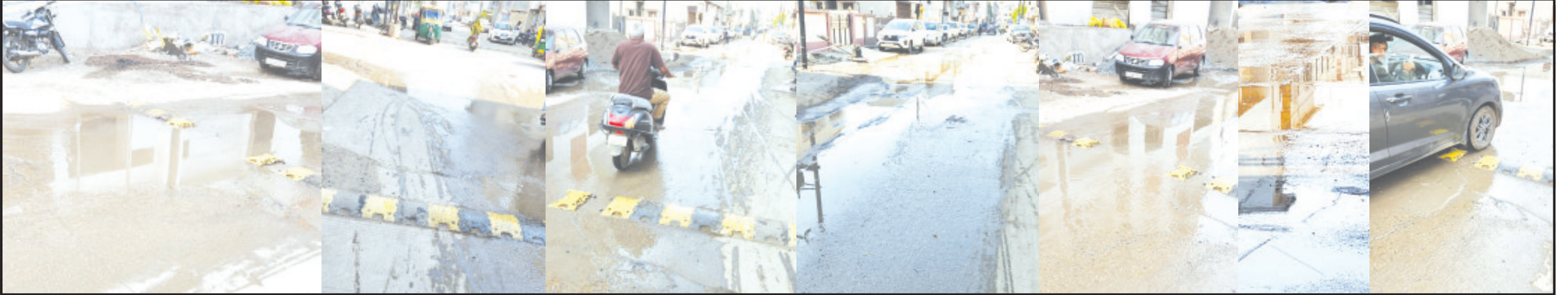
અમરેલી, તા. ૯ | અમરેલીનાં માણેકપરા વિસ્તારમાંથી પસાર થતાં મહત્વનાં માર્ગ ઉપર દરરોજ પાણીનો ભરાવો થતાં રથાનિક રહેવાસીઓ અને દુકાનદારોમાં નારાજગીનો માહોલ ઉભો થયો હોય પાલિકાનાં શાસકો સમસ્યાનું નિરાકરણ કરે તેવી માંગ ઉભી થઈ છે. ભીડભંજન મંદિરથી આગળ આવેલ ડો. સાવલિયાની હોસ્પિટલ સામેથી શરૂ કરીને છેલ્લે આવેલ રેલ્વે ટ્રક સુધીનાં મોટાભાગનાં માર્ગ ઉપર ખાનગી હોસ્પિટલો રહેણાંક વિસ્તારમાં ધમધમી રહી છે અને હોસ્પિટલમાં થતી સફાઈનું પાણી જાહેર માર્ગ પર આવતું હોવાનું સો માની રહ્યું હોય પાલિકાનાં શાસકો યોગ્ય કરે તેવી માંગ ઉભી થઈ છે.

ટ્રાફિકથી ધમધમતા માર્ગ ઉપર ગંદકીનો માહોલ કોઈપણ સંજોગોમાં ઉભો થવો ન જોઈએ