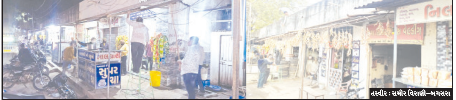
બગસરા, તા. ૯ બગસરા શહેરના જેતપુર રોડ પર દબાણ કરનાર વેપારીઓને બુધવારે નોટિસ પાઠવવામાં આવતા અનુસંધાન પાના ૬ ઉપર

આગામી કલાકોમાં જ મોટાભાગનું દબાણ દૂર થાય તો નવાઈ નહી