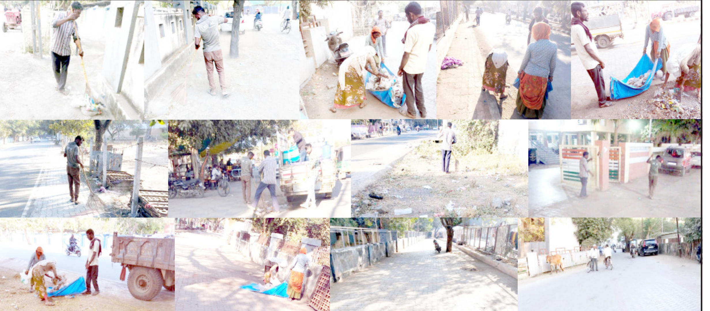
અમરેલી પાલિકા અનેક સુવિધાને લઈને ભલે વિવાદમાં રહેતી હોય પરંતુ શહેરીજનોનાં સહનસીબે શહેરનાં તમામ રાજમાર્ગો ઉપર દિવસ-રાત યોગ્ય રીતે સ્વચ્છતા અભિયાન ચાલી રહ્યું છે. થોડા મહિના પહેલા દેશભરમાં સ્વચ્છતા અભિયાન યોજાયું અને બાદમાં નિયમિત ગતિએ કામ શરૂ થયું. જિલ્લામાં એકમાત્ર અમરેલીમાં જાહેર સ્થળો ઉપર સ્વચ્છતા અભિયાનની કામગીરી થતાં હજારો નિરાશા વચ્ચે આશાનું એક કિરણ જોવા મળી રહ્યું છે.