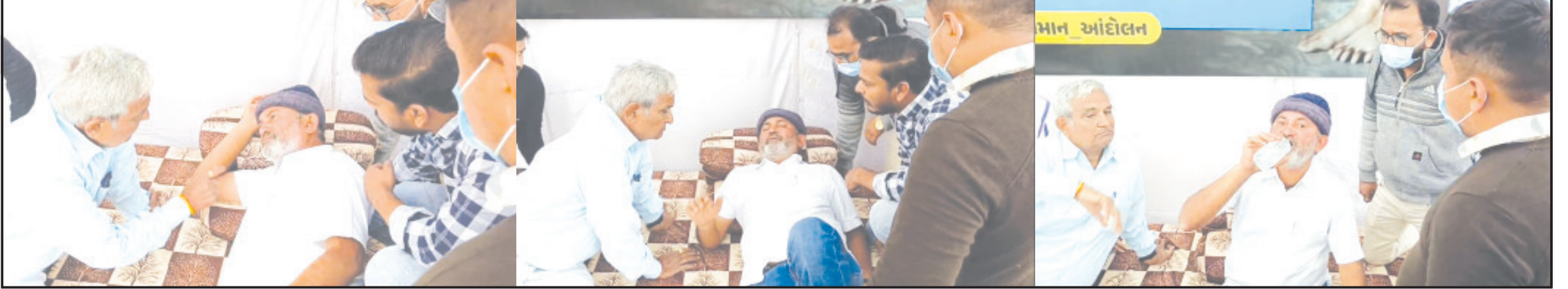
અમરેલી, તા. ૧૦ આજનાં મુડીવાદનાં માહોલમાં કહેવાતા જનપ્રતિનિધિઓ

બપોર બાદ તબીબો અને કાર્યકરોની સલાહ બાદ પ્રવાહી લેવા તૈયાર થયા