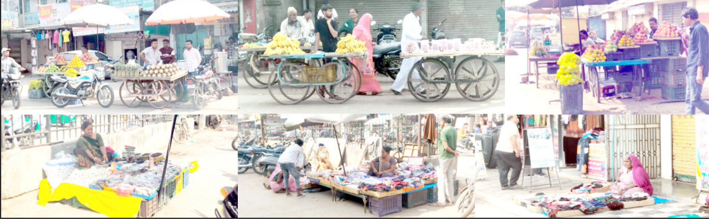
અમરેલી, તા. ૫ અમરેલી શહેરમાં દિનપ્રતિદિન ટ્રાફિક સમસ્યા વિકરાળ સ્વરૂપ ધારણ કરી રહી છે છતાં પાલિકા અને ટ્રાફિક વિભાગનાં કમચારીઓની કુંભકર્ણસમી નિંદ્રા ઉડતી નથી. ઉચ્ચ અધિકારીઓ અને જનપ્રતિનિધિઓ પણ સ્વવિકાસમાં વ્યસ્ત હોવાથી તેઓને શહેરીજનોની વ્યથા નજરે પડતી નથી. સ્ટેન્ડ ચોકમાં ખાનગી વાહનોની જોહુકમી સામાન્ય રકમનાં કારણે સતત વધી રહી છે. નાગનાથ બસ સ્ટેન્ડ ઉપર ખાનગી વાહનોમાં સૌપ્રથમ મુસાફરો બેસે બાદમાં એસ.ટી. એસને મુસાફરો મળે છે. બસ સ્ટેન્ડની આજુબાજુનાં ૧૦૦ મીટરમાં ખાનગી વાહનોને ઉભા રાખવાની મનાઈ હોવા છતાં ખાનગી વાહનોનો જમલો થતાં નાગનાથ મંદિર નજીક અવારનવાર ટ્રાફિક સમસ્યા ઉભી થાય છે. તદુપરાંત લાયકેરી ચોક, રામજી મંદિર રોડ, હરિરોડ, ભીડભંજન ચોક, જુના માર્કેટચાર્જ રોડ, ગાંધીબાગ નજીકની ફૂટપાથ, પોસ્ટ ઓફિસ પાછળનો માર્ગ સહિતનાં વિસ્તારોમાં ફૂટપાથ ઉપર જાહેર માર્ગ ઉપર રોકી કોચી, કેબિનો કે ટુકાનોનો સરસામાન પડકી દેવામાં આવતાં શહેરીજનોને પગપાળા કે ટુ-વ્હીલરમાં પસાર થવામાં મુશ્કેલી થઈ રહી છે. ટ્રાફિક સમસ્યાનાં નિવારણ માટે એલઆરડી જવાનોની નિમણૂક કરવામાં આવી છે પરંતુ તેઓ ફરજ દરમિયાન મોબાઇલમાં વ્યસ્ત જોવા મળે છે. તો પાલિકાનાં કમચારીઓને દબાણ હટાવવાની પ્રક્રિયા જ ભુલાઈ ગઈ હોય અમરેલીનાં યુવા ધારાસભ્ય તેમજ સાંસદે શહેરમાં આકસ્મિક પદયાત્રા કાઢીને શહેરમાં વિકરાળ બનેલ ટ્રાફિક સમસ્યાનું નિરાકરણ કરવું જોઈએ તેવી માંગ શહેરીજનો કરી રહ્યા છે.

શહેરમાં આડેઘડ પાર્ક થતાં વાહનોનાં ચાલકો સામે પણ ટ્રાફિક પોલીસ કામગીરી કરતી નથી