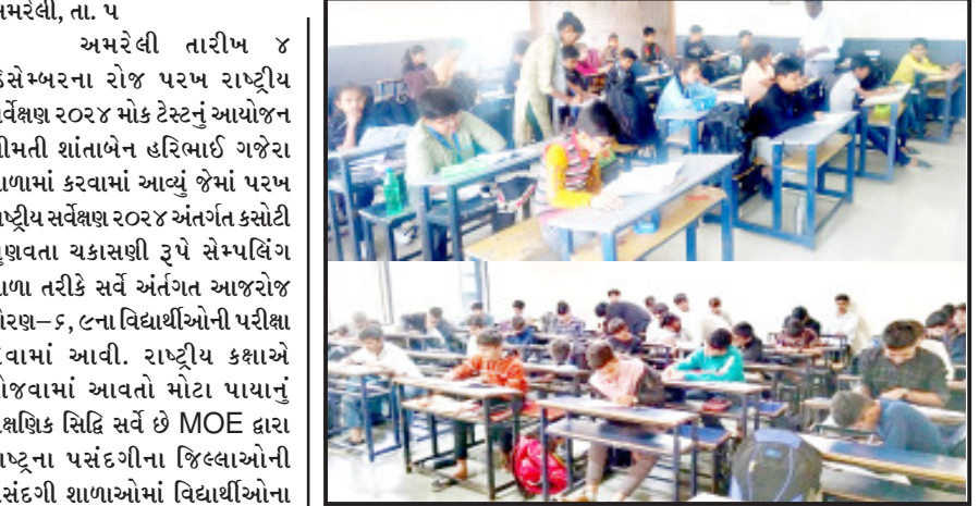
અમરેલી, તા. ૫

અમરેલી તારીખ ૪ ડિસેમ્બરના રોજ પરખ રાષ્ટ્રીય સર્વેક્ષણ ૨૦૨૪ મોક ટેસ્ટનું આયોજન શ્રીમતી શાંતાબેન હરિભાઈ ગજેરા શાળામાં કરવામાં આવ્યું જેમાં પરખ રાષ્ટ્રીય સર્વેક્ષણ ૨૦૨૪ અંતર્ગત કસોટી ગુણવત્તા ચકાસણી રૂપે સેમ્પલિંગ શાળા તરીકે સર્વે અંતર્ગત આજરોજ ધોરણ-૬, ૮ના વિદ્યાર્થીઓની પરીક્ષા લેવામાં આવી. રાષ્ટ્રીય કક્ષાએ યોજવામાં આવતો મોટો પાયાનું શૈક્ષણિક સિદ્ધિ સર્વે MOE દ્વારા રાષ્ટ્રના પસંદગીના જિલ્લાઓની પસંદગી શાળાઓમાં વિદ્યાર્થીઓના વિષયોની શૈક્ષણિક સિદ્ધિ જાણવાનું સંશોધાત્મક પ્રયાસ કરવામાં આવે છે આ સર્વેનો મુળભૂત ઉપદેશ વિદ્યાર્થીઓની અધ્યયન શક્તિઓના માધ્યમ દ્વારા વિદ્યાર્થીઓનો શૈક્ષણિક