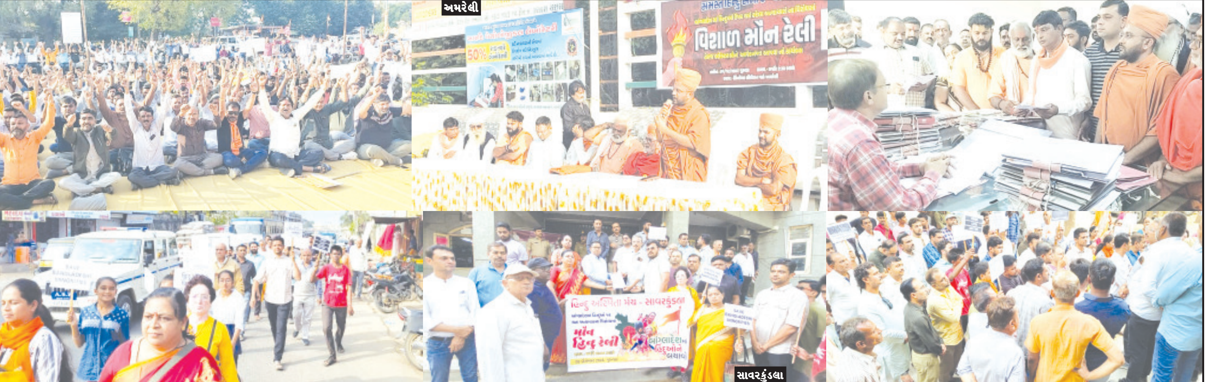
અમરેલી, તા. ૫ બાંગ્લાદેશમાં હિન્દુઓ પર થઈ રહેલા અત્યાચાર તથા તેમને બચાવવાની માંગણી સાથે અમરેલીમાં સમસ્ત હિન્દુ સમાજ ધ્વારા જાહેરસભા બાદ મૌન સાથે વિશાળ રેલી કાઢવામાં આવી હતી અને કલેક્ટરને આવેદનપત્ર પાઠવીને રજૂઆત કરવામાં આવી છે. અમરેલીમાં આવેલા સીનિયર સિટીઝન પાર્ક ખાતે બપોરનાં સમયે જાહેરસભા યોજવામાં આવી હતી. જેમાં જુદી જુદી સંસ્થાના સંતો, મહંતો, પૂજારીઓ વગેરે ધ્વારા બાંગ્લાદેશમાં હિન્દુ પરિવારો પર થઈ રહેલો અત્યાચાર, તેમના માનવીય અધિકારોનું હનન અને જયારે તે દેશના તમામ હિન્દુ પરિવારો બાંગ્લાદેશ છોડ્યા વગર ત્યાં જરૂરી નેપોતાના અધિકારો માટે લડી રહ્યા છે ત્યારે તેમને બળ પુર પાડવા તથા ત્યાં હિન્દુ પરિવારો પર થતાં અત્યાચારો બંધ થાય, હિન્દુ ધર્મસ્થળોની સુરક્ષા વધારવા, ચીનમચકૃષ્ણદાસજીને મુક્ત કરવા, પીડીતોને ત્યાય અને અનુસંધાન પાના ૬ ઉપર

હિન્દુઓ ઉપર અત્યાચાર બંધ ન થાય તો અન્ય કાર્યક્રમો આપવાની ચીમકી આપવામાં આવી