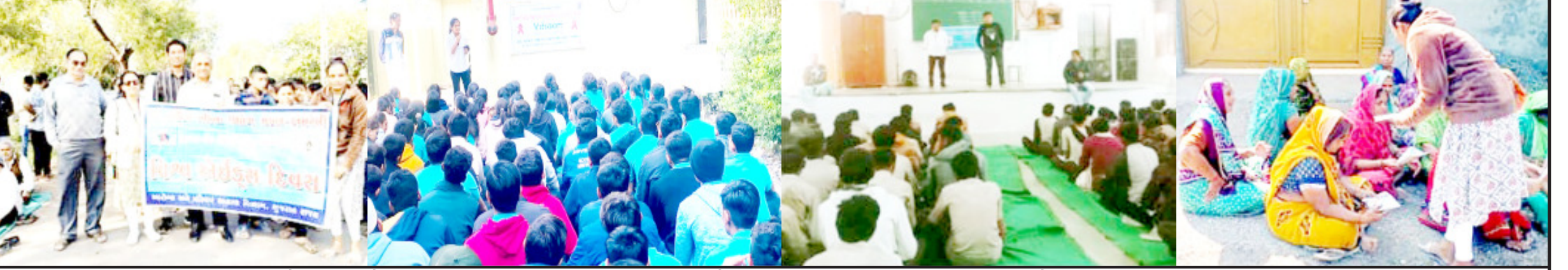
૧ ડિસેમ્બર વિશ્વ એઈડ્સ દિવસ નિમિત્તે સર્વોદય મહિલા ઉદ્યોગ મંડળ એલડબલ્યુએસ સ્ટાફ દ્વારા અલગ અલગ તાલુકાના ગામોમાં એચઆઈવી અવેરનેસ કાર્યક્રમ કરવામાં આવ્યા, જ્યાં પોસ્ટર પ્રદર્શન, રેલી, આઈઈસી મટીરીયલ વિતરણ, તેમજ રેડ રીબીન દ્વારા (Take the rights path) થીમ અંતર્ગત એચઆઈવી અવેરનેસના સંદેશ પાઠવામાં આવ્યો હતો. તેનો અર્થ એચ.આઈ.વી. સાથે જીવતા લોકોના માનવ અધિકારોના સંરક્ષણ થકી કલંક અને ભેદભાવ મુક્ત સમાજ બનાવીએ.