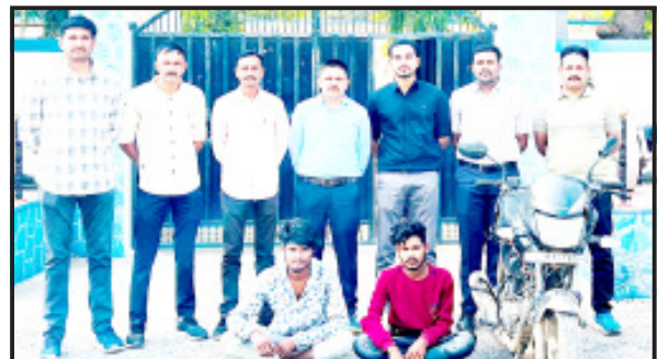
એલ.સી.બી. ટીમને સફળતા મળેલ છે.