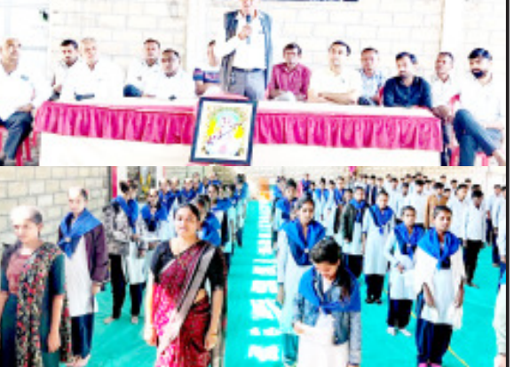
લીલીયા, તા. ૧૯