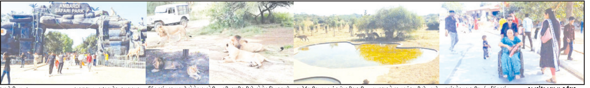
અમરેલી, તા. ૬ હાલમાં દિવાળી દિવાળીના રાજસ્થાન, મધ્યપ્રદેશ આસપાસ રાજ્યના લોકો સૌથી વધુ સોરાષ્ટ્રમાં વસતા સિંહોના દર્શન માટે સફારી પાર્કમાં સિંહ દર્શન કરવા માટે લોકો ખૂબ મોટી સંખ્યામાં આવી રહ્યા છે. પર્યટકો પ્રવાસીઓની દિવાળીની તથા વેકેશનમાં ભીડ જામી રહી છે. લોકો પરિવાર સાથે વેકેશનની મજા માણવા ધારી ગામ નજીક આંબરડી સફારી પાર્કમાં સિંહ દર્શન કરવા માટે ઉમટી પડ્યા હતાં. આંબરડી સફારી પાર્કમાં વનવિભાગ દ્વારા દિવાળીની રજાને લઈ પ્રવાસીઓ માટે ખાસ વિશેષ વ્યવસ્થાઓ કરવામાં આવી છે. ત્યારે પર્યટકો આ સફારી પાર્કના સિંહ દર્શન અનુસંધાન પાના ૬ ઉપર

સફારીપાર્ક અંદાજિત ૩૬૫ એકર વિસ્તારમાં પથરાયેલ હોવાથી પ્રવાસીઓ ખૂશ નાની ટેકરીઓ વાળુ જંગલ હોવાથી પ્રવાસીઓ આનંદ મેળવે છે સિંહ ઉપરાંત ચિંકારા, ચિતલ, જંગલી બિલાડી, પ્રવાસી પક્ષીઓ પણ આકર્ષણનું કેન્દ્ર સિંહબાળ સાથેનું સૌથી વિશાળ સ્ટેચ્યુ પણ પ્રવાસીઓને આકર્ષે છે