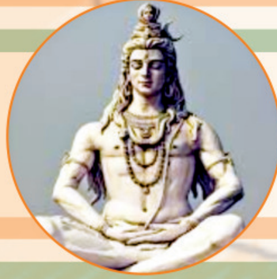
દેવોના દેવ મહાદેવ