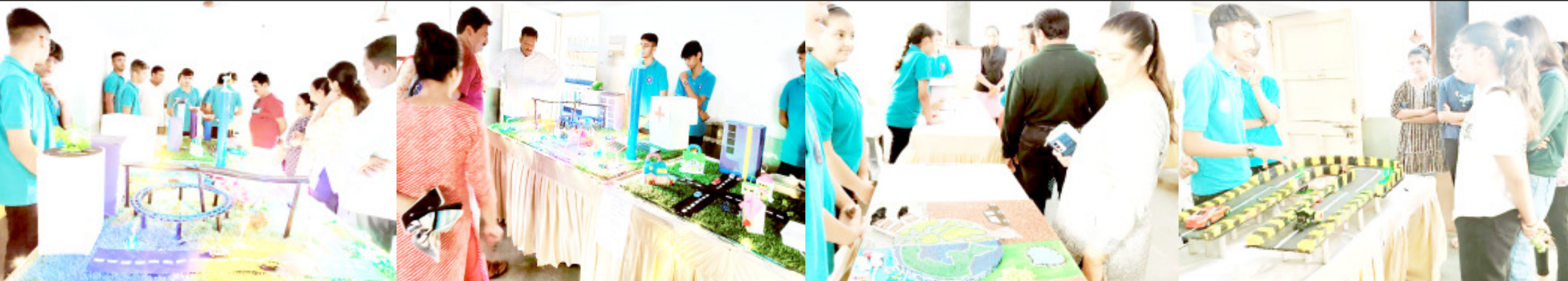
અમરેલી વિદ્યાર્થીઓમાં રહેલી પ્રતિભાને ખીલવવા તથા વૈજ્ઞાનિક અભિગમને વિકસાવવા નાં હેતુથી ઈનોવેટિવ સ્કૂલ, (અંબેડકર્માધ્યમ) દ્વારા એક વિજ્ઞાન મેળા (Science fair)નું આયોજન કરવામાં આવેલ હતું. જેમાં ધો. ૬ થી ધો. ૧૨ સુધીનાં વિદ્યાર્થીઓએ વિવિધ પ્રોજેક્ટ્સનું રજૂ કરેલ હતું. તથા વિવિધ મોડેલ દ્વારા વિદ્યાર્થીઓ અને વાલીઓને ભવિષ્યના ભારતની સમજ આપી હતી. જેમાં સોલાર પાવર, ઈલેક્ટ્રીસીટી ડ્રોમ વેસ્ટ કુટસ, ATM મશીન, ફ્યુચર સીટી, ગ્રીન એનર્જી અને ગ્લોબલ વોર્મિંગ જેવા વિષયો પર લાઈવ પ્રોજેક્ટ્સ રજૂ કરવામાં આવેલ હતાં. આ વિજ્ઞાન મેળામાં ફૂડ સ્ટોલ પણ ઉભા કરવામાં આવેલ જેમાં વિદ્યાર્થીઓએ શુદ્ધ લાઈવ ફાસ્ટફૂડ બનાવેલ અને પોતાનાં ઉમદા ગુણોનો પરિચય આપેલ. શાળાનાં ૧૨૦ વિદ્યાર્થીઓએ આ વિજ્ઞાન મેળામાં ભાગ લીધેલ હતો. તથા અંદાજત ૪૫૦ જેટલા વાલીઓ તથા મહેમાનોએ આ વિજ્ઞાન મેળાની સુલાકાત લઈને વિદ્યાર્થીઓને બિરદાવેલ હતા તેવું સંસ્થાના ડાયરેક્ટર ધવલભાઈ ઠાકરની યાદીમાં જણાવેલ છે.