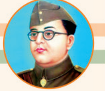
નેતાજી સુભાષચંદ્ર બોઝ