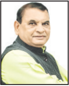
છે કે, મા દુર્ગાની આરાધનાના મહાપર્વ નવરાત્રિના દિવસોમાં અમરેલી શહેરના લાઠી રોડ ઉપર એક ફલેટમાં એક યુવા રાજકીય આગેવાન ધ્વારા મહિલા ઉપર દુષ્કર્મ કરવાની કોશિષ કરાઈ હોવા બાબતની ચર્ચાઓ સમગ્ર જિલ્લામાં થઈ રહી છે.

વિપક્ષની સાથે સત્તા પક્ષનાં દિગ્ગજ નેતાઓ તટસ્થ તપાસની માંગ કરે એટલે મામલો ગંભીર