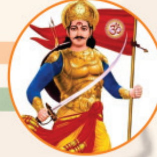
પૃથ્વી સમ્રાટ શ્રી માંધાતા મહારાજ