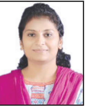
નવરાત્રિમાં મા આઘાશકિતની સૌ ઉપાસના કરતા હોઈએ અને કોઈ વ્યક્તિ નારી શક્તિ સાથે બળજબરી અને દુષ્કર્મ કરવાની કોશિષ કરે તે ખૂબ જ નીંદનીય બાબત ગણાય. અમરેલી નહીં પરંતુ સમગ્ર ગુજરાતમાં અવાર નવાર આવા બનાવો

ભાજપનાં આગેવાનો કયાં પક્ષનાં યુવા કાર્યકર છે તેની ચોખવટ કરતા નથી તે કોંગ્રે નેતાઓ ભાજપના યુવા નેતા છે તેવું કહે છે