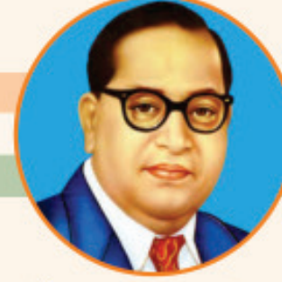
ડૉ. બાબાસાહેબ આંબેડકર