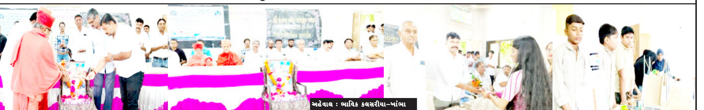
અહેવાલ : ભાવિક કલસરીયા-ખાંભા

ખાંભાની જે. એન. મહેતા હાઈસ્કૂલ ખાતે જી. સી. આર. ટી ગાંધીનગર પ્રેરિત બાળ જિલ્લા શિક્ષણ તાલીમ ભવન અમરેલી આયોજિત સાવરકુંડલા અને ખાંભા એમ બે તાલુકાનું બાળ વૈજ્ઞાનિક ગણિત પ્રદર્શન મેળો યોજાયો હતો તેમાં સંતો હસ્તે દીપ પ્રાગટ્ય કરી કાર્યક્રમનો શુભારંભ કરવામાં આવ્યો જેમાં સાવરકુંડલા અને ખાંભા. તાલુકાના અલગો અલગો શાળાના વિદ્યાર્થીઓએ વૈજ્ઞાનિક અલગો અલગો કૃતિઓ અને પ્રોજેક્ટ રજૂ કર્યા હતા. ખાંભા અને સાવરકુંડલા એમ બે તાલુકાનું એસ.વી.એસ કક્ષાનું બાળ ગણિત વૈજ્ઞાનિક પ્રદર્શન ખાંભા ખાતે યોજાયું હતું જેમાં ખાંભા અને સાવરકુંડલા એમ બે તાલુકા માંથી કુલ ૪૫ જેટલી કૃતિઓ અને પ્રોજેક્ટ જુદા જુદા વિભાગોમાં રજૂ કરવામાં આવ્યા હતા જેમાં હરણી કાડ જે થયો તેને લઈ વિદ્યાર્થીઓએ બોટ કે હોડીમાં મધ્યાદા કરતા વધારે લોકો બેસે તે હોડી. બોટમાં ૪૫ જેટલી કૃતિઓ અને પ્રોજેક્ટ જુદા હોડી બોટ વધારે લોકો બેસે તે લોકોને હાજર થાય કે હોડી બોટ વધારે લોકો બેસે તે લોકોને જાણ થાય એટલે માટે હરણી કાડ જેવી ઘટના અટકી સકે તે લોકો જાગૃત થાય તેવા હેતુ થી પ્રોજેક્ટ કરિયો હતો વિભાગમાંથી સારી અને શ્રેષ્ઠ કૃતિઓ અને એસ. વી. એસ માંથી કુલ ૧૦ કૃતિઓ જિલ્લા કક્ષામાં ભાગ લેવા જશે અને એ જિલ્લા કક્ષાના ગણિત વિજ્ઞાન પ્રદર્શન માંથી આગળ એક કક્ષા માંથી રાજ્ય કક્ષા અને એમાંથી નેશનલ કક્ષા સુધી આ વિદ્યાર્થીઓ કૃતિઓ અને પ્રોજેક્ટ રજૂ કરશે આ તકે ખાંભાના રાજકીય આગેવાનો સંતો વિદ્યાર્થીઓ સહિત ઉપસ્થિત રહ્યા હતા આ કાર્યક્રમ સફળ બનાવવા શિક્ષક સ્ટાફે ભારે જેહમત ઉઠાવી હતી.