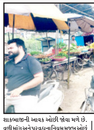
શાકભાજીની આવક ઓછી જોવા મળે છે. વળી માંગ અને પુરવઠાના નિયમ મુજબ ઓછું ઉત્પાદન પણ ભાવવધારા માટે કારણભૂત ગણી શકાય.

સાવરકુંડલા, તા. ૨૩ સો નોટ તો શાકમાર્કેટમાં શાકભાજીની ખરીદીમાં ઓખના પલકારામાં પાણીની જેમ વપરાય જાય. આ ભાવવધારાને કારણે ગૃહિણીઓનું બજેટ ખોરવાઈ જતું જોવા મળે છે ચોમાસાના દિવસો લગભગ પૂર્ણ અને શિયાળાની શરૂઆત થવા છતાં શાકભાજીના ભાવ આસમાને. ટમેટા, બટાટા, દુધી, તુરિયા જેવા શાકભાજી પછામોઘા ભાવના થયા છે. ડુંગળી અને લસણ સમેત મોટાભાગના શાકભાજી હાલ મોઘા જોવા મળે છે. એમ ગણીએ તો ચોમાસાના અંતિમ દિવસો અને શિયાળાના પ્રારંભે શાકભાજી સસ્તા હોય પરંતુ આ વર્ષે વરસાદને કારણે ધોવાઈ ગયેલ શાકભાજીના પાકને કારણે યાર્ડમાં જ