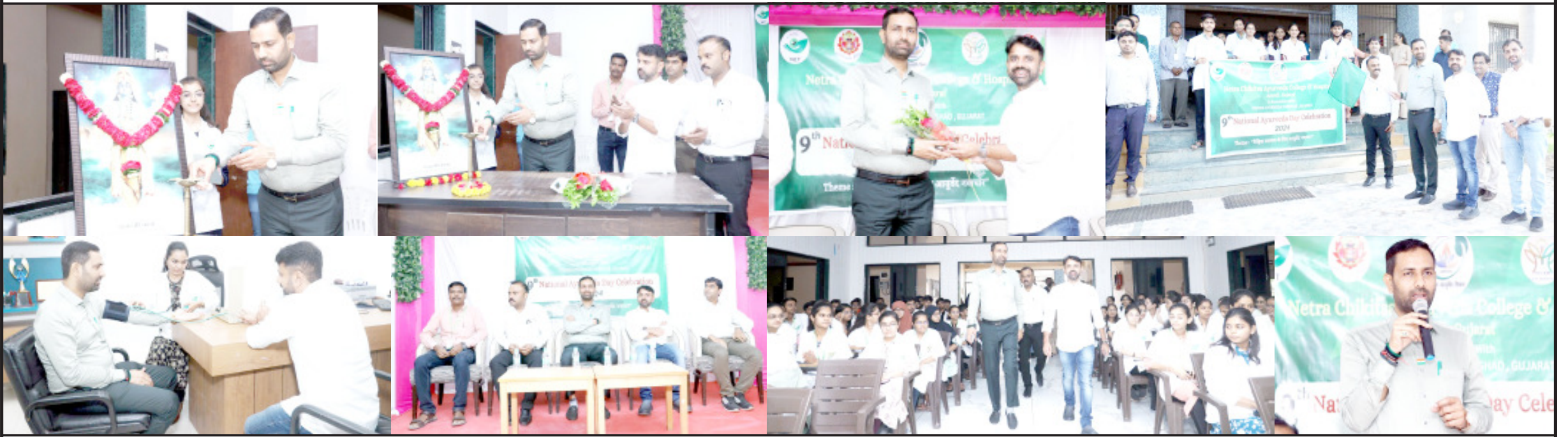
અમરેલી ખાતે નેત્ર ચિકિત્સા ટ્રસ્ટ આયુર્વેદ કોલેજ અને હોસ્પિટલ દ્વારા આયુર્વેદ સપ્તાહની ઉજવણીનો પ્રારંભ નાયબ ઈડક કીશિક વેકરિયાના વરદ હસ્તે કરવામાં આવેલ. આયુર્વેદ સપ્તાહની ઉજવણી અંતર્ગત ૧૫૦૦ જેટલા આયુર્વેદ વૃક્ષો જનતા સુધી પહોંચાડવાનો પ્રારંભ કરવામાં આવેલ. પ્રથમ છોડ નાયબ ઈડકને સંચાલક અર્પણ જાની દ્વારા અર્પણ કરવામાં આવેલ તેમજ જનજાગૃતિ અર્થે યોજાયેલ રેલીને લીલી ઝંડી નાયબ ઈડક દ્વારા આપવામાં આવેલ. તેમજ આ તકે યોજાયેલ આયુર્વેદિક કેમ્પનો આરોગ્ય ચકાસણી કરાવીને નાયબ ઈડકે પ્રારંભ કરાવેલ.