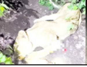
જાકરાબાદ, તા. ૨૩