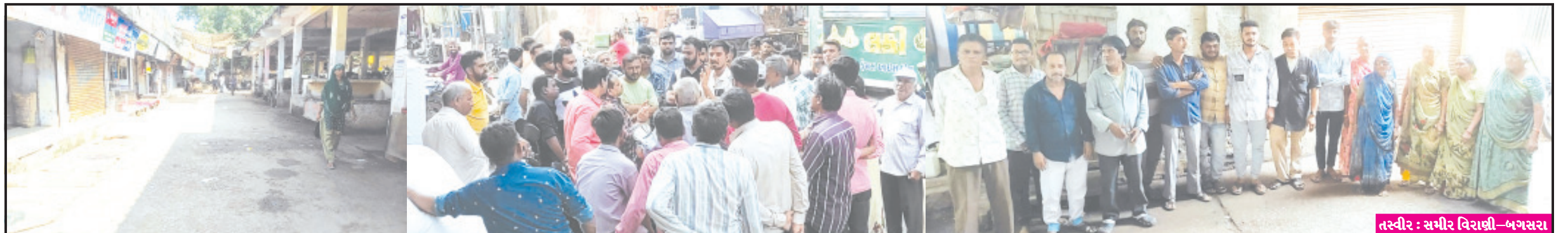
બગસરા, તા. ૨૩ ૨૦૨૨ માં નગરપાલિકાના સત્તાવીશો દ્વારા લારીઓ હટાવાના ઠરાવના પગલે બે વર્ષ બાદ રીક ઓફિસર બગસરા શાક માર્કેટમાં દિવાળી સમયે નાના નાના લારી અનુસંધાન પાના ૬ ઉપર ગઢાવાળા વેપારીઓને હેરાન કરવા અનુસંધાન પાના ૬ ઉપર

રૂપિયા ૨૦૦ની પાવતી ફડાવી લો તો દબાણ સામે આંખ આડા કાન ધરવામાં આવી રહ્યા છે રાજકીય અને આર્થિક રીતે સધ્ધરતા ધરાવનારનું દબાણ દૂર કરવામાં પાલિકાનાં ઠાગાઠેયા કારમી મોઘવારીનાં માહોલમાં ગરીબ રેકડીધારકોને પરેશાન કરવાનું બંધ કરવું જોઈએ નગરસેવકોથી લઈને ધારાસભ્યએ દરમિયાનગીરી કરવી જરૂરી બની