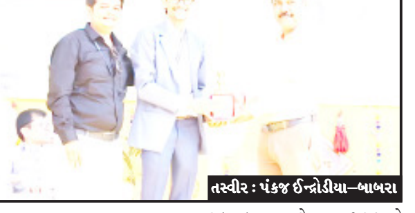
બાબરા, તા. ૨૩

બાબરામાં રહેતા અને ભાવનગર ખાતે કૃષ્ણકુમારસિંહ યુનિવર્સિટીમાં કલા મહોત્સવના કાર્યક્રમમાં તેઓએ તબલા વાદન સ્પર્ધામાં ભાગ લીધો હતો અહી તેમણે પ્રથમ સ્થાન પ્રાપ્ત કરતા યુનિવર્સિટીના અધિકારીઓના હસ્તે શિલ્ડ મળતા બાબરા સોની પરિવારનું ગૌરવ વધાર્યું છે.