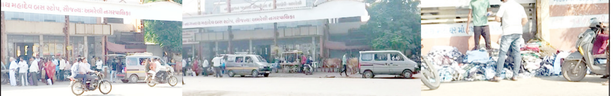
અમરેલી, તા. ૨૨ અમરેલી શહેરમાં છેલ્લા ઘણા મહિનાઓથી જાહેર માર્ગો, ફૂટપાથો ઉપર દિનપ્રતિદિન દબાણ વધી રહ્યું છે. આડેધડ વાહન પાર્ક થતાં હોય શહેરીજનોને માર્ગ પરથી પસાર થવામાં મુશ્કેલીનો સામનો કરવો પડી રહ્યો હોય પાલિકા કે ટ્રાફિક વિભાગ ધ્વારા કોઈ કામગીરી જ કરવામાં આવતી નથી. શહેરનાં રાજમાર્ગ સમાન લાયબ્રેરી રોડ, નાગનાથ ચોક, ભીડભંજન ચોક સહિતનાં વિસ્તારમાં આડેધડ વાહન પાર્કિંગ, રેંકડીઓ અને કેબિનોનો જમલો તો નાગનાથ બસ સ્ટેન્ડમાં પણ વાહનોની હારમાળા તેમજ ફૂટપાથ પર કપડા, પાણીપુરીનું વેચાણ, ગાંધીબાગની ફૂટપાથ પરનું દબાણ સતત વધતું જાય છે. લાયબ્રેરી ચોક અને રામજી મંદિર માર્ગ પરથી પસાર થવું એટલે લોઢાનાં ચણા ચાવવા જેવું કઠીન, ભીડભંજન ચોકમાં પણ ગંભીર પરિસ્થિતિ છતાં કોઈ જ કાર્યવાહી થતી નથી. વાતાનુકૂલિન કચેરીમાં ટ્રાફિક અંગેની મળતી બેઠકનું પણ કોઈ પરિણામ જોવા મળતું નથી.

ઉચ્ચ અધિકારીઓ અને પદાધિકારીઓએ શહેરમાં પદયાત્રા યોજીને સમસ્યાનું નિરાકરણ કરવું જરૂરી