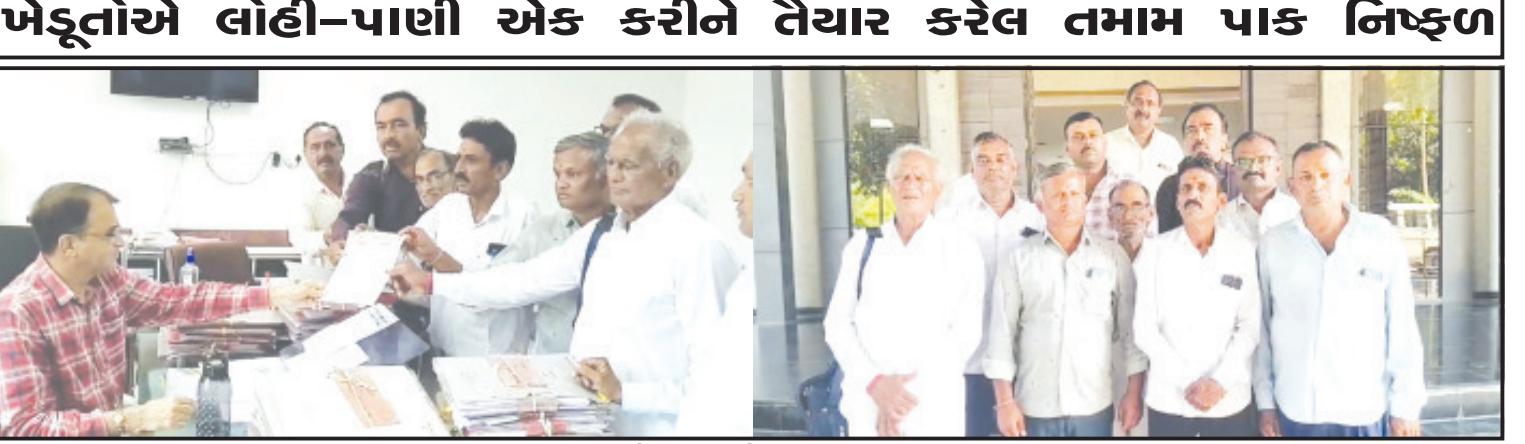
અમરેલી, તા. ૨૨ અમરેલી જિલ્લાનાં મોટાભાગનાં વિસ્તારમાં અતિવૃષ્ટિથી કપાસ, મગફળી, સોયાબીન જેવા પાકોને વ્યાપક નુકસાન થતાં કિસાન સંઘ દ્વારા આજે અમરેલી ખાતે કલેક્ટરને આવેદનપત્ર પાઠવવામાં આવેલ. આવેદનપત્રમાં જણાવેલ છે કે, અતિવૃષ્ટિનાં કારણે લગભગ તમામ પાકો નિષ્ફળ ગયા હોય તાકીદે સર્વે કરીને યુધ્ધનાં ધોરણે ખેડૂતોને આર્થિક સહાય કરવાની માંગ કરવામાં આવી છે.

જિલ્લા કિસાન સંઘ દ્વારા કલેક્ટરને આવેદનપત્ર પાઠવાયું અમરેલી જિલ્લામાં અતિવૃષ્ટિથી મગફળી, કપાસ, સોયાબીન સહિતનાં પાકને વ્યાપક નુકસાન થતાં સહાય કરો ખેડૂતોએ લોહી-પાણી એક કરીને તૈયાર કરેલ તમામ પાક નિષ્ફળ