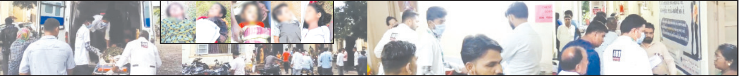
અમરેલી, તા. ૧૯ | કેટલાંક દિવસોથી વરસાદ અને વીજળીએ વધુ સેંદ્ર સ્વરૂપ ધારણ કર્યું હોય. ત્યારે વીજળી પાડવાના કારણે જનમાલનું મોટું નુકસાન થાય છે. ત્યારે આજે સાંજના સમયે વરસાદ સાથે વીજળી પડવાની ગંભીર ઘટના લાઠી તાલુકાના આંબરડી ખાતે ઘટી હતી. જેમાં વીજળી પડવાથી ત્રણ બાળકો સહિત ૫ વ્યક્તિના ઘટના સ્થળે જ મોત થયા હતાં. જ્યારે આ બનાવમાં ૩ વ્યક્તિને ગંભીર ઈજાઓ થતા તાત્કાલિક સારવાર માટે ઢસા ખાતે સારવારમાં ખસેવામાં આવ્યા હતા. અનુસંધાન પાના ૬ ઉપર

વહીવટીતંત્ર અને પદાધિકારીઓ ઘટના સ્થળે દોડી જઈ શ્રમિક પરિવારને મદદ કરી હિંમત અને હુંફ આપ્યા