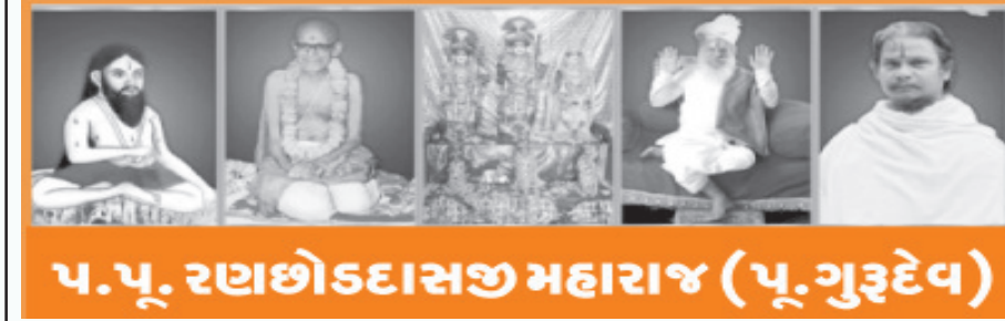
પ.પૂ. રણછોડદાસજી મહારાજ (પૂ. ગુરૂદેવ)

સત્તાના બળથી મારા માસિક હોય તે રીતે વર્તન કરતા અને જાણે રામધામમાં પોતાના ઘરમાં રહેવા દેતા હોય તેમ પોતાની ઈચ્છા પ્રમાણે માઝ જીવન બનાવવાની અપેક્ષા રાખતા. જીવ અહંતાથી ભૂલી જાય છે કે, ઈરકા યદ રાજ હે ઈરકા જલ, ઈરકા થલ, ઈરકા હી અનાજ હે. મારા પ્રશ્નોના પ્રત્યુત્તરમાં એ બહેન બચાવ કરતાં બેલ્યા, “સાધનામાં વિશેષ ન થાય એ સદભાવથી અમે તમને કોઈ ચિટ્ટી