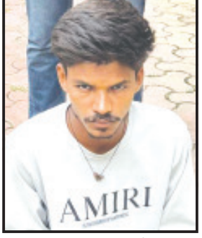
પકડી પાડી આગળની કાર્યવાહી થવા સારૂ બગસરા પોલીસ સ્ટેશનમાં સોંપી આવેલ છે.