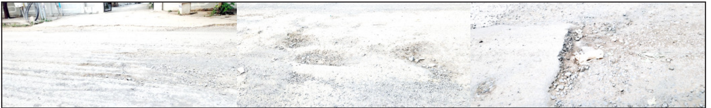
અમરેલી, તા. ૧૮ અમરેલી શહેરમાં રખડતા પશુઓ, આડેવડ વાહન પાર્કિંગ, ત્રિપલ

પાલિકા અને માર્ગ-મકાન વિભાગ યુદ્ધનાં ધોરણે માર્ગની મરામત કરે તેવી માંગ