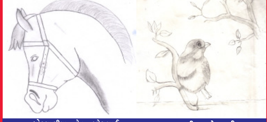
ધોરણ-૮ થી ઓક્ટોફર સ્કૂલ ઓફ સાયન્સ (ધોરણ - ૮ થી ઓક્ટોફર સ્કૂલ ઓફ સાયન્સ)