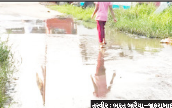
તસ્વીર : ભરત બારેયા-જાફરાબાદ

જાફરાબાદના સામાકાંઠા તલાવડી વિસ્તારનો મુખ્ય રોડ ઉપર વણા સમયથી તળાવ જેમા પાણી ભરેલા હોવાથી નાગરિકો હેરાન પરેશાન થઈ રહ્યા છે અહીં જાફરાબાદની સંખ્યા લોકોની અવર-જવર હોય પરંતુ રોડ વચ્ચે ઘણા સમયથી પાણી ભરેલું હોવાથી મહિલાઓ વિદ્યાર્થીઓના બૂલકાઓ આ ગંધાતા અને દુર્ગંધ મારતું પાણીમાંથી ચાલવા મજબૂર બન્યા છે. પરંતુ પાલિકા ના જવાબદાર લોકોના ધ્યાન ઉપર આવતું નથી અહીં નકાંચર જેવી સ્થિતિ સર્જી રહી હોવા છતાં પાલિકા ના બે જવાબદાર લોકો ના લીધે અહીંના નાગરિકો હેરાન પરેશાન છે. પાલિકા સ્વચ્છતા હી સેવા અભિયાન ચલાવી ફોટો સેશન કરી ઉચ્ચ અધિકારીઓને ઉદ્ધે દેખાડી રહ્યા છે. પરંતુ અહીં જ બાજુમાં ખડકાંચેલા ઉકરડાં તથા બાલકૃષ્ણ સોસાયટી બાજુમાં આવેલ ભૂતાડાદાના મંદિર બાજુમાં ખદબદતી ગંદકી પણ