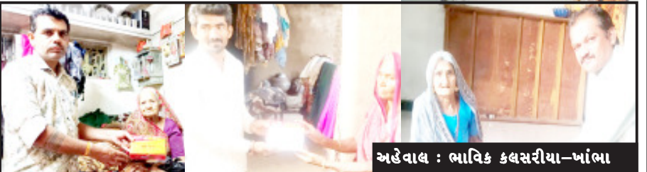
અહેવાલ : ભાવિક કલસરીયા-ખાંભા

૭૦ પરિવારોમાં દશેરામાં મુદતનો માહોલ છવાયો