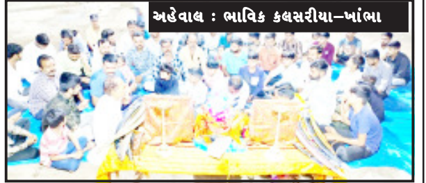
અહેવાલ : ભાવિક કલસરીયા-ખાંભા

ખાંભા, તા. ૧૬ ખાંભા શહેરમાં વિજયાદશમીના દિવસે ક્ષત્રિય સમાજના યુવાનોએ શરત્ર પૂજનનું આયોજન કરવામાં આવ્યું હતું તેમાં ખાંભા શહેરના જુના ગામ વિસ્તારના અંબેમાના મંદિરે મોટી સંખ્યામાં ક્ષત્રિય સમાજના યુવાનો ઉપસ્થિત રહ્યા હતા અને માં અંબાની આરતી ઉતારી શાસ્ત્રોક વિધિ રીતે શરત્ર પૂજન કર્યું હતું અને સાથે વ્યસન મુક્તિનો પણ કાર્યક્રમ યોજાયો હતો તેમાં ક્ષત્રિય સમાજના ઘણા યુવાનોએ વ્યસન મુક્તિ હતું અને હવે ક્યારે અમે વ્યસન નહી કરીએ એવી ખાતરી પણ આપી હતી.