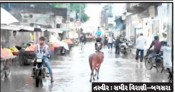
દિવશના વિરામ બાદ આજે ફરી પાછો અડધી કલાકમાં અડધો ઈંચ વરસાદ પડ્યો હતો. જેના પગલે ખેડૂતોની હાલત કંકડી બની ગઈ છે. અને કુદરતે જાણે મોઢામાં

બગસરા, તા. ૧૬ બગસરા શહેરમાં સવારથી અસહ્ય ગરમીને કારણે લોકો ત્રાહિમામ પોકારી ગયા હતા. બપોર બાદ બગસરા તેમજ આજુબાજુના ગામો જેવાકે સાપર, સુડાવડ, મૂંજ્યાસર, રાફળા, માણેકવાડા, જેવા ગામોમાં વીજળીના કડાકા ભડાકા સાથે ધોધમાર વરસાદ પાડ્યો હતો. જેના હિસાબે વાતાવરણમાં ઠંડક પ્રસરી ગઈ હતી. અને શહેરના મુખ્ય માર્ગો ઉપર જાણે નદી વહેવા લાગી હોય તેવા દ્રશ્યો જોવા મળ્યા હતા. જયારે ખેડૂતોની માટી દશા બેસી ગઈ છે. બેદિવશ પહેલા જ ૩.૫ ઈંચ જેવો વરસાદ પડેલ હતો ત્યાર બાદમાં એક