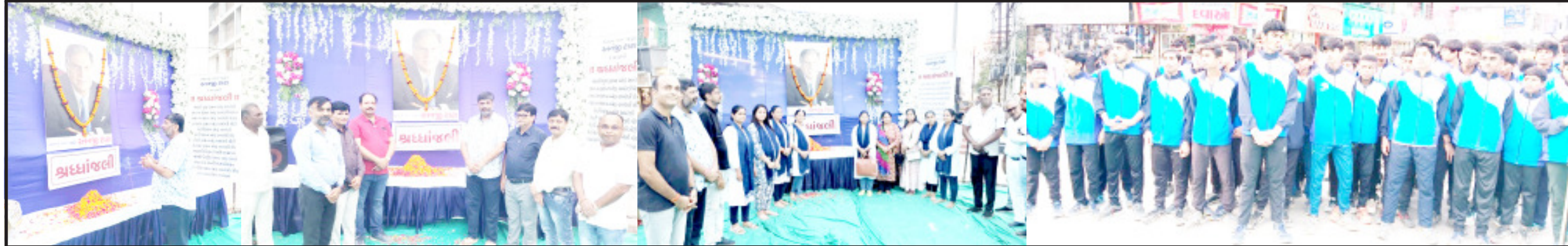
અમરેલીનાં ડો. જીવરાજ મહેતા ચોકમાં દેશનાં ગૌરવતા ઉદ્યોગપતી રતન તાતાનું અવસાન થતાં સદ્ગતને સારહિ યુથ ક્લબના નેતૃત્વમાં લાયન્સ ક્લબ, રોટરી ક્લબ, ડીસ્ટ્રીક્ટ એમ્બર, ઈનર હીલ ક્લબ સહિતનાં સંસ્થાઓનાં પ્રતિનિધિઓએ શ્રદ્ધાંજલી અર્પણ કરી હતી.