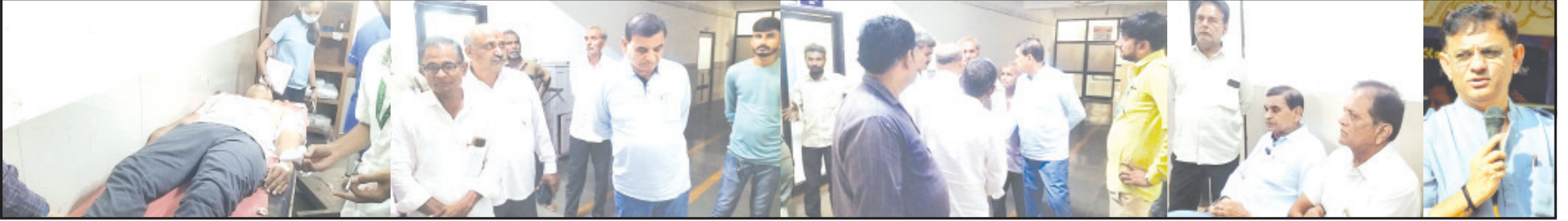
અમરેલી, તા. ૩૦ ભય, ભૂખ અને ભખટાર મુકત શાસન આપી રહ્યાની ગુલબાંગો સત્તાધારી પક્ષનાં આગેવાનો દેકરી રહ્યા