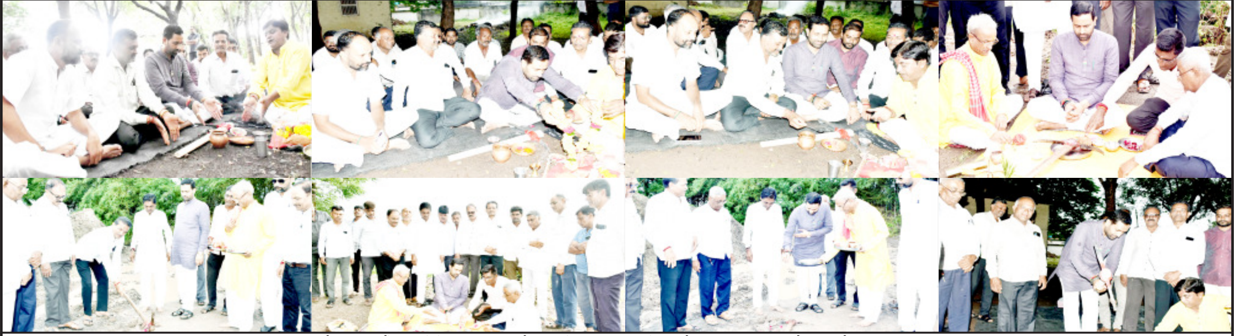
રાજ્ય સરકાર દ્વારા વિકાસકાર્યોની હારમાળામાં અમરેલી જિલ્લો પણ પ્રગતિપથ પર છે. અમરેલી - કુંડલાવાવ - વડિયા