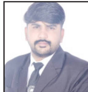
દીકરીને કોઈ ભગાડી ફરીયાદ આઈ પીસી ૩૬૩, ૩૬૬ થી ૩૭૬ (૩) પોકસો એક્ટની કલમ ૪, ૧૮ મુજબ નોંધાયેલ