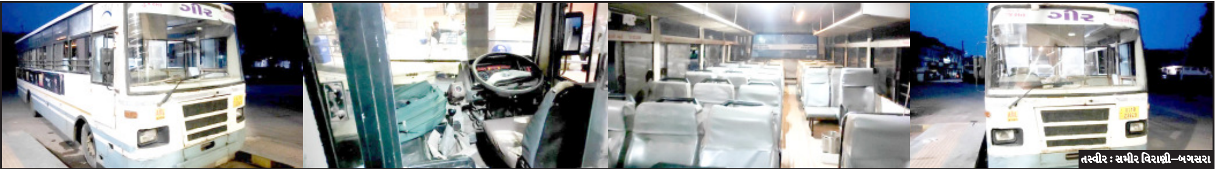
બગસરા, તા. ૬ બહાર આવી રહ્યા છે. બસ સ્ટેન્ડમાં સ્વચ્છતાનો અભાવ, મુસાફરો માટે બેસવા સહિતની સુવિધા જોવા મળતી નથી અને લાંબા રૂટની બસ અવારનવાર મોડી ઉપડતી હોવાની ફરિયાદ ઉભી થઈ રહી છે. દરમિયાનમાં એસ.ટી. ડેપોમાં આજે એક બસનું એન્જિન પોણો કલાક સુધી શરૂ રહ્યું. બસમાં ન કોઈ મુસાફર કે ડ્રાઈવર-કંડક્ટરની પણ ગેરહાજરી વચ્ચે બસનું એન્જિન શરૂ રહે એટલે ખુલ્લેઆમ જનતા જનાર્ટનનાં પરસેવાનાં પૈસાથી ખરીદાયેલ ડીઝલનો ધુમાડો થતાં મુસાફરોએ નિહાળ્યો અને આ ઘટનાનો વિડીયો સોશયલ મીડિયામાં પણ વાયરલ થયો. બગસરા એસ.ટી. ડેપોમાં અનિયમિતતાની હારમાળા સર્જાઈ હોય ઉચ્ચ અધિકારીએ આકસ્મિક ચકાસણી કરવી જોઈએ તેવી માંગ મુસાફરવર્ગમાંથી ઉભી થઈ છે.

સમગ્ર બનાવની તટસ્થ તપાસ કરીને જે કચુરવાન હોય તેની સામે કાર્યવાહી કરવા માંગ