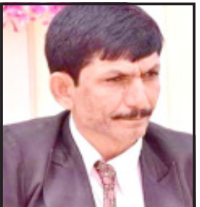
અમરેલી, તા. ૬ ચલાલા પોલીસ સ્ટેશનમાં ભોગ બનનારના પીતાએ તેની સગીર