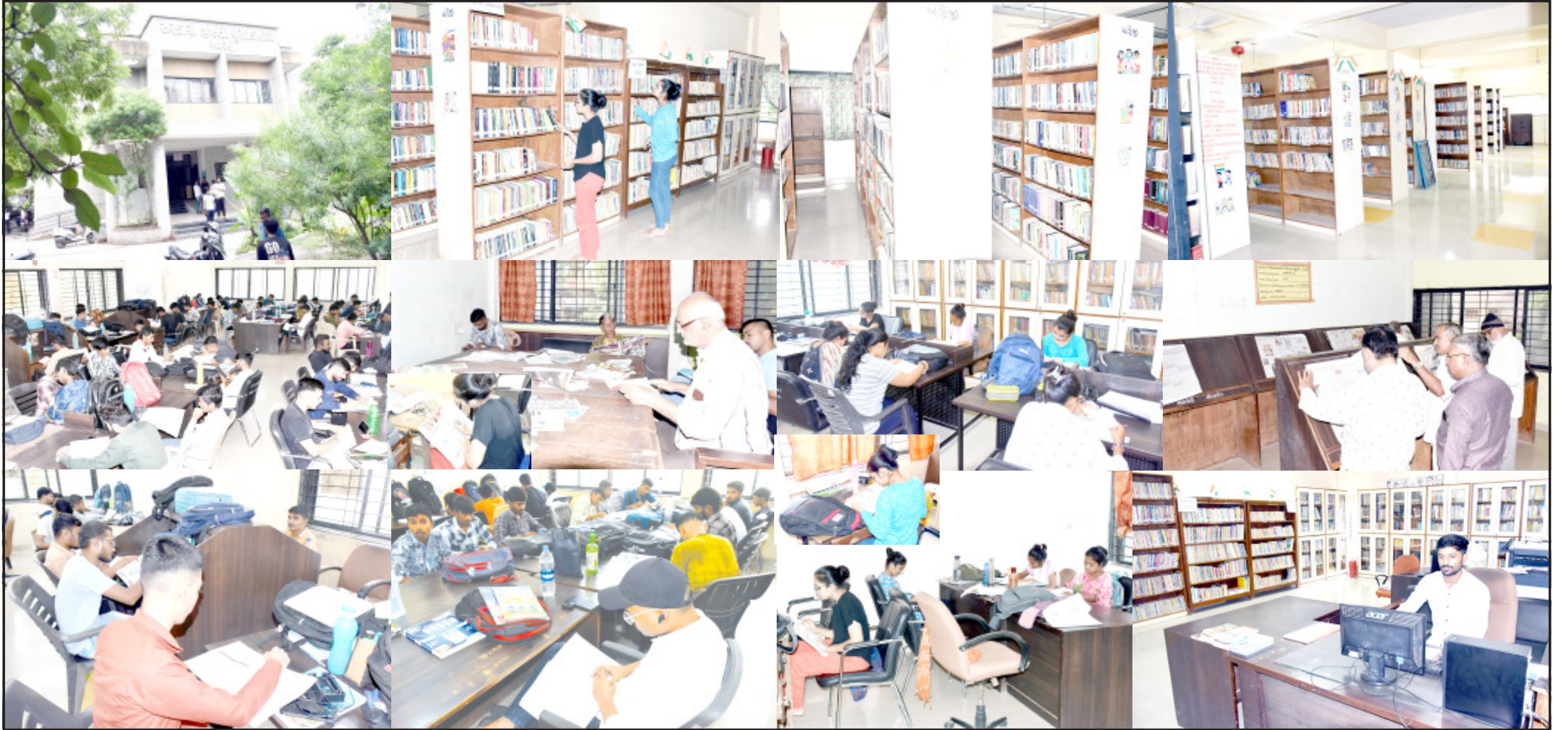
અમરેલી, તા. ૬ ગાયકવાડી શાસનકાળ દરમિયાન વર્ષ ૧૮૮૬માં સ્થાપવામાં

યુપીએસસી, ગ્રુપીએસસી સહિતની સ્પર્ધાત્મક પરીક્ષાનાં ૧ હજારથી વધુ પુસ્તકો