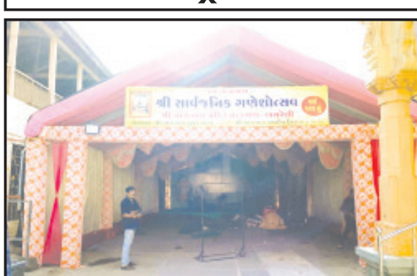
અમરેલી, તા. ૬ અમરેલીનાં ૨૦૦ વર્ષ કરતાં વધુ સમયથી સુપ્રસિદ્ધ સ્વયંભૂ નાગનાથ મંદિરમાં છેલ્લા ૧૨૫ વર્ષથી સાર્વજનિક ગણેશોત્સવનું આયોજન શરૂઆતમાં મહારાષ્ટ્રીય મંડળ અને છેલ્લા ૪૦ વર્ષથી

અગાઉ મહારાષ્ટ્રીયન અને છેલ્લા ૪૦ વર્ષથી નાગનાથ યુવક મંડળ દ્વારા આયોજન