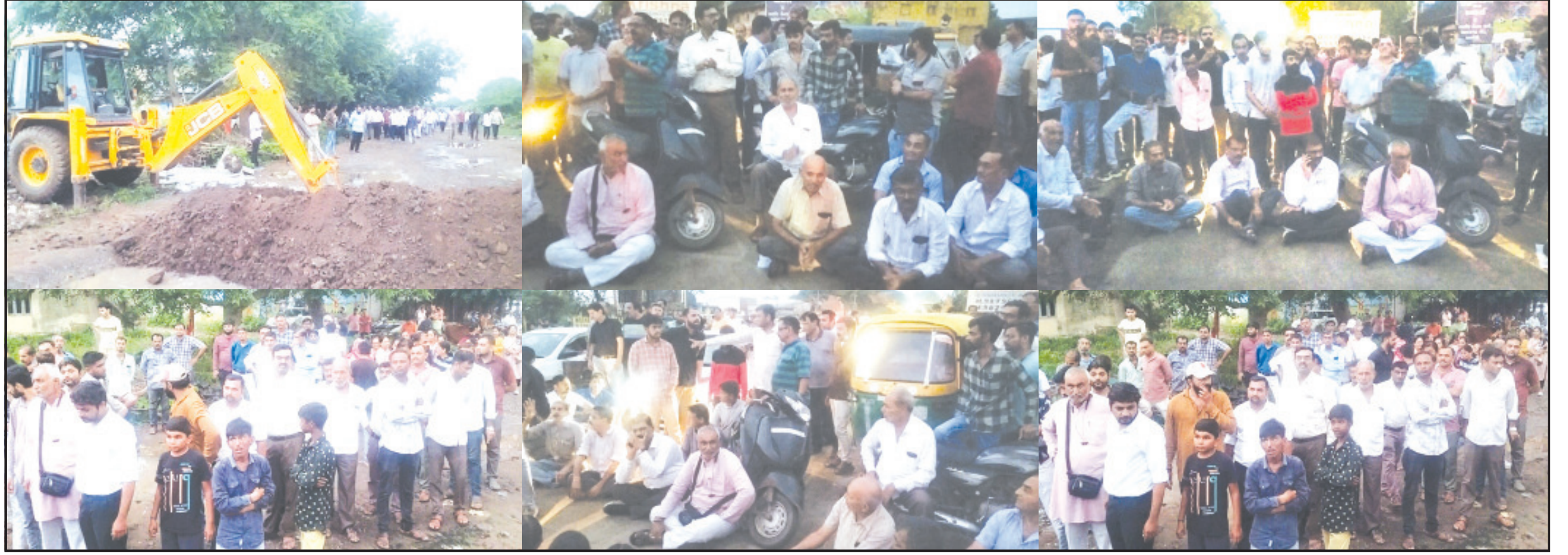
અમરેલી, તા. ૩ અમરેલીમાં આવેલ જુઆઈડીસીનાં વાહનોને વર્ષોથી ચાલતા માર્ગ પર અનેક આડશ આવતાં ઉદ્યોગકારોએ હલ્લાબોલ કરતાં હોવા છતાં પદાધિકારીઓ કે અધિકારીઓ સમસ્યાઓનું સમાધાન શોધી શકતા નથી અને આજે પુનઃ વિવાદ થતાં ટોળેટોળા એકત્ર થતાં પોલીસ ઘટના સ્થળે દોડી હતી. વિગત એવા પ્રકારની છે કે, અમરેલીમાં બ્રોડગેજ રેલ્વે લાઈનનું કામ શરૂ થતાં રેલ્વે સ્ટેશનને પણ મોટું બનાવવું પડે તેમ હોવાથી રેલ્વે વિભાગે રેલ્વેનાં પાટા આસપાસ બંને બાજુની પોતાની માલીકીની જમીન પર બાંધકામ શરૂ કરેલ. દરમિયાન જુઆઈડીસીનાં વાહનો વર્ષોથી રેલ્વે ફાટકની પાસેથી અવરજવર કરતાં હોય તે જમીન ખાનગી માલીકીની હોય તેઓએ એકાદ મહિના પહેલાં તેમની જમીન ફરતે દીવાલ બનાવી લેતા જુઆઈડીસીનાં વાહનોની અવરજવર બંધ થઈ તે વાહનો હનુમાનપરા માર્ગ પર શરૂ થયા. દરમિયાનમાં આજે સાંજે વરસતા વરસાદમાં અચાનક જુઆઈડીસીનાં ઉદ્યોગકારો, નજીકનાં અનુસંધાન પાના ૬ ઉપર

જુઆઈડીસીનાં ઉદ્યોગકારો અને નજીકનાં રહેણાંક વિસ્તારનાં રહેવાસીઓએ હલ્લાબોલ કર્યો છેલ્લા ૪ મહિનાથી જુઆઈડીસીનાં માર્ગને લઈને ચાલતા વિવાદનું કોઈ સમાધાન મળતું નથી બ્રોડગેજ રેલ્વે લાઈનની કામગીરી શરૂ થયા બાદ જુઆઈડીસીનાં વાહનો ચલાવવામાં મુશ્કેલીઓ વરસતા વરસાદે સાંજનાં સમયે રેલ્વે ફાટક નજીક ટોળેટોળા ઉમટતા પોલીસ દોડી