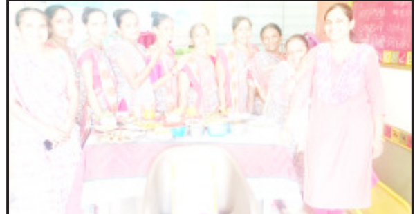
જાફરાબાદ, તા. ૨૫

જાફરાબાદ તાલુકાનાં ટીબી ગામે પોષણ માસની ઉજવણી કરાય આઈ.સી.ડી.એસ. ઘટક જાફરાબાદનાં માર્ગદર્શન મુજબ ટીબી સેજામાં આંગણવાડી કાર્યકર બહેનો દ્વારા વિવિધ વાનગીઓ બનાવીને પોષણ માસ ૨૦૨૪ ની ઉજવણી કરવામાં આવેલ છે. જેમાં ડી.એચ.આર.નાં પેકેટમાંથી બનતી વિવિધ વાનગીઓ બનાવીને નિદર્શન કરવામાં આવેલ હતું. આ કાર્યક્રમમાં સીડીપીઓ મુખ્ય સેલિફાએન.એન.એમ. અને પા.પા. પગલી સ્ટાફ હાજર રહીને કાર્યક્રમને સફળ બનાવ્યો હતો. ભારત સરકારનાં કુપોષિત મુક્ત ભારત બનાવવા માટે સારેન્ડર માસ વિવિધ એક્ટિવિટી મુજબ પોષણ માસની ઉજવણી કરવામાં આવેલ છે. જેમાં સામાન્ય માતા ધાર્મિકતા, અને કિશોરીઓ અને વર્ષની વ્યૂજ્યનાં બાળકો વચ્ચેના અભ્યાસ કરીને કુપોષણ સામેનાં જંગ માટે વડાપ્રધાનને ૨૦૧૮ માં રાષ્ટ્રીય પોષણ અભિયાનની શરૂઆત કરાવી હતી. જેમાં હાલ સાતમાં પોષણ માસની ઉજવણી કરવામાં આવેલ છે.