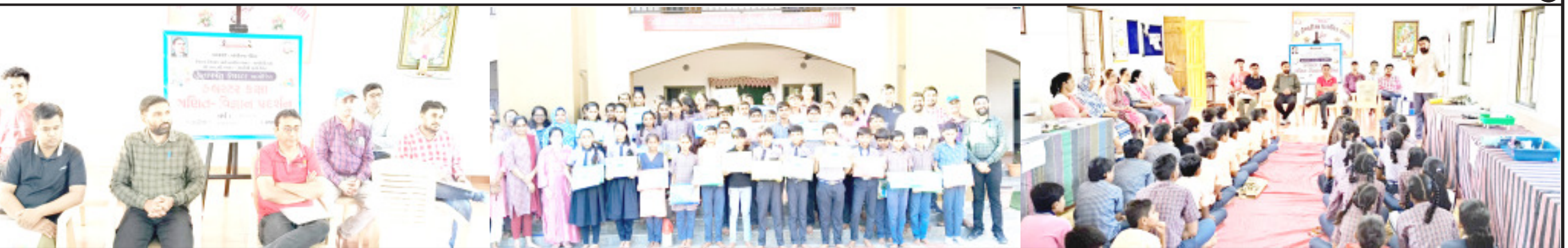
પીએમ 'મદદ' શ્રી ઈશ્વરીયા પ્રાથમિક શાળામાં ફલસ્ટર કક્ષાનો ગણિત વિજ્ઞાન પ્રદર્શન યોજાઈ ગયું. જેમાં પ્રતાપપરા ફલસ્ટરની તમામ શાળાઓના બાળ વૈજ્ઞાનિકોએ ભાગ લીધો હતો. દીપ પ્રાગટ્ય કર્યા બાદ પ્રદર્શનને ખુલ્લું મુકવામાં આવ્યું હતું. જેમાં અલગ અલગ પાંચ વિભાગમાં બાળ વૈજ્ઞાનિકો દ્વારા વૈજ્ઞાનિક અભિગમ કેળવણી તે હેતુરૂપે ૧૭ કૃતિઓ રજૂ કરવામાં આવી હતી. જેમાં નિર્ણાયકો દ્વારા શ્રેષ્ઠ કૃતિ રજૂ કરનાર બાળકોને સન્માનિત કરવામાં આવ્યા હતા. છેલ્લે ભાગ લેનાર તમામ બાળકોને પ્રોત્સાહક ઈનામ આપવામાં આવ્યા હતા. સમગ્ર કાર્યક્રમનું સંચાલન પ્રતાપપરા સી.આર.સી. નિકુલભાઈ મેહતા દ્વારા કરવામાં આવ્યું હતું.