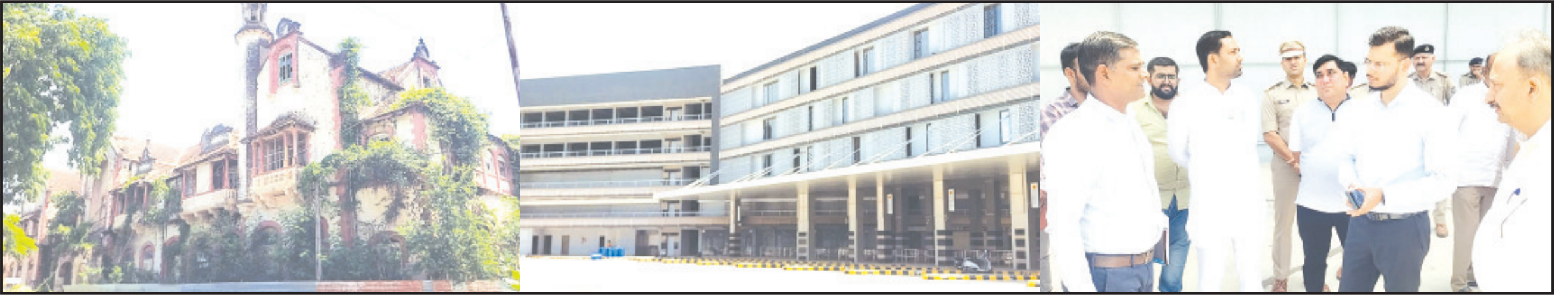
અમરેલી, તા. ૧૩ અમરેલી ખાતે આગામી ૨૦ સપ્ટેમ્બરનાં રોજ રાજ્યનાં મુખ્યમંત્રી ભૂપેન્દ્ર પટેલનાં વરદહસ્તે રાજમહેલનાં રીનાવેશનનો પ્રારંભ અને બસ પોર્ટનું લોકાર્પણ કરવામાં આવશે. તેમજ મુખ્યમંત્રી સાવરકુંડલા, રાજુલા અને ધારી ખાતે પણ ભૂમિપૂજન અને લોકાર્પણ કાર્યક્રમો કરાશે. અમરેલીમાં મુખ્યમંત્રીનાં આગમનને લઈને વહીવટી તંત્રમાં ધમધમાટ જોવા મળી રહ્યો છે. જિલ્લામાં મુખ્યમંત્રીનાં આગમનને લઈને શહેરમાં માગોની મરામત, સફાઈ કાર્ય વેગવંતુ કરવામાં આવ્યું છે.

છેલ્લા એક વર્ષની નગરજનોની માંગ હવે પૂર્ણ થવા તરફ આગળ વધી રહી છે નાયબ ઇન્ડક, કલેક્ટર સહિતનાં પદાધિકારીઓ અને અધિકારીઓએ સ્થળ પરીક્ષણ કર્યું મુખ્યમંત્રીનાં આગમનને લઈને વહીવટી તંત્રમાં ધમધમાટ જોવા મળી રહ્યો છે રાજુલા, સાવરકુંડલા અને ધારી ખાતે પણ મુખ્યમંત્રીનાં હસ્તે ભૂમિપૂજન અને લોકાર્પણ કાર્યક્રમ યોજાશે