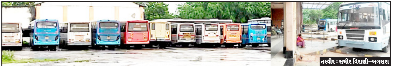
બગસરા, તા. ૧૦ આજ કાલ બગસરા ડેપો વધુ

છેલ્લા ૪ દિવસમાં અનેક રૂટ બંધ થતાં મુસાફરો ખાનગી વાહનમાં મુસાફરી કરવા મજબૂર