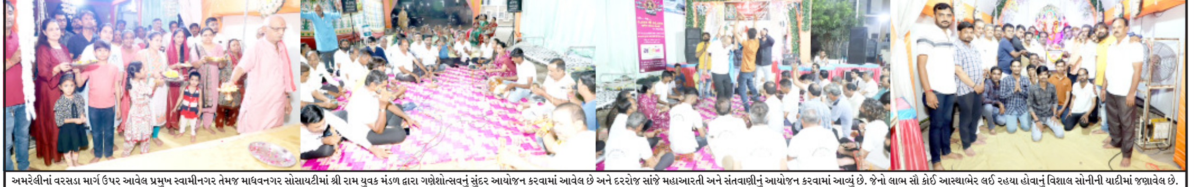
અમરેલીનાં વરસાદ માર્ગ ઉપર આવેલ પ્રમુખ સ્વામીનગર તેમજ માધવનગર સોસાયટીમાં શ્રી રામ યુવક મંડળ દ્વારા ગણેશોત્સવનું સુંદર આયોજન કરવામાં આવેલ છે અને દરરોજ સાંજે મહાઆરતી અને સંતવાણીનું આયોજન કરવામાં આવ્યું છે. જેનો લાભ સૌ કોઈ આસ્થાભરે લઈ રહયા હોવાનું વિશાલ સોનીની યાદીમાં જણાવેલ છે.