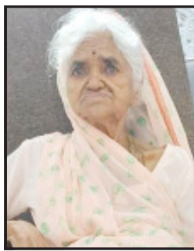
પરિશ્રમ સાટોડીપરા ચલાલા