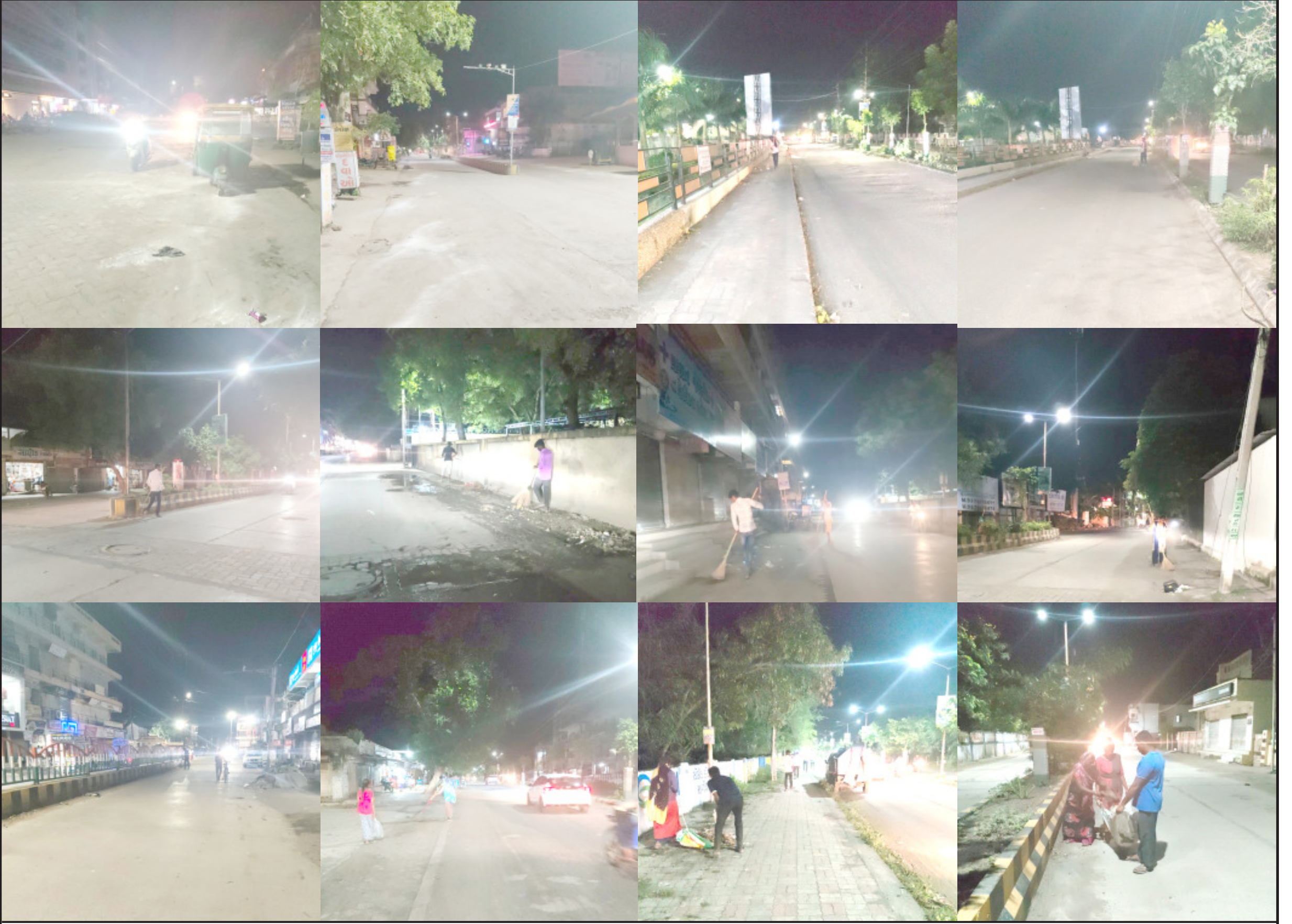
અમરેલી પાલિકા દ્વારા શહેરમાં | એક અડવાડીયાથી દિવસ બાદ રાત્રિનાં પછા | શહેરનાં રાજમાર્ગો ઉપર સફાઈ કાર્ય કરવામાં | આવતાં શહેરીજનોમાં હાથકારાની લાગણી ઉભી થઈ છે. પાલિકા દ્વારા બજારમાં રાત્રિનાં | ટીપરવાની સેવા પછા શરૂ થઈ અને સફાઈ કાર્ય થતાં શહેરમાં હવે, થોડા વર્ષી સફાઈનો માહેલ જોવા મળી રહ્યો છે.