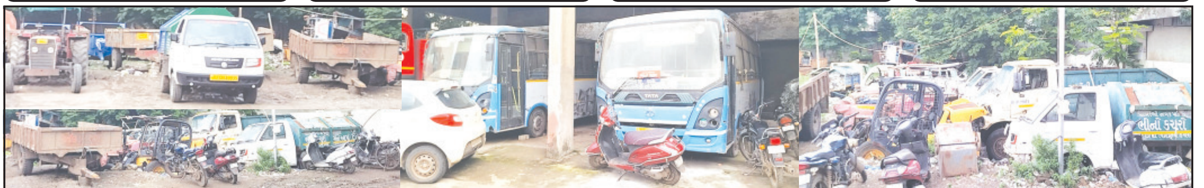
અમરેલી, તા. ૩૧ | પરસેવાનાં પેસાથી લાખો રૂપિયાનાં ખર્ચે પાલિકા દ્વારા ખરીદાયેલ ટ્રેક્ટર, રીક્ષા, સિટી બસ સહિતનાં વાહનો આજે ભંગાર હાલતમાં જોવા મળી રહ્યા છે. અમરેલીનાં હાઈ સમા વિસ્તારમાં આવેલ અને એક્સપ્રેસ હેડરનું ગોરવ ગણાતા હિરકબાગ પર પાલિકાએ કબ્જો જમાવી દીધો છે. "બાગ" તો ગાયબ થઈ ગયો અને તે મે દાનમાં પાલિકાનાં ભંગાર થયેલ વાહનોની કતાર જોવા મળી રહી છે. પાલિકાનાં શાસકોએ તમામ બંધ વાહનોની ચકાસણી કરીને જે વાહન રીપેરિંગથી શરૂ થાય તે કરવું જોઈએ અને જે ભંગાર હાલતમાં હોય તેનો નિકાલ કરવો જોઈએ. તેમજ સિટી બસનો પણ શહેરીજનોનાં હિતાર્થે ઉપયોગ કરવો જોઈએ તેવી માંગ શહેરીજનો કરી રહ્યા છે.

શહેરની મધ્યમાં આવેલ એક સમયનાં ગોરવંતા હિરકબાગમાં ભંગાર વાહનોનો ખડકલો થયો | શહેરીજનોનાં પરિવહન માટે ખરીદાયેલ સિટી બસ પણ બંધ હાલતમાં | ડોર ટુ ડોર કલેક્શન કરનાર ટ્રેક્ટર અને ટીપરવાન પણ પડયા પડયા સડી ગયા | પાલિકાનાં શાસકોએ વાહનોનું રીપેરિંગ અને ભંગાર હાલતમાં હોય તેનો નિકાલ કરવો જરૂરી