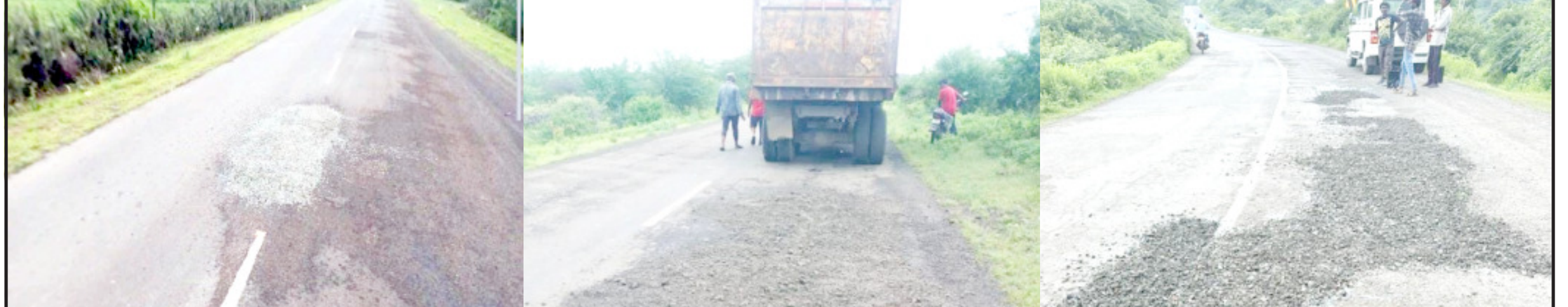
અમરેલી જિલ્લામાં ભારે વરસાદથી અસરગ્રસ્ત બનેલા રસ્તાનું મરામત કાર્ય તંત્ર દ્વારા પૂરજોશમાં શરૂ છે. જિલ્લાનાં ચાવંડ-લાઠી, બાબરા-બંબાળા અને બાબરા-વાસાવડને જોડતા માર્ગનું મેટલિંગથી પેચવક કરવામાં આવી રહ્યું છે જે કામગીરી પૂર્ણતાને આરે છે. આ ઉપરાંત ખંભાળા-કોટડા પીઠા રોડ-થોરખાણ, લાઠી-દામનગર, ટોડા-ઝરખીયા-અડતાળા-ખીજડીયા-શેડુભાર રોડ અને ઢસા-દામનગર-ગારિયાધાર રોડ પર પેચવકની કામગીરી ગણતરીનાં દિવસોમાં પૂર્ણ કરવામાં આવશે. આમ અમરેલી જિલ્લાનાં માર્ગ અને મકાન વિભાગ, રાજ્ય અને પંચાયત દ્વારા માર્ગોના મરામત માટે ઝડપભેર કામગીરી કરવામાં આવી રહી છે.