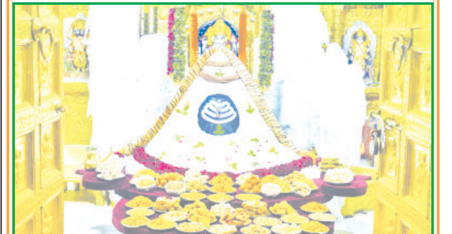
શ્રાવણ કૃષ્ણ ત્રયોદશી પર સોમનાથ મહાદેવને કેલાશ દર્શન શુંગારથી સુશોભિત કરવામાં આવ્યા હતા. કેલાશ પર્વત એ ભગવાન શિવનું નિવાસસ્થાન છે. સોમનાથ મહાદેવના આ વિશેષ શુંગારમાં કેલાશ પર્વત વચ્ચે બિરાજમાન સોમનાથ મહાદેવ શ્રદ્ધાળુને દર્શન દઈ રહ્યા હોય તેવી પ્રતિકૃતિ રચવામાં આવી હતી. સોમનાથ મહાદેવના આ વિશેષ શુંગારના દર્શન કરી ભક્તોના માનસ પર કેલાશ દર્શન કર્યાનો ભાવ સર્જાયો હતો. આ અનુભવ શુંગાર ભક્તોને આધ્યાત્મિક ઉન્નતિ અને શિવના આશીર્વાદ પ્રાપ્ત કરવામાં મદદ કરે છે.