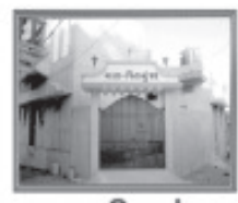
માતા-પિતાનું ઘર (વૃધ્ધાશ્રમ)