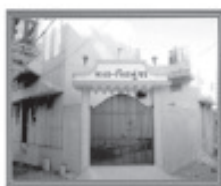
માતા-પિતાનું ઘર (વૃધ્ધાશ્રમ)