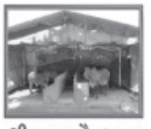
શ્રી કૃષ્ણ ગો-શાળા