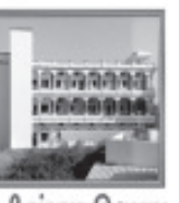
ગાયત્રી સંસ્કાર વિદ્યાલય ધો.૧ થી ૧૨