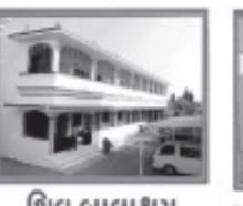
શિવ બાલાશ્રમ (અનાથ આશ્રમ)