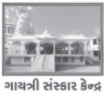
ગાયત્રી સંસ્કાર કેન્દ્ર