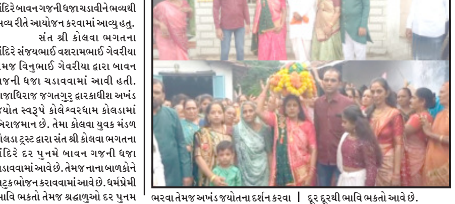
ભરવા તેમજ અખંડ જ્યોતના દર્શન કરવા ઢૂર ઢૂરથી ભાવિ ભકતો આવે છે.