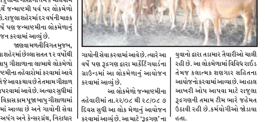
યુવાનો દ્વારા તડામાર તૈયારીઓ ચાલી રહી છે. આ લોકમેળામાં વિવિધ રાઈટના યોજાશે. રાજુલા શહેરમાં દર વર્ષની માફક આ વર્ષે પણ જન્માષ્ટમીના લોકમેળાનું આયોજન કરવામાં આવ્યું છે.