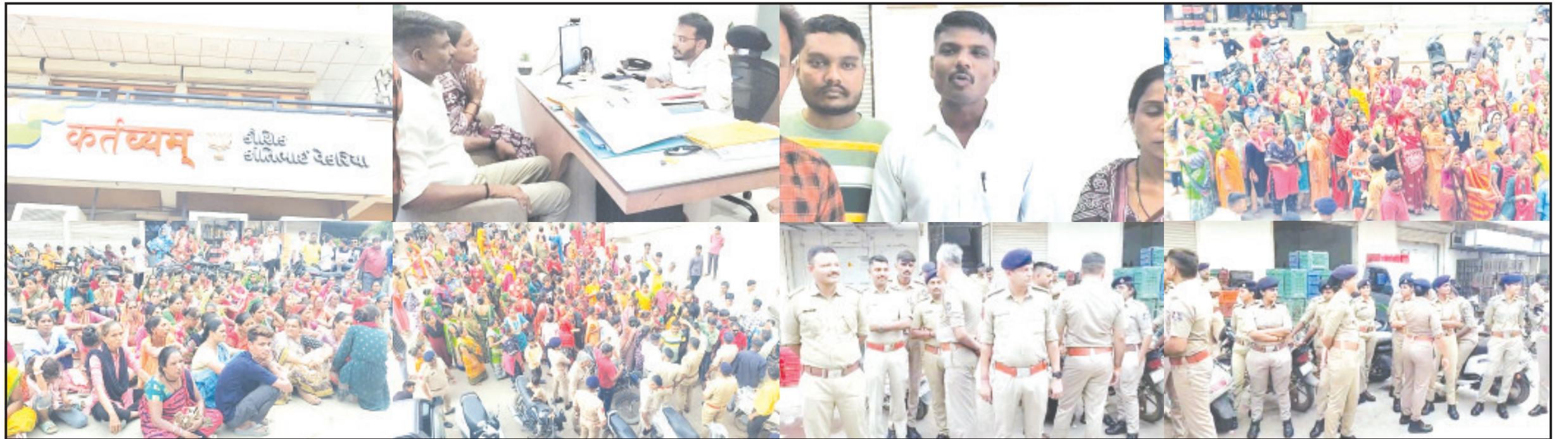
અમરેલી, તા. ૫ | પટાંગણમાં છેલ્લા ૧૦ કરતાં વધુ અમરેલી પાલિકા કરચેરીનાં દિવસથી સફાઈ કાર્યમાં કોન્ટ્રાક્ટ પધ્ધતિ બંધ કરવા સહિતની માંગને લઈને આંદોલન કરતાં ૨૦૦થી વધુ સફાઈ કર્મીઓએ આજે અમરેલીનાં ધારાસભ્ય અને નાયબ ઇન્ડક કૌશિક વેકરિયાનાં જુના માર્કેટયાર્ડમાં આવેલ "કર્તવ્યમ્" કાર્યાલયે ઘોડી ગયા હતા. જોકે નાયબ ઇન્ડક હાજર ન હોય તેમના મદદનીશને રજૂઆત કરવામાં આવી હતી. આ તકે પોલીસનાં ધાડેધાડા "કર્તવ્યમ્" કાર્યાલય ખાતે બંદોબસ્ત માટે ગોઠવી દેવાયા હતા. અમરેલીમાં સફાઈ અનુસંધાન પાના ૬ ઉપર

અમરેલીનાં જુના માર્કેટયાર્ડમાં આવેલ નાયબ ઇન્ડકનાં "કર્તવ્યમ્" કાર્યાલય સામે સફાઈ કામદારો ટોળો વળ્યા નાયબ ડક કાર્યાલય ઉપર હાજર ન હોય યુનિયનનાં અગ્રણીઓએ તેમના મદદનીશને રજૂઆત કરી યુનિયનનાં નેતાએ માંગ પૂર્ણ ન થાય તો ધારાસભ્ય અને સાંસદનો ઘેરાવ કરવાની ચીમકી ઉચ્ચારી પોલીસનાં ધાડેધાડા નાયબ ઇન્ડકનાં કાર્યાલય ઉપર બંદોબસ્ત માટે ગોઠવી દેવાયા