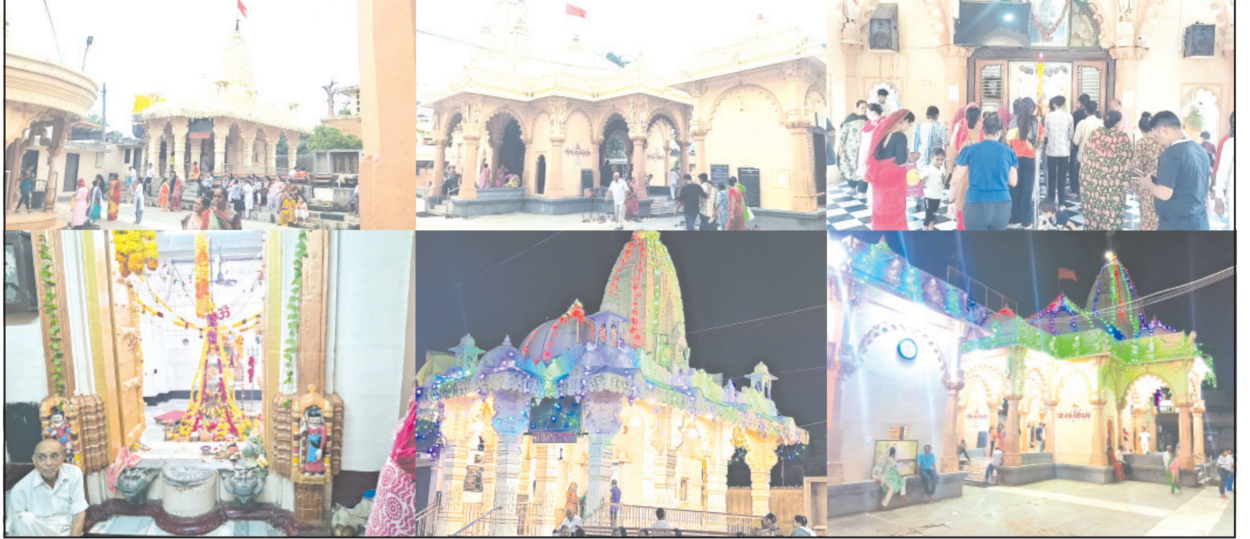
અમરેલી, તા. ૫ | આજે પવિત્ર શ્રાવણ માસનો સોમવારે જ પ્રારંભ થતાં અમરેલી જિલ્લાનાં શિવાલયોમાં વેલી સવારથી મોડી રાત્રિ સુધી શિવભક્તોએ ભગવાન ભોજનાથને જલાભિષેક, દુધાભિષેક, પુષ્પાભિષેક, બિલીપત્ર, શેરીનો રસ સહિતનાં દ્રવ્યો ધ્વારા અભિષેક કરીને ભગવાન શિવનાં આશીર્વાદ મેળવ્યા હતા. સમગ્ર જિલ્લાની જનતા શિવમય બની ચુકી હોય તેવો માહોલ જોવા મળ્યો હતો.

જિલ્લાનાં તમામ શિવાલયોમાં અભિષેક, મહાઆરતી અને દિવ્ય દર્શનનો લાભ શિવભક્તોએ લીધો જિલ્લાનાં સુપ્રસિધ્ધ નાગનાથ મંદિરને નવોટાની જેમ શણગાર કરવામાં આવ્યો વહેલી સવારની પ્રથમ આરતીથી લઈને મોડી રાત્રિ સુધી શિવભક્તોએ દર્શન કરી ધન્યતા અનુભવી સાવરકુંડલા, રાજુલા, ધારી, બાબરા, કુંકાવાવ, બગસરા, વડિયા સહિતનાં તમામ ગામો અને શહેરોમાં શિવાલયોમાં ભીડ ઉમટી