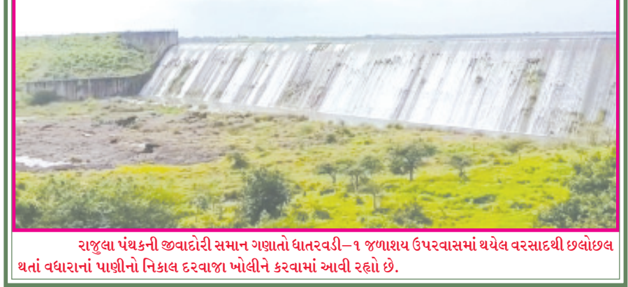
રાજુલા પંચની જવાદોરી સમાન ગણાતો ઘાતરવડી-૧ જળાશય ઉપર વાસમાં થયેલ વરસાદથી છલોછલ થતાં વધારાનાં પાણીનો નિકાલ દરવાજા ખોલીને કરવામાં આવી રહ્યો છે.