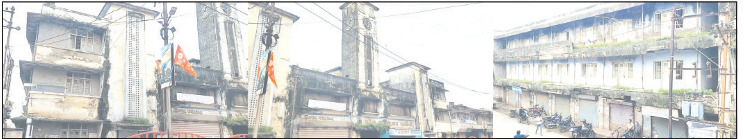
અમરેલી, તા. ૩૦ અમરેલીનાં ઇલેક્ટ્રીસિટી સ્ટેશન રોડ ઉપર આવેલ જિલ્લા પંચાયત સંચાલિત જ્યુબિલી ધર્મશાળાનું દાયકાઓ જુનું મકાન બિસ્માર હાલતમાં હોય જિલ્લા પંચાયત દ્વારા મકાનને સુરક્ષિત કરવામાં આવી રહ્યું છે. અમરેલી જિલ્લામાં એક સમયે ગૌરવવંતી ગણાતી જ્યુબિલી ધર્મશાળામાં ટોકનદરે રહેવાની સુંદર વ્યવસ્થા હતી તો મકાનનાં ગ્રાઉન્ડ ફ્લોર ઉપર રેસ્ટોરન્ટ સહિતની દુકાનો પણ હયાત છે. છેલ્લા એક દાયકા કરતાં વધારે સમયથી ધર્મશાળાની કામગીરી બંધ હતી. મકાન દિનપ્રતિદિન બિસ્માર બની રહ્યું હતું અને જાળવણીનાં અભાવે ધર્મશાળાનું મકાન યમદૂત સમાન જોવા મળતાં જિલ્લા પંચાયત દ્વારા વેપારીઓને વિશ્વાસમાં લઈને મકાનને સુરક્ષિત કરવાની કામગીરીની પ્રારંભ થયો છે.

દાયકાઓ પહેલા જ્યુબિલી ધર્મશાળામાં ટોકનદરે રહેવાની સુંદર વ્યવસ્થા ઉભી કરવામાં આવી જિલ્લા પંચાયત સંચાલિત ધર્મશાળાનું જાળવણીનાં અભાવે પડવાનાં વાંકે ઉભુ થયું છે ધર્મશાળા મકાનને ફરતે આવેલ દુકાનોનાં વેપારીઓએ વૈકલ્પિક વ્યવસ્થાની કરી માંગ ટ્રાફિકથી ધમધમતો વિસ્તાર હોય ધર્મશાળાનાં મકાનનું રીનોવેશન પણ જરૂરી