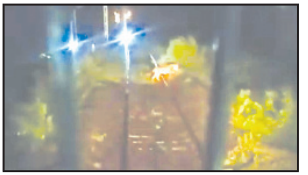
અમરેલી, તા. ૨૮ અમરેલી જિલ્લામાં ફરી એક વખત પાંચ જેટલાં સિંહો રેલ્વે ટ્રેક પર અનુસંધાન પાના ૬ ઉપર

દરિયાકાંઠે વિકાસનાં ધમધમાટ વચ્ચે સિંહોનાં આંટાફેરા રાજુલા-પિપાવાવ સેક્શનમાં રેલ્વે ટ્રેક ઉપર એકી સાથે પાંચ સિંહોનું આગમન ગુસ્સા ટ્રેનનાં પાયલોટની સમય સુચકતાથી અકસ્માત ટળી ગયો