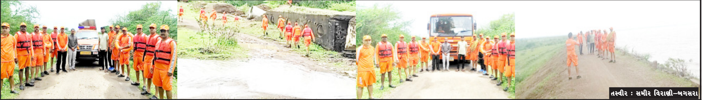
તસ્વીર : સમીર વિરાણી-બગસરા

બગસરામાં મુંજ્યાસર ડેમ તથા અલગ અલગ વિસ્તારોમાં એન ડી આર એફ ની ટીમ દ્વારા મુલાકાત લીધી (સમીર વિરાણી દ્વારા) ગુજરાતમાં હવામાન ખાતાએ રેડ એલર્ટ જાહેર કરી ભારે વરસાદની આગાહીને કારણે ઊભી થનાર સંભવિત પરિસ્થિતિને પહોંચી વળવા રાજ્ય સરકાર દ્વારા દરેક જિલ્લામાં સમીક્ષા બેઠક યોજવામાં આવી છે ત્યારે અમરેલી જિલ્લા વહીવટી તંત્ર સજ્જ બન્યું બગસરા શહેરના મુંજ્યાસર ડેમ ના પાણીના પ્રવાહ ની વિસ્તૃત માહિતી અને તેનું અવલોકન કર્યું આ ઉપરાંત બગસરાના અલગ અલગ વિસ્તારમાં એન ડી આર એફ ની ટીમો મુલાકાત કરવામાં આવી.