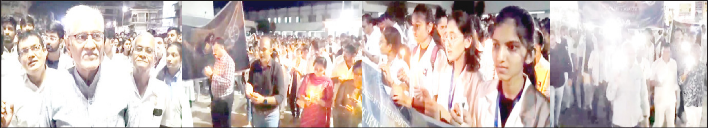
અમરેલીના તબીબોએ પશ્ચિમ બંગાળમાં થયેલ ઘટનાનાં વિરોધમાં મોડી સાંજે જથ્થા કૃત્યોના આરોપીએ કડક સજા આપવાની માંગ સાથે શાંતાબા મેડીકલ કોલેજથી શરૂ કરીને ડો. જીવરાજ મહેતા યોક સુધીની કેન્ડલ માર્ચ યોજી હતી આ તકે આઈએમએ ના પ્રમુખ ડો. ગજેરાએ રોષભરે જણાવેલ કે ડોક્ટરોએ હવે ફરજિયાતપણે હથિયાર રાખવું પડશે આ કેન્ડલ માર્ચમાં મોટી સંખ્યામાં શહેરનાં તબીબો જોડાયા હતા.