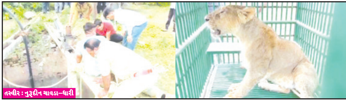
ધારી ફૂવામાં ખાબકી હતી જેમાં એક સિંહણનું કુવાની અંદર મોત નિપજ્યુ હતું. આ સિંહણ કુવામાં ઈજાગ્રસ્ત થઈ હોય મોત થયું હતું. જયારે અન્ય સિંહણ જે કુવામાં હોવાની જાણ થતા વનવિભાગનો સ્ટાફ ઘટના સ્થળે પહોંચી ગયો હતો અને આ સિંહણનું કુવામાંથી રેસ્ક્યુ કરી બચાવી અનુસંધાન પાના ૬ ઉપર

ધારી, તા. ૬ ધારી નજીક આવેલ લાઈનપરા વાડી વિસ્તાર એવા કૃષિશાળાની પાછળ આવેલ વાડીના ખુલ્લા ફૂવામાં આજે એક સાથે બે સિંહણ ખાબકી હતી. આ બંને સિંહણ પોતના ગૂપ સાથે આજુબાજુના જંગલ વિસ્તાર તથા રેવન્યુ વિસ્તારમાં વસવાટ કરતી હતી આ ગૂપમાં કુલ સાત સિંહણ હતી. આ બંને સિંહણની ઉંમર આશરે ૨થી ૩ વર્ષની હતી. આજે મહેલી સવારે બંને સિંહણ કોઈ પણ કારણસર શિકાર પાછળની દોડમાં અથવા તો અન્ય કારણથી આ ખુલ્લા