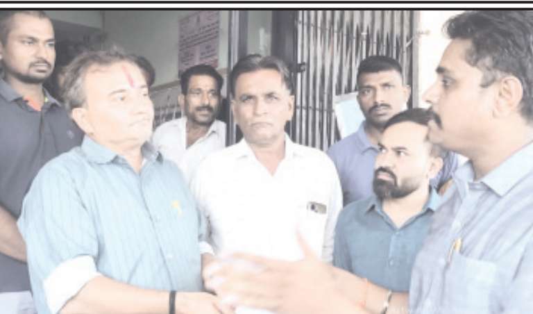
બગસરા, તા. ૨૮ બગસરા ખાતે ભારે વરસાદના કારણે થયેલ નુકસાનનું વળતર આપવા અમરેલી જિલ્લા કિસાન

જિલ્લા કોંગ્રેસ દ્વારા મામલતદારને આવેદનપત્ર પાઠવાયું