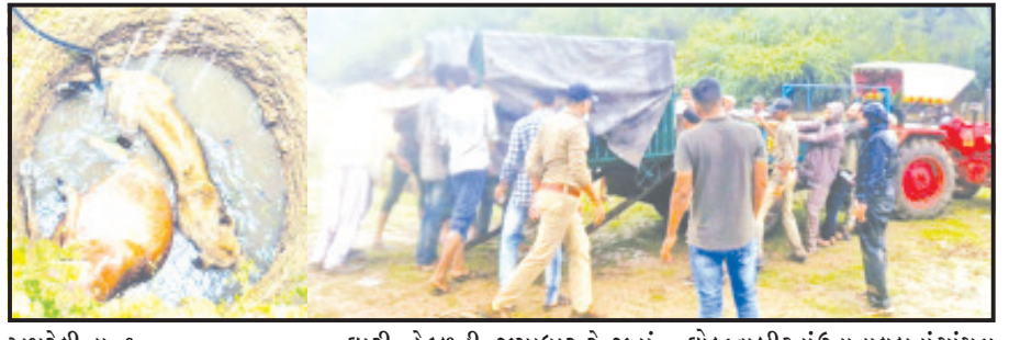
અમરેલી તા. ૧ | ધારી હેઠળની જસાધાર રેન્જનાં કાર્યક્ષેત્ર હેઠળની જસાધાર રાઉન્ડની ધોકડવા બીટનાં ઉના તાલુકાનાં ગાંગડા અનુસંધાન પાના ૬ ઉપર