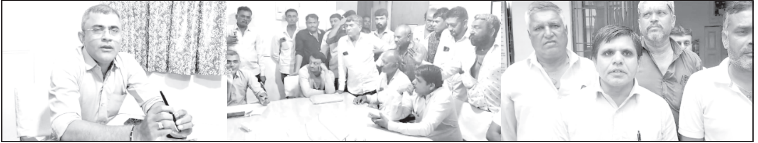
અમરેલી, તા. ૧ અમરેલી જિલ્લામાં કૃષિપ્રધાન છે. જિલ્લાનું અર્થતંત્ર કૃષિ આધારિત છે અને છેલ્લા થોડા દિવસોથી વરસાદનું આગમન થતાં ખેડૂતોએ લાપસીનાં આંધળ મુકીને ખેતી કાર્ય શરૂ કર્યું હોય અને ખેડૂતોને વીજળીની અતિ જરૂરિયાત હોય તેવા સમયે પીપરીયાસીએલ દ્વારા નિયમિત વીજળી અપાતી ન હોય તેકેટલાકે ખેતીકાર્યમાં વિલેપ ઉભો થઈ રહ્યો છે. દરમિયાનમાં આજે બાબરાનાં બળેલ પીપરીયા ગામનાં વીજળી અનિયમિત વીજળીથી કંટાળીને અમરેલી ખાતે આવેલ પીપરીયાસીએલનાં અધિક્ષક ઈજનેરની કચેરીએ આવી પહોંચ્યા હતા અને રોષ વ્યક્ત કર્યો હતો. ખેડૂતોએ જણાવ્યું કે, બળેલ પીપરીયા ખાતે છેલ્લા ૬ દિવસથી ખેતીવાડી માટે વીજળી મળતી નથી અને જ્યોતિગ્રામ યોજના હેઠળ રહેણાંક વિસ્તારમાં પણ કલાકો સુધી વીજળી બંધ રહે છે અને છેલ્લા ૫૦ વર્ષથી વીજ વાયરો બદલવામાં આવ્યા ન હોવાથી અવારનવાર વીજ સમસ્યા ઉભી થતી હોય તાકેટ વીજ સમસ્યા દૂર કરવાની માંગ કરી હતી.

ખેતીની મોસમ શરૂ હોય અતિ જરૂરિયાત હોય તેવા સમયે જ વીજળી મળતી નથી