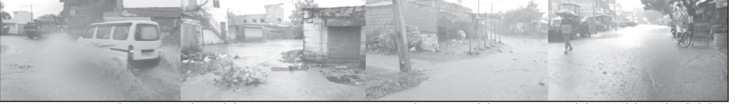
ખાંભા, તા. ૧ | સમયથી કાગળે વાવણી લાયક વરસાદની સાહજોઈ બેઠા હતા ત્યારે સોમવારે બપોરબાદ | સાચો વરસાદ પડીયો હતો વાવણી લાયક વરસાદ થતાં ખેડૂતોમાં આનંદની લાગણી | પ્રસરી હતી અને અને ખાંભા ગીરના રસ્તા ઉપર પાણી ફરી વળ્યા અને માર્ગ યોગ્ય વાળ | રસ્તા ઉપર નદી વહેતી હોય તો વાવણી લાયક હતા ખાંભા શહેરમાં અટી ઈચ જેટલો વરસાદ | ખાંભાકર્યો હતો પીપળવા તાતણીયા નાનુડી બોરાળા કંટાળા બાબરપરા ખડાધાર ડેડાણ | સહિત ગામોમાં ઘોંઘામર વરસાદ પડીયો હતો ગીરના ગામડાઓમાં વાવણી લાયક વરસાદ | થતાં ખેડૂતોમાં ખુશીનો માહોલ જોવા મળી રહ્યો હતો.

આગામી કલાકોમાં પણ વરસાદનાં આગમનનાં એંધાણ જોવા મળી રહ્યાં છે