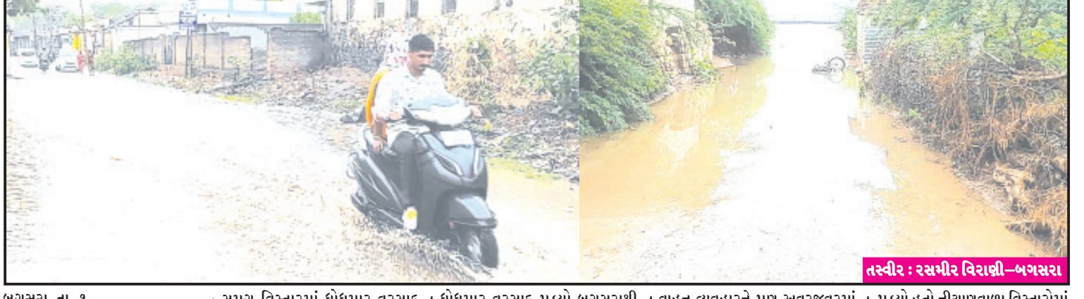
બગસરા, તા. ૧ | બગસરા તાલુકાના હડાળા માવજુંજવા બાલાપુર પીઠડીયા નવા-જુના વાઘણીયા ખારી ખીજડીયા ચારણ પીપળી નાના મુંજ્યાસર મોટા મુંજ્યાસર રકળા આદપુર સહિત સમગ્ર વિસ્તારમાં ધોધમાર વરસાદ વરસાદી પાણી ખેતરોમાં ભરાયા ખેડુતો દ્વારા વાવેતર કરેલ પાકને કાપદાકારક સાબિત થશે હવામાન ખાતાએ આપેલ આગાહીના ભાગરૂપે પંથકમાં પણ સવારથી ધીમીધારે વરસાદ બાદ ધોધમાર વરસાદ પડ્યો બગસરાથી હડાળા શોડ પર ભારે વરસાદના કારણે વાહન વ્યવહારને પણ અવરજવરમાં પારાવાર મુશ્કેલીનો સામનો કરવો પાણી ભરાયા હતા.

હડાળા, માવજુંજવા, બાલાપુર, પીઠડીયા સહિતનાં ગામો દે ધનાઘન