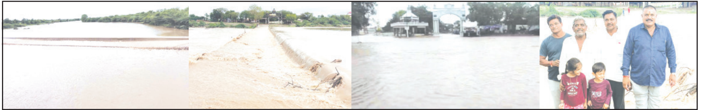
અમરેલી, તા. ૧ | કેટલાંક દિવસોથી મેઘાવી માહોલ જાહેલ હોય. અમરેલી જિલ્લામાં છેલ્લા ૧૨ કલાક દરમિયાન અમરેલી, વડીયા, લાઠી, લીલીયા, સાવરકુંડલા, બાબરા, ખાંભા, બગસરા, જફરાબાદ, રાજુલા સહિતના પંથકમાં હળવાથી લઈ લઈ ઘોંઘાળ પાંચ ઈંચ વરસાદ પડ્યો હતો. અમરેલી પંથકમાં ગઈકાલ સવારથી શરૂ થયેલ વરસાદ આજે ચોથા દિવસે મેઘાવી માહોલ જાહેલ અમરેલી શહેરમાં હળવાથી ભારે વરસાદી ઝાપટા પડતાં શહેરી તથા ગ્રામ્ય વિસ્તારોમાં ધીમીધારે વરસાદથી પાણી ભરાયાં હતાં. જયારે અમરેલીના ઉપરવાસમાં વરસાદ પડતાં અમરેલી નજીક આવેલ ટેબી ઉમમાં નવા નીરની આવક થવા પામેલ છે. જયારે અમરેલી તાલુકાના લાલાવદર, લીલીયાનું ગોઢાવદર, શેઢાડા, સલડી અનુસંધાન પાના ૬ ઉપર

વડિયા, લાઠી, લીલીયા, સાવરકુંડલા, બાબરા, ખાંભા, બગસરા સહિતનાં પંથકમાં વરસાદ જિલ્લામાં અવિરત મેઘ કૃપાથી સમગ્ર પ્રકૃતિ પણ ખિલી હોય તેવું જોવા મળે છે જિલ્લાની નદીઓ, રેકડેમ અને જળાશયોમાં નવા નીરની ભરપૂર આવક સોમવારે સવારનાં ૬ થી રાત્રિનાં ૮ વાગ્યા સુધીમાં ૧૮થી લઈને ૯૯ મી.મી. વરસાદ