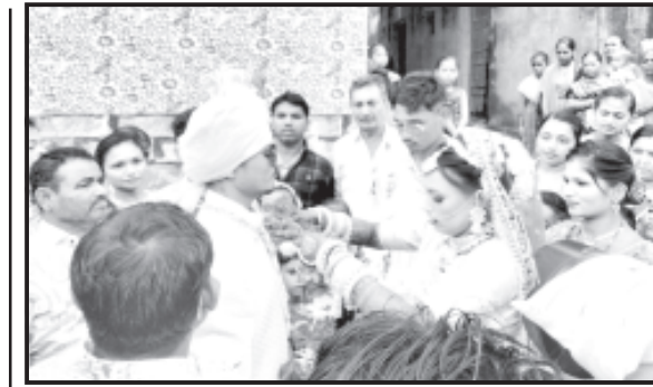
ચોમાસામાં મોંગલિક પ્રસંગો એટલે લગ્નના આ રૂડાં અવસર માટે અગાઉથી છોકરી વાળા લાડકવાળી દીકરી માટે તમામ કરિયાવર દાગીના થી લઈને તમામ ઘરવખરીની ખરીદી કરવામાં આવે છે. છોકરાવાળા લુગડા તેમજ વરરાજાઓના ઘરના તમામ પરિવારોની ખરીદી કરવા માટે પણ જતા હોય છે. સમાજિક ક્યો મારી ફરી દરિયા દેવનો ખોળે ખુદવા સાગરખેડૂ જતા હોય છે. ત્યારે પારવા સમાજમાં લોક પીય ગીત અમે દરિયાનો ખોળે ખુદ નાળ ૧રે પારવા પારવા અલ્લાહ બેલી કે પારવા પારવા અલ્લાહ બેલી જ્યારે એકથી બે

જાફરાબાદ, તા. ૧ જાફરાબાદ કે જે અરબી સમુદ્ર કિનારે વસેલું બંદર છે. અહીં વસવાટ કરતા પારવા સમુદાયમાં અપાઠ માસ એટલે સાગરખેડૂતો માટે લગ્નોના આનંદ મંગલનો અવસર કહેવાય છે. દરિયામાં એક થી બે માસનું માછીમારી વેકેશન આવતા જ સાગરખેડૂતો પરીવારોમાં લગ્ન સરાની સિઝનની ધૂમ મચી છે. બંદર પર રોશનીનો ઝગમગાટ, ટિકરા ટિકરીઓના લગ્ન લેવાયાં બજારમાં ખરીદી નીકળી ઢોલ શરણાઈ ડીજે નાદ ગૂંજ્યા ગોરબાપાના મંગલ શ્લોકો સાથે લગ્નનો માહોલ છવાયો નવ માસ સુધી દરિયા દેવના ખોળે રમતા સાગરખેડૂતો જીવ સટોસટની બાજુ બેલી માછીમારીનો વ્યવસાય કરી પોતાનું ગુજરાન ચલાવે છે. આ આઠ થી નવ માસ દરમિયાન મધ્યરિયે દરિયો ખેડવા જતા હોય છે. મધ્યરિયે અનેક આફતો અનેકવાર કુદરતી આફતનો સામનો કરવો પડતો હોય છે. અનેકવાર તોફાન, બોટ ઊધી પડવી દરિયામાં અકસ્માતે પડી જતું અને જીવ ગુમાવવો દરિયાઈ ક્ષીણિંગ વખતે બિમાર પડી જતું માછી મારી કરતી વખતે જાળ દરિયામાં મુકતી વખતે પવનના મોજામાં બોટ હલકાં હલકાં થવાથી પાડું તથા હાથમાં