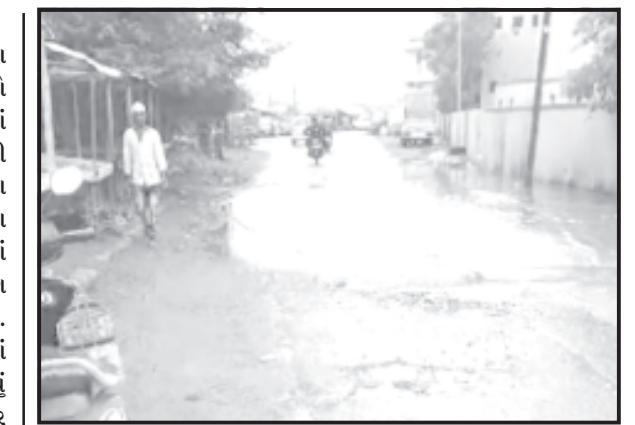
જાફરાબાદ, તા. ૧ જાફરાબાદ પહેલા વરસાદમાં વિકાસ રોડ ઉપર ચડયો પ્રાથમિક સાગર શાળા સ્કૂલની બાજુમાં અને બંદરોક સુધી જ તો માર્ગમાં વરસાદી પાણી ભરાયાં હતાં. અહીં નાના ભૂલકાઓ અભ્યાસ કરવા માટે આવતા હોય છે. આ પ્રાથમિક શાળાની બાજુમાં આંગણવાડી કેન્દ્ર પર હોય ત્યાં બે ત્રણ વર્ષનાં બાળકો પણ આવતા હોય છે. પરંતુ અહીં વરસાદી પાણી ભરાઈ જતાં બાળકોને આ પાણીમાંથી પસાર થવું પડતું હોય છે. અહીં બાજુમાં માર્કેટ પર આવેલી હોય અને મોટી સંખ્યામાં મહિલાઓ શાકભાજીની ખરીદી કરવા જતાં હોય અને તેની બાજુમાં પાણીની તલાવડી ભરાતાં મહિલાઓને પણ આ પાણીમાંથી પસાર થવું પડતું હોય છે. ટેકેટલાકે પાણી ભરાયાં નગર પાલિકાનાં વિકાસમાં રોડ ઉપર તલાવડીઓ ભરાઈ હતી. તો બીજા બાજુ સામાકાંઠે આવેલ તલાવડી વિસ્તારમાં છલ્લા ઘણાં સમયથી બદલતી ગંદકીની સાફસાઈ કરવામાં આવતી નથી. અહીં પહેલા વરસાદમાં ગંધાતા ગટરનાં પાણી રોડ ઉપર ચડવા લાગ્યાં હતાં. આ ગંધવાડાનાં લીધે નાગરિકોનું સ્વસ્થ્યનાં જોખમ આવે તે પહેલાં ધ્યાન પુરતા પ્રમાણમાં કરવામાં ન આવતા ફક્તને ફક્ત વરસાદી ઝાપટ આવવાથી રોડ ઉપર નગર પાલિકાની વિકાસની પીપુડી વાગી રહી હતી, અને નગર પાલિકા ઝરમરિયામાં અવિકાસ ફરી પીપુડી વગાડવા લાગ્યો અને ત્યાંથી નાહિમામ પોકરાવી દે એવી ગંધકે માથું ફાટે આવું તો જાફરાબાદમાં અનેક જગ્યાએ જોવા મળી રહ્યું છે. બસતરી લેનાર કોઈ નથી ગટરના ગંધા પાણી રોડ ઉપર જાફરાબાદ નગર પાલિકા નો વિકાસ દર્શાવી રહ્યો હતો કે, ચોમાસા પહેલા જેડુનેજ, ચેમ્બરો, નાળા ગટરો સાફ સફાઈ કરવા જોઈએ.

ખ્યાલ પણ કે કોઈ બોટનું મશીન બંધ થઈ ગયું હોય અમુક સમય બરાબ વાતાવરણના લીધે બોટમાં વાયરલેસ હોય પરંતુ વાતચીત ન થઈ શકે બોટમાં મોબાઈલ પર હોય પરંતુ નેટવર્ક હોય ત્યાં સુધી વાતચીત થઈ શકે મધ્યરિયે સાગરખેડૂતો ભીમાર હોય તથા હાઈ એટક આવ્યો હોય બોટમાં અકસ્માતે ગંભીર ઈજાગ્રસ્ત થયા હોય ત્યારે સાગરખેડૂતોને તાત્કાલિક સારવાર ન મળતાં અનુભવ જીવ ગુમાવવો પડે છે. તો તાત્કાલિક સારવાર મળી જાય તેવી સુવિધાઓ ન હોવાથી દર વર્ષે અનેક સાગરખેડૂતોનાં મૃત્યુ થતાં હોય છે. સરકાર ૧૦૮ ઈમરજન્સી મેડિકલ સ્પીડ બોટ વહેલી તકે ફાળવણી કરે તેવી આશા સરકાર પાસે રાખતા સાગરખેડૂતો હાલમાં જાફરાબાદ પારવા સમાજમાં લગ્નસરાની મોસમ ચાલુ છે પહેલા પારવા સમાજમાં સમુલ્લગ્ન યોજાતા ત્યારે સૌ સમુલ્લગ્નમાં જોડાતા પરંતુ ધીમે ધીમે લોકોમાં સમજણ આવી એટલે હવે ઘરે ઘરે લગ્ન કરી રહ્યા છે. સમુલ્લગ્નમાં ફક્તને ફક્ત રાજકીય મેળ વડા સીવાય કશું હોતું નથી લોકો ઘરે ઘરે લગ્નમાં સૌ પરિવારો સાથે ખુબજ ઉત્સાહ સાથે ઘરોમાં રંગરોગન તથા રંગબેરંગી લાઈટિંગથી ઘરને અને ઘર આંગણે મંડપને પણ શણગારવામાં આવે છે.