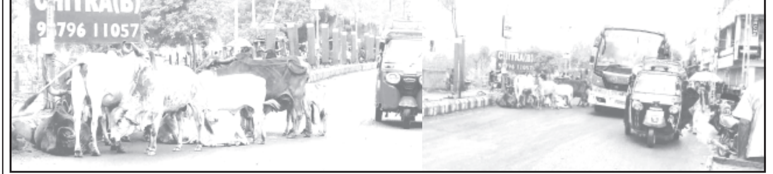
અમરેલી, તા. ૧ અમરેલી, સાવરકુંડલા, રાજુલા, બાબરા સહિત તમામ શહેરોમાં લગભગ બેથી ત્રણ દાયકાથી રખડતા પશુઓની સમસ્યા આગળ વધી રહી છે અને પાલિકા, પશુપાલન કે અન્ય કોઈ વિભાગ પાસે રખડતા પશુઓને સલામત સ્થળે ખસેડવાનું કોઈ આયોજન જ નથી. તાજેતરમાં સમગ્ર જિલ્લામાં વરસાદી માહોલ હોવાથી રખડતા પશુઓ જાહેર માર્ગ અડિંગો જમાવતા હોય ટ્રાફિક સમસ્યા તેમજ અકસ્માતની ઘટના બનતી હોવાથી જનતા અને વાહનચાલકો પણ પરેશાન બન્યા છે. સાવરકુંડલાનાં જાહેર માર્ગ ઉપર રખડતા પશુઓનાં ટોળાં ઉભા હોય શહેરોનો વ્યાપક પરેશાની ભોગવવી પડી રહી છે.

વરસાદી માહોલમાં પશુઓ જાહેર માર્ગો પર ટોળે વળતા પરેશાની