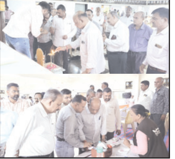
લીધેલ હતો. આ ઉપરાંત આયુષ્યમાન નવા કાર્ડ કુલ-૪૫૪ રિન્યુયલ કાર્ડ કુલ-૨૧૯ અને આભા કાર્ડ કુલ-૨૧૯ તેમજ આધાર કાર્ડ કુલ-૮૨ કાઢી આપવામાં આવેલ.

લાઠી, તા. ૧૬ ગુજરાતમાં પ્રથમ વખત અમરેલી જિલ્લા પંચાયતની કુલ-૩૪ સીટ વાઈઝ ગામોમાં તા. ૧૫/૦૭/૨૦૨૪ ના રોજ 'સર્વ રોગ નિદાન કેમ્પ'નું આયોજન કરવામાં આવેલ હતું. જે અંતર્ગત અમરેલી જિલ્લાનાં લાઠી તાલુકાના મતીરાળા ગામે તા. ૧૫/૦૭/૨૦૨૪ના રોજ સવારના ૯:૦૦ કલાકે 'સર્વ રોગ નિદાન કેમ્પ'નું ઉદઘાટન અમરેલી જિલ્લાનાં સાસંદ ભરતભાઈ સુતરીયાના વરદ હસ્તે કરવામાં આવ્યું હતું. આ તકે જિલ્લા વિકાસ અધિકારી પી.બી. પંડ્યા ઉપસ્થિત રહેલ. તેમજ સમગ્ર જિલ્લામાં જિલ્લા પંચાયત સીટ વાઈઝનાં ગામોમાં જે તે વિસ્તારનાં ધારાસભ્ય, જિલ્લા પંચાયત અમરેલીનાં ચેરમેન તથા સદસ્યઓ ઉપસ્થિત રહ્યા હતા. અમરેલી જિલ્લાની સીટ વાઈઝ કુલ-૩૪ ગામોમાં યોજાયેલ 'સર્વ રોગ નિદાન કેમ્પ'માં કુલ-૭૦૬૯ જરૂરિયાતમંદ લાભાર્થીઓએ લાભ