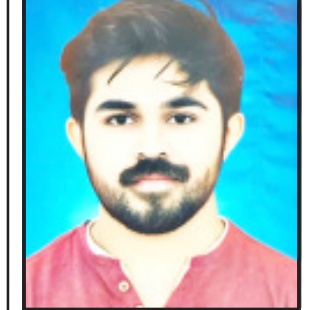
ભાભાઓટોમિક રિસર્ચ નામના સંસ્થામાં ટેકનિક ઓફિસર તરીકે નિમંણુક મેળવી હોય કલેક્ટર, નાયબ કમિશનર સહિત શુભકામના પાઠવી.