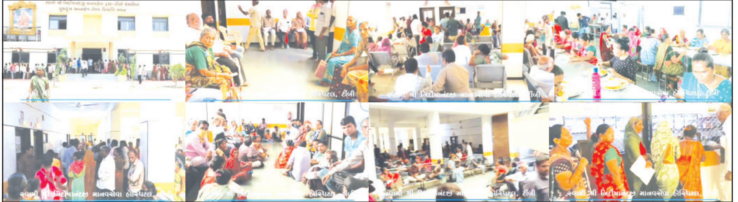
અમરેલી, તા. ૧૬ અમરેલી-વલ્લભીપુર હાઈવે ઉપર આવેલ ટીબી ગામ ખાતે