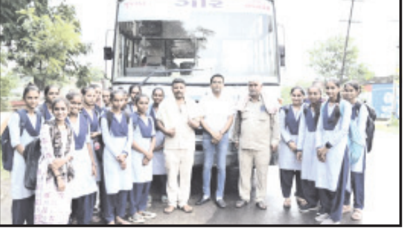
તસ્વીર : કમર્યારીઓનું મોં મિઠું કરાવી પાલ ઓઢાડી સન્માન કરેલ. આ તકે વિદ્યાર્થીઓમાં આંનદ જોવા મળેલ.