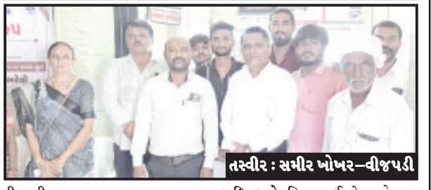
તસ્વીર : સમીર ખોખર-વીજપટ્ટી

જિલ્લા આરોગ્ય વિભાગ દ્વારા વીજપટ્ટી ખાતે વિનામૂલ્યે સર્વ રોગ નિદાન કેમ્પ યોજાયો મોટી સંખ્યામાં દર્દીઓએ લાભ લીધો