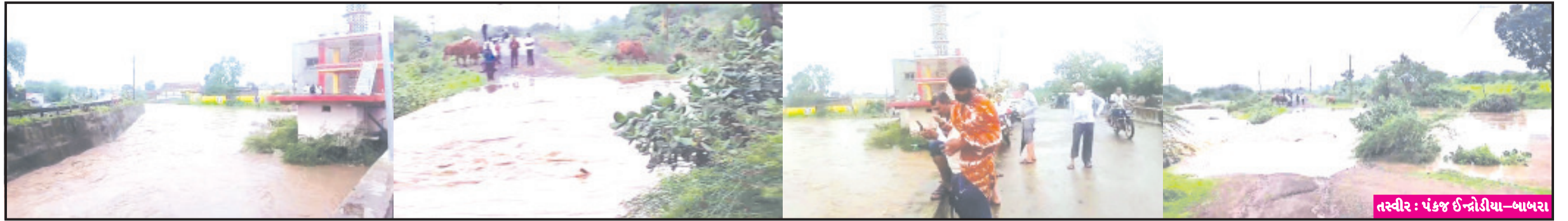
તસ્વીર : પંકજ ઈન્ડોરીયા-બાબરા અમરેલી, તા. ૧૬ અમરેલી જિલ્લામાં આજે અનેક વિસ્તારોમાં હળવાથી ભારે વરસાદ પડ્યો છે. અમરેલીમાં અવારનવાર હળવા ઝાંપટા પડ્યા હતા તો બાબરાનાં ગ્રામ્ય વિસ્તારમાં અર્ધાંથી લઈને ૪ ઈંચ જેટલો વરસાદ પડ્યો હતો. બાબરામાં રાજ્યના હવામાન વિભાગની આગાહી અનુસાર સવારથી વાતાવરણ વરસાદનું બંધાયું હતું પણ શહેરમાં દિવસ દરમિયાન માત્ર ઝાંપટા પડતા હતા પણ તાલુકાનાં ગ્રામ્ય વિસ્તારોમાં અડધા ઈંચથી ૪ ઈંચ જેટલો લગભગ ગામડાઓમાં પડ્યો હતો પણ સૌથી વધુ વરસાદ તાલુકાના ઉંટવડ ગામે પડ્યો હતો. અહીં ગામમાં તેમજ સિમ વિસ્તાર ત્રણ ઈંચ જેટલો વરસાદ પડી જતા ઉંટવડ ગામની સ્થાનિક નદીમાં પુર આવ્યું હતું જેને જોવા લોકો ટોળે વળ્યાં હતા. બાબરા તાલુકાનાં ગ્રામ્ય વિસ્તારમાં બપોર બાદ જોરદાર વરસાદ પડતાં ગામની સ્થાનિક નદીઓમાં અનુસંધાન પાના ૬ ઉપર

નીલવડા અને સમટીયાળા ગામે ૩ થી ૪ ઈંચ વરસાદ પડતાં કાળુભાર નદીમાં ભારે પુર આવ્યું ઉંટવડ ગામમાં ૩ ઈંચ વરસાદ પડતાં સ્થાનિક નદીમાં આવ્યું ઘોડાપુર નીલવડા અને સમટીયાળા બંને ગામ સંપર્ક વિહોણા બનતાં તંત્ર દોડ્યું કોળવેને દૂર કરી ઊંચા પુલ બનાવવામાં આવે તેવી માંગ ઉભી થઈ