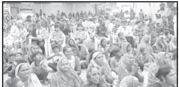
કરોડો લીટર પાણી ચોમાસાનાં પ્રથમ રાઉન્ડમાં પડેલ વરસાદથી સંગ્રહ થયો છે. આનાથી આ વિસ્તારનાં ૧૦૦ જેટલા ગામડોઓનાં જળસ્તરમાં ફાયદો થશે. જળક્રાંતિનું સર્જન થશે. આ વિસ્તારમાં પાછલા સાત વર્ષથી થઈ રહેલ જળ સંચય કામગીરીથી જમીનનાં જળસ્તર ઉચ્ચા આવી ગયા છે.