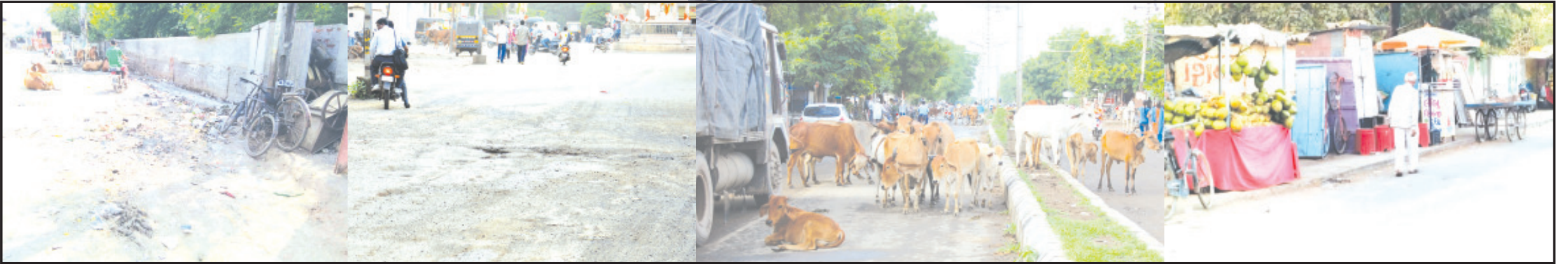
અમરેલી, તા. ૧૦ રાજ્યને ડો. જીવરાજ મહેતાનાં રૂપમાં સૌપ્રથમ મુખ્યમંત્રીની

મધ્યમકક્ષાનાં શહેરની સમસ્યા શાસકો ધારે તો એક વર્ષમાં દૂર થઈ શકે તેમ છે