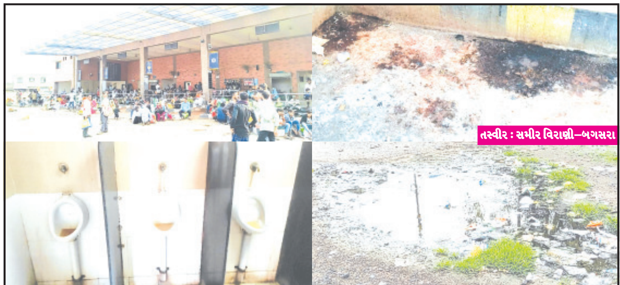
બગસરા, તા. ૧૦ મુસાફરોને ડેપોમાં બેસવું પણ મુશ્કેલ બની ગયું છે. એટલું જ નહિ પરંતુ અહીંના યુરીનલમાં વુશવું તો ટીક પરંતુ ત્યાંથી અનુસંધાન પાના ૬ ઉપર

વિભાગીય નિયામકે આજ્ઞા પંખેરીને તપાસ કરવી જરૂરી બગસરાનાં એસ.ટી. ડેપોમાં અનિયમિત બસ રૂટ બાદ હવે બેફામ ગંદકીની સમસ્યા ઉભી થઈ એરપોર્ટ જેવા બસપોર્ટની ગુલબાંગો અને વાસ્તવિકતા ભયાનક