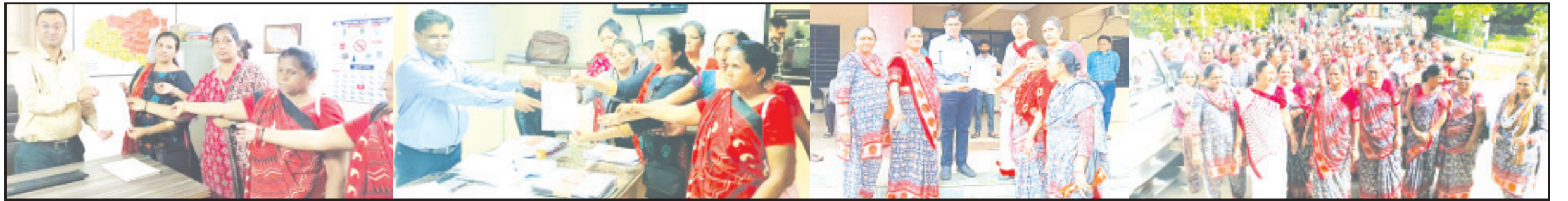
અમરેલી, તા. ૧૦ મહિલાઓની હોવાથી જ્યાં સુધી મહિલાઓનું સશક્તિકરણ નહીં થાય ત્યાં સુધી ભારત વિકસિત નહીં બને તે નક્કી છે. પાલામંટમાં પણ ૩૩ ટકા બેઠકો મહિલાઓ માટે અનામત રાખવાની અનુસંધાન પાના ૬ ઉપર

આશાવર્કર કામનાં કલાકો અને વેતન નક્કી કરવા સહિતની માંગ રજૂ કરી આંગણવાડી વર્કરોએ વેતનમાં અને અન્ય સુવિધામાં વધારો કરવા માંગ કરી મહિલા સશક્તિકરણનાં માહોલમાં મહિલા કર્મીઓ ન્યાય માટે સતત રજૂઆત કરે છે રાજ્ય અને કેન્દ્ર સરકારે મહિલાઓની વ્યાજબી માંગ પૂર્ણ કરવી જરૂરી છે