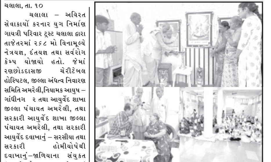
ચલાલા, તા. ૧૦ ચલાલા - અવિરત સેવાકાર્યો કરનાર યુગ નિર્માણ ગાયત્રી પરિવાર ટ્રસ્ટ ચલાલા દ્વારા તાજેતરમાં ૨૬૮ મો વિનામૂલ્યે નેત્રચણ, દંતચણ તથા સર્વરોગ કેમ્પ યોજાયો હતો. જેમાં ૧૪૯ દર્દીઓએ નેત્રચણ, દંતચણ, સર્વરોગ સારવાર કેમ્પમાં ભાગ લીધો હતો. જેમાં ૩૩ દર્દીઓને ફેકોમશીન દ્વારા વિનામૂલ્યે ઓપરેશન કરાયા હતા.

૧૪૯ દર્દીઓએ નેત્રચણ, દંતચણ, તથા સર્વરોગ સારવાર કેમ્પનો લાભ લીધો