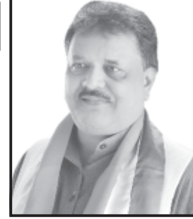
શાય તેવી ઘટના ઇતિહાસનાં પાના પર

કંડાઈ ગઈ છે. અમરેલી જિલ્લાનાં રાજકારણમાં છેલ્લા ૩૫ વર્ષથી દબદબો ધરાવતાં વિરજુ હુંમર સેના વગર સેનાપતિ બનીને ભાજપનો સામનો મક્કમતાથી કરતાં આવ્યા છે અને હવે સતત પછડાટ મળતા તેમના અખૂટ આત્મ વિશ્વાસમાં ઘટાડો થશે અને જિલ્લાનાં રાજકારણમાં નવા નેતૃત્વનો ઉદય થાય તેવી સંભાવના જોવા મળી રહી છે.