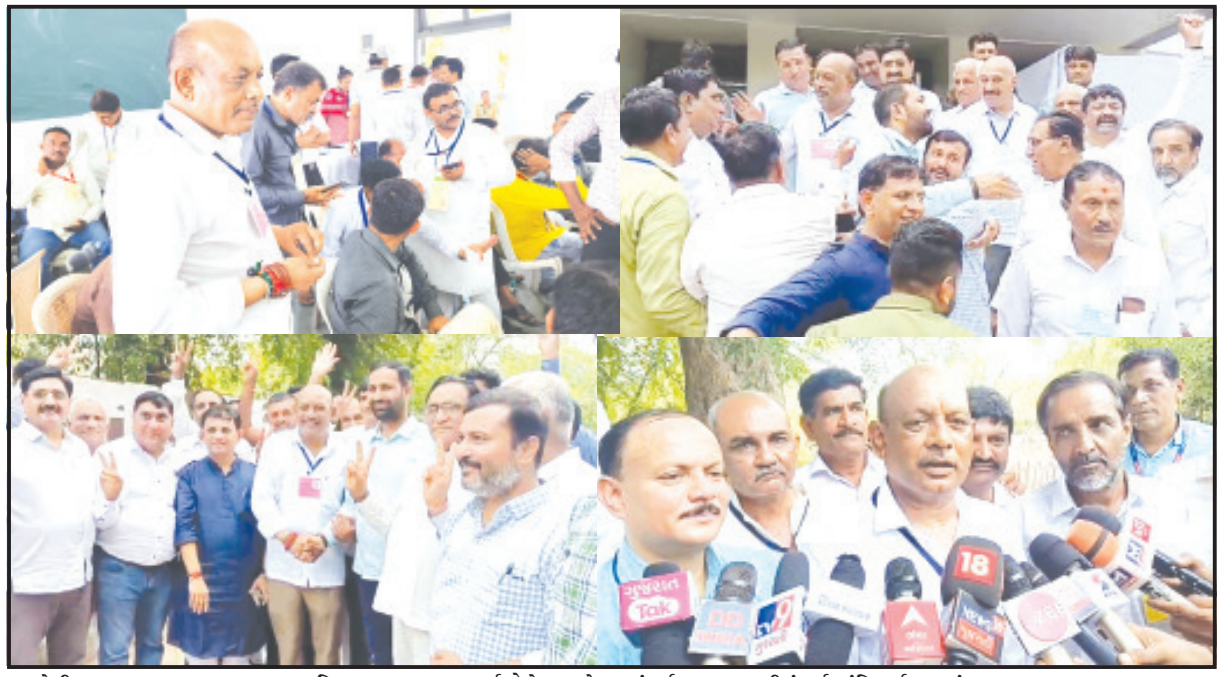
અમરેલી, તા. ૪ ચૂંટણી તંત્ર દ્વારા અમરેલી સ્થિત પ્રતાપરાય આર્ટ્સ કોલેજ ખાતે લોકસભા સામાન્ય ચૂંટણી-૨૦૨૪ અંતર્ગત મતગણતરીનું કાર્ય શાંતિપૂર્ણ અને સેહાઈપૂર્ણ માહોલમાં સંપન્ન થયું હતું. લોકસભા સામાન્ય ચૂંટણીના

ભાજપે લોકસભા બેઠક તાબાની તમામ સાતેય વિધાનસભાની બેઠકો પર ભવ્ય લીડ મેળવી મહુવામાંથી ૭૨૮૪૩, રાજુલામાંથી ૬૯૭૮૨ અને સાવરકુંડલામાંથી ૩૭૭૦૯ મતોની સરસાઈ લાઠીમાંથી ૩૬૫૫૯, ગારીયાધારમાંથી ૩૫૬૮૬, અમરેલીમાંથી ૩૫૦૨૪, ધારીમાં ૩૦૦૨૬ મતોની લીડ જિલ્લાનાં તમામ ભાજપી ધારાસભ્યોનાં રાજકીય વર્ચસ્વમાં ઐતિહાસિક વધારો થયો