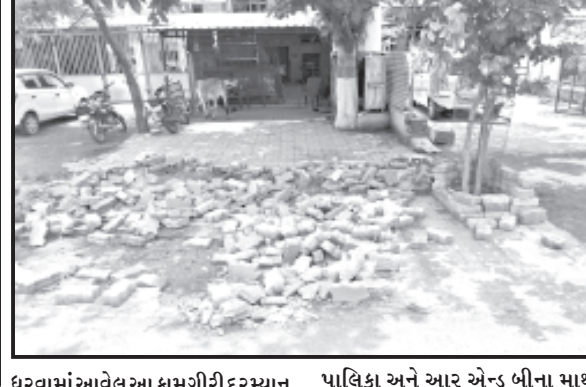
ધરવામાં આવેલ આ કામગીરી દરમ્યાન

સાવરકુંડલા, તા. ૨૬ સાવરકુંડલા પાલિકા દ્વારા ડીમોલેશન દરમ્યાન લોકોએ સ્વપર્ચે રોડ સાઈડમાં નાખેલ બ્લોક રોડ ને તોડી પડતા કોંગ્રેસ આગેવાન લાલધુમ સાવરકુંડલા શહેરમાં તા. ૨૧/૬/૨૦૨૪ ને શુક્રવારના રોજ નગર પાલિકા દ્વારા ડીમોલેશનની કામગીરી હાથ ધરવામાં આવેલ જેમાં પાલિકા અને આર.એન.બી સહિત મોટી સંખ્યામાં પોલીસ કાફલા સાથે શહેરના મહુવા રોડ, જેસર રોડ, અમરેલી રોડ, નેસડી રોડ અને હાથસની રોડ સહિત વિસ્તારમાં ડીમોલેશનની કામગીરી હાથ