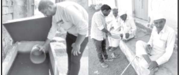
રંગપુર, તા. ૨૬