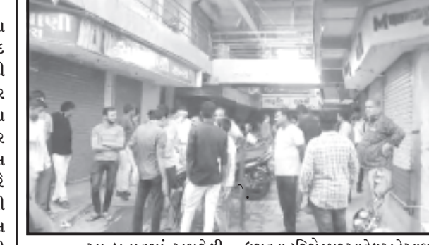
આ બનાવમાં અમરેલી શહેરની મધ્યમાં આવેલ અને સતત ટૂંકકિલ

અંદાજુત ૫૦ દુકાનોને તાળા મારી દેવાથી વેપારીઓ પરેશાન