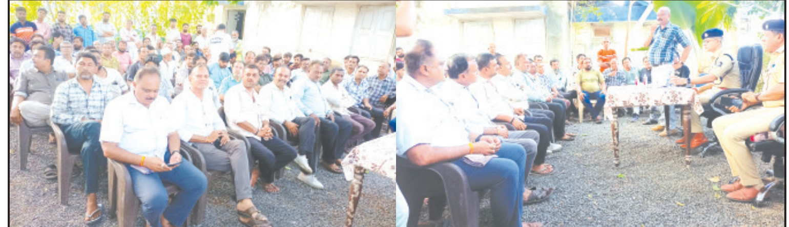
સાવરકુંડલા, તા. ૨૦ સાવરકુંડલા શહેરમાં આવતીકાલના રોજ શહેરી વિસ્તારમાંથી પર આવેલા ગેઈટ સુધીમાં બંને સાઈડમાં દબાણો હટાવવામાં આવનાર છે. જયારે ત્રીજા રૂટમાં રિલિ સિદ્ધિ ચોકથી મણીભાઈ ચોક થઈ જે.વી. મોટી સ્કૂલ, ગર્લ્સ હાઈ સ્કૂલ થઈ હાથસણી રોડ ચોકથી નેસરી રોડ ઉપર આવેલા ગેઈટ સુધી અને વળતા નેસરી રોડ ચોકથી હાથસણી રોડ પર આવેલા ગેઈટ સુધી બંને સાઈડમાં દબાણ હટાવવાની કામગીરી કરવામાં આવનાર છે. ઉપરોક્ત રોડમાં મહુવા રોડ અને જેસર રોડ માર્ગ અને મકાન વિભાગ હસ્તક છે જયારે હાથસણી રોડ જિલ્લા પંચાયત હસ્તક હોય ત્યાં રોડ ઉપર હાથ ધરાનારા વિકાસના કામોમાં નડતર રૂપ ઓટા, છાપરા, થડા જેવા દબાણો

શહેરનાં આંતરિક વિસ્તારમાં દબાણ હટાવ નહીં થાય