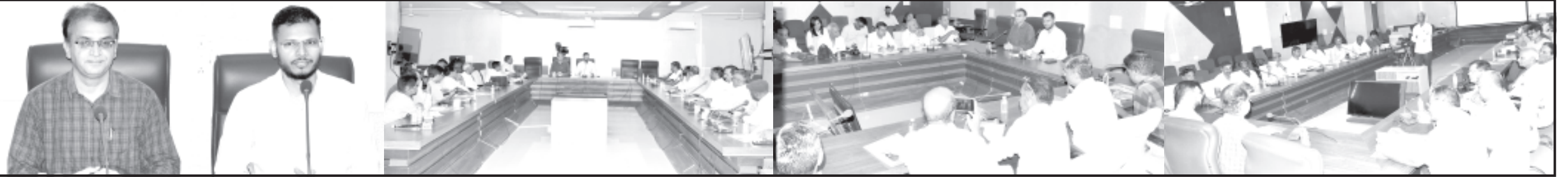
અમરેલી, તા. ૧૯ આંતરરાષ્ટ્રીય યોગ દિવસ-૨૦૨૪ના ઉપલક્ષમાં સમગ્ર

જિલ્લા સેવા સદન ખાતે યોજાયેલ પત્રકાર પરિષદમાં જિલ્લા કલેક્ટરે વિગતો આપી