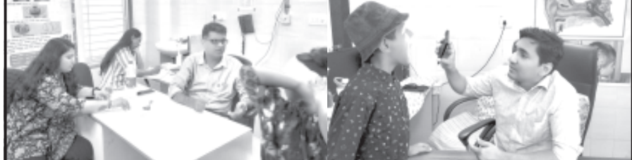
અમરેલી, તા. ૧૯

શાંતાબા જનરલ હોસ્પિટલ અમરેલીને હેલ્થ એન્ડ કેર ફાઉન્ડેશન અમદાવાદના સંયુક્ત પ્રયાસથી નિ:શુલ્ક મેડિકલ કેમ્પ યોજવામાં આવ્યો. આ કેમ્પમાં પોલીયોથી પીડાતા અને કોરોના હોદ, તળવામાં કાણા, ચેહરામાં વિકૃતતા, જડબા આગળ પાછળ હોવું,