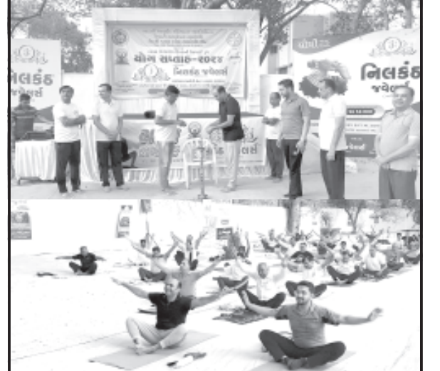
બનાવવા યોગદાન મળેલ છે. કાર્યક્રમની પૂર્ણાંકુતિ બાદ અલ્પહારની પણ વ્યવસ્થા રાખેલ છે. તો આ નગરજનોને આનો લાભ અનુરૂપ કરવામાં આવેલ છે.