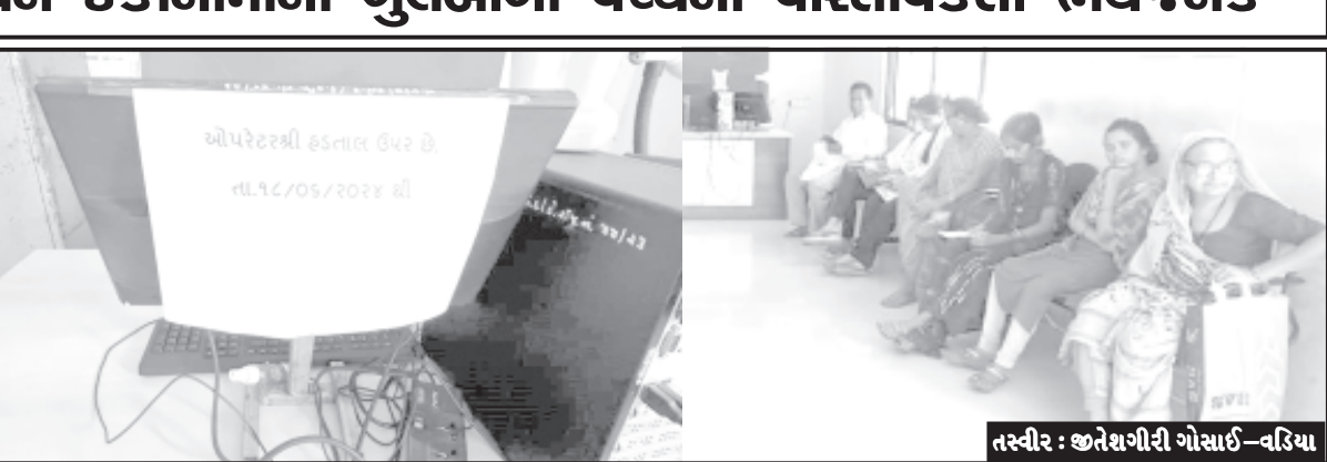
લોકોમાં સાંભળવા મળી હતી. ત્યારે આ કામગીરી તાત્કાલિક શરૂ કરવામાં આવે તેવી લોક માંગણી જોવા મળી રહી છે.

વડિયા, તા. ૧૯ સમગ્ર રાજ્યમાં આઉટસોર્સ એજન્સી થી મામલતદાર કચેરી અને અન્ય કચેરીઓમાં આધાર કાર્ડમાં સુધારાની અને નવા આધાર કાર્ડ ની કામગીરી કરવામાં આવે છે. આ કામગીરી માટે રાજ્ય સરકાર જે તે એજન્સીને કોન્ટ્રાક્ટ આપી તેની કામગીરી કરવા કર્મચારીઓની નિમણૂક કરે છે. હાલ સમગ્ર અમરેલી જિલ્લા સહીત વડિયાની મામલતદાર કચેરીમાં આધાર કાર્ડ કામગીરી ઠપ જોવા મળી રહી છે. આ બાબતે તપાસ કરતા આ કોન્ટ્રાક્ટ બેઠેડ એજન્સીના કર્મચારીઓનો પગાર છેલ્લા છ મહિનાથી થયેલ ના હોવાને કારણે આ કર્મચારીઓ પોતાની કામગીરીનો બંધખાર કરી હડતાલ પર ગયેલા છે ત્યારે કોઈ વૈકલ્પિક વ્યવસ્થાના હોવાને કારણે તાલુકા મથક પર ગ્રામીણ વિસ્તારમાંથી આધાર કાર્ડ સુધારણા અને નવા કાર્ડની કામગીરી માટે આવેલા લોકોની લાઈનો લાગી હતી અને