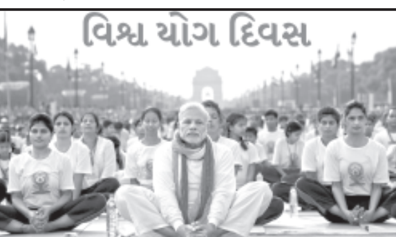
અમરેલી તા. ૧૯

૨૧ જૂન "આંતરરાષ્ટ્રીય યોગ દિવસ" ઉજવવામાં આવે છે. હાલમાં દેશ દુનિયામાં સતત ચાલતી હરીફાઈને કારણે સૌનું જીવન ખુબ જ વ્યસ્ત અને બેઠાણ થઈ ગયું છે. ફીઝીકલ એક્ટીવીટી પહેલા કરતા લગભગના બરાબર થઈ છે એવા સમયે આજે યોગનું મહત્વ વધ્યું છે. ખાસ કરીને મહામારીનાં સમયમાંથી પસાર થયા બાદ લોકો હવે સ્વાસ્થ્યનું મહત્વ સમજી રહ્યા છે. યોગ સ્વાસ્થ્ય માટે અત્યંત લાભદાયક છે. નિયમિત યોગ અભ્યાસ માનવ શરીરને મજબૂત અને લવચીક બનાવે છે. યોગ આસનો, પ્રાણાયમ અને ધ્યાન મનને શાંત કરે છે અને તાણને દૂર કરે છે. યોગ જીવનશૈલી સ્વીકારવાથી હૃદય, ફેફસા, પાચનતંત્ર અને માનસિક સ્વાસ્થ્યમાં સુધારો થાય છે.