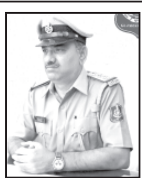
હતો. આ અંગેની ફરિયાદ શહેરપોલીસમાં નોંધાતા તત્કાલીન સીટી