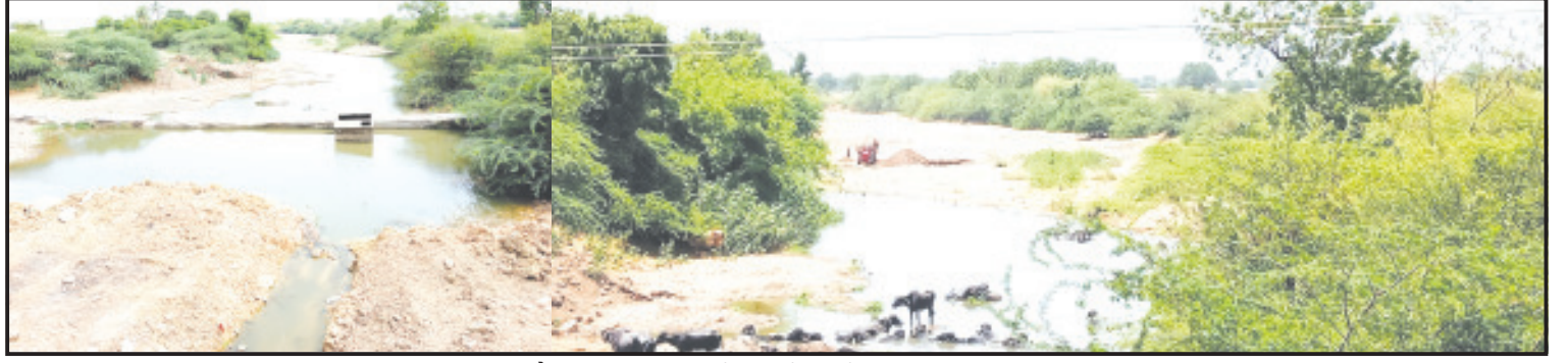
અમરેલી, તા. ૧૫ : ગામ નજીક નેશનલ હાઈવે રોડ ઉપર રાજુલા તાલુકાના જોલાપુર જોલાપરી નદીમાં મહિ પરિયોજનાનું પાણી મેઈન પાઈપલાઈન દ્વારા પહોંચાડવામાં આવે છે. આ પાઈપલાઈનમાં ભંગાણ કરીને ખનીજ માકિયાઓ દ્વારા નદીની રેતી ખારાશ અનુસંધાન પાના ૬ ઉપર