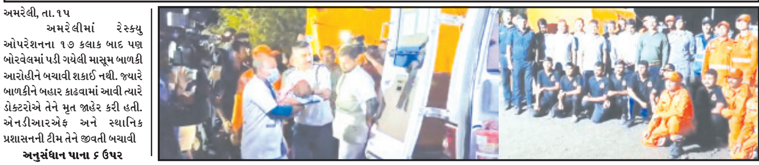
અમરેલી, તા. ૧૫ : અમરેલીમાં રેસ્ક્યુ ઓપરેશનના ૧૭ કલાક બાદ પણ બોરવેલમાં પડી ગયેલી માસુમ બાળકી આરોહીને બચાવી શકાઈ નથી. જ્યારે બાળકીને બહાર કાઢવામાં આવી ત્યારે ડોક્ટરોએ તેને મૃત જાહેર કરી હતી. એનડીઆરએફ અને સ્થાનિક પ્રશાસનની ટીમ તેને જીવતી બચાવી અનુસંધાન પાના ૬ ઉપર

એનડીઆરએફ, ફાયર સહિતની ટીમે ભારે મહેનત કરી પણ સફળતા ન મળી