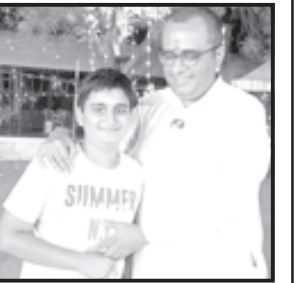
અમૂલ્ય, અતૂલ્ય, અનંત બાપ છે.

મા ઈશ્વર તો બાપ જાપ છે. એના ઉપકારોનું કયા માપ છે. બાપ એ બાપ એ બાપ છે, મા વિશે લખાયું કેટલુંક મા ઈશ્વર તો બાપ જાપ છે. ચામડીનાં જોડા પહેરાવે એ હૈયે, હોટે સંતાનોનો સંતાપ છે. ફોટામાં કે હોય નસેતમજીવતા સતત વરસતા આશીર્વાદ છે. હાજરીમાં જ એને ભજવેજો, પ્રભુનું પ્રત્યક્ષ સ્વરૂપ બાપ છે. બાપ થયા પછી જ મૂલ્ય સમજાશે