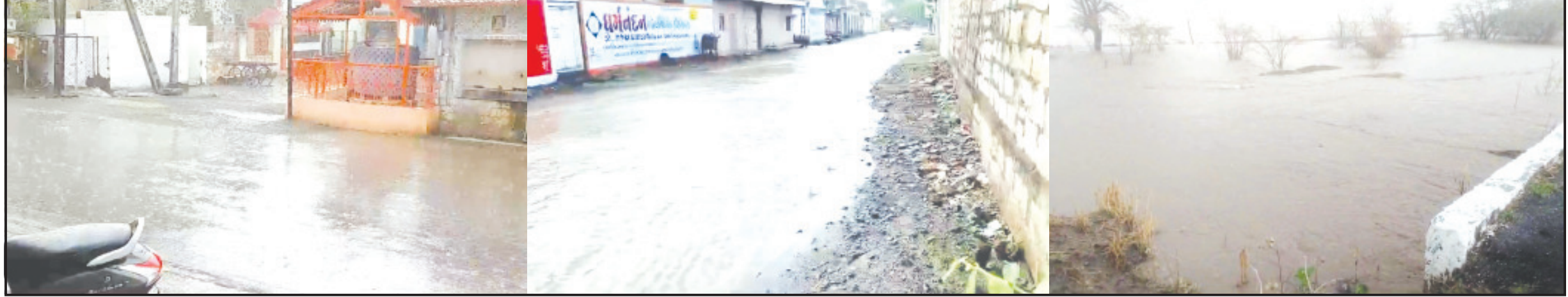
અમરેલી, તા. ૧૫ : અમરેલી જિલ્લામાં છેલ્લા ઘણાં જ સમયથી લોકો કાળજીળ ગરમીમાં બંધાયેલ રહ્યા હતા. ત્યારે ચાર પાંચ દિવસથી વાદળો વાતાવરણ આસપાસ વાતાવરણમાં પલટો આવતાં અને જેરદાર વરસાદ પડવા બાદ વરસાદ શરૂ થયો હતો. અમરેલી શહેરમાં જાણે વિવિધ ચોમાસાનો પ્રારંભ થયો હોય તેમ ધીમી ધીમી અર્થે ઈંચ વરસાદ પડ્યો હતો અને લગભગ ૪૫ મિનિટ સુધી વરસાદ પડતાં શહેરના માર્ગો ઉપર પાણી વહી રહ્યા હતા. અમરેલીમાં આજે ચોમાસાના પ્રથમ વરસાદ પડતા લોકોએ વરસાદની મોજ માણવા માટે થઈ વાહનલઈ ચાલુ વરસાદે ભીજાવા માટે અનુસંધાન પાના ૬ ઉપર

અમરેલી શહેરમાં ૪ વાગ્યા આસપાસ જેરદાર ઝાંપટુ પડી જતાં ઠંડક પ્રસરી ચાંદગઢ, ગોખરવાળા સહિતનાં વિસ્તારમાં ગણતરીની મિનિટોમાં ૩ થી ૫ ઈંચ વરસાદ પડ્યો લીલીયાનાં આંબા, કણકોટ અને સાવરકુંડલાનાં વંડા, મેકડા, જેજાદમાં પણ વરસાદ અમરેલીમાં ૧૨, લાઠીમાં ૧૮, લીલીયામાં ૧૦ અને વડિયામાં ૪ મી.મી. વરસાદ નોંધાયો