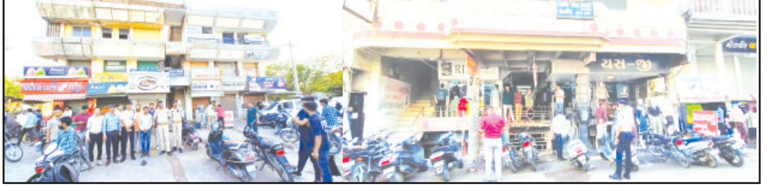
અમરેલી, તા. ૩૧ અમરેલીમાં છેલ્લા ૪ દિવસથી સતત ફાયર સેફ્ટીની ચકાસણી, નોટિસ અને સિલીંગની કામગીરી ફાયર વિભાગ ધ્વારા કરવામાં આવી રહી છે. આજે નાગનાથ બસ સ્ટેન્ડ નજીક આવેલ બુરહાની શોપિંગ સેન્ટરમાં ફાયર સેફ્ટીનો અભાવ હોવાથી ફાયર વિભાગે તેને સિલ મારી દેતા વેપાર-ધંધા ઠપ્પ થઈ ગયા છે.

રાજકોટનાં અગ્નિકાંડ બાદ સતત ફાયર સેફ્ટીની કામગીરી