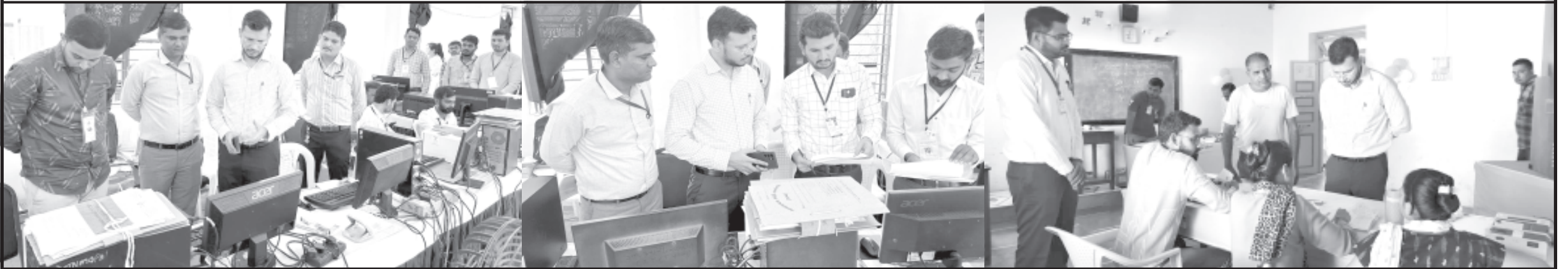
૧૪ અમરેલી લોકસભા મતવિસ્તારની મતદાન પ્રક્રિયા અંતર્ગત અમરેલી જિલ્લા ચૂંટણી અધિકારી અને જિલ્લા કલેક્ટર અખય દહિયાએ લોકસભા મત વિસ્તારમાં સમાવિષ્ટ વિવિધ વિધાનસભા વિભાગમાં કાર્યરત વેબ કાસ્ટીંગ કંટ્રોલ રૂમની મુલાકાત લીધી હતી. તેમણે કંટ્રોલ રૂમમાં વિવિધ વિગતો મેળવી અને જરૂરી સુચનાઓ આપી હતી. જિલ્લા કલેક્ટરે અમરેલી અને લાંબી ખાતેના મોડેલ મતદાન મથક, સખી મતદાન મથક અને યુવા મતદાન મથકની મુલાકાત લીધી હતી.