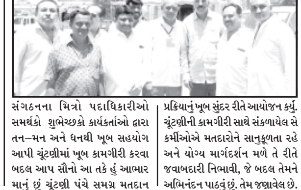
સંગઠનના મિત્રો પદાધિકારીઓ સમર્થકો શુભેચ્છકો કાર્યકર્તાઓ દ્વારા તન-મન અને ધનથી ખૂબ સહયોગ આપી ચૂંટણીમાં ખૂબ કામગીરી કરવા બદલ આપ સૌનો આ તકે હું આભાર માનું છું ચૂંટણી પંચે સમગ્ર મતદાન પ્રક્રિયાનું ખૂબ સુંદર રીતે આયોજન કર્યું. ચૂંટણીની કામગીરી સાથે સંકળાયેલ સે કર્મીઓએ મતદારોને સાનુકૂળતા રહે અને યોગ્ય માગદર્શન મળે તે રીતે જવાબદારી નિભાવી, જે બદલ તેમને અભિનંદન પાઠવું છું. તેમ જણાવેલ છે.