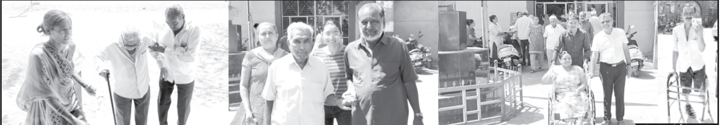
બાબરા ખાતે આવેલ કમળશી હાઈસ્કૂલ સહિતનાં મતદાન મથકો ઉપર લોકસભાની ચૂંટણીને લઈને ઉત્સાહનો માહોલ જોવા મળ્યો હતો અને દિવ્યાંગ, વૃદ્ધ સહિત તમામ વર્ગનાં મતદારો ઉત્સાહભેર મતદાન મથકે પહોંચ્યા હતા અને મતદાન કર્યું હતું.