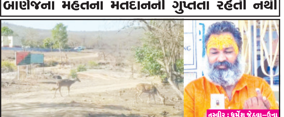
ઉના, તા. ૭ ભારતનું ચૂંટણી પંચ દેશનો એક પણ નાગરિક મતદાન કર્યા વિના ન રહે એની તકેદારી રાખવાનું કાયમી પ્રયેય ધરાવે છે. હિમાલયનાં બંદીલા અનુસંધાન પાના ૬ ઉપર

માત્ર એક મતદાર માટે તંત્રએ કરી વ્યવસ્થા જંગલમાં આવેલ બાણગંગા તીર્થધામનાં મહંત માટે મતદાન મથકની વ્યવસ્થા કરાઈ બાણગંગાનાં મહંતનાં મતદાનની ગુપ્તતા રહેતી નથી