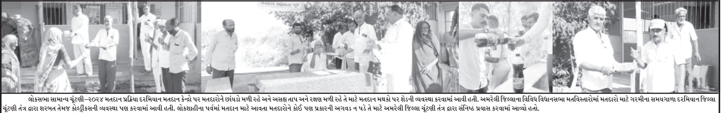
લોકસભા સામાન્ય ચૂંટણી-૨૦૨૪ મતદાન પ્રક્રિયા દરમિયાન મતદાન કેન્દ્રો પર મતદારોને છાંયડો મળી રહે અને અસહ્ય તાપ અને રક્ષણ મળી રહે તે માટે મતદાન મથકો પર શેડની વ્યવસ્થા કરવામાં આવી હતી. અમરેલી જિલ્લાના વિવિધ વિધાનસભા મતવિસ્તારોમાં મતદારો માટે ગરમીના સમયગાળા દરમિયાન જિલ્લા ચૂંટણી તંત્ર દ્વારા શરબત તેમજ કોલ્ડ્રીક્સની વ્યવસ્થા પણ કરવામાં આવી હતી. લોકશાહીના પર્વમાં મતદાન માટે આવતા મતદારોને કોઈ પણ પ્રકારની અગવડ ન પડે તે માટે અમરેલી જિલ્લા ચૂંટણી તંત્ર દ્વારા સંનિષ્ઠ પ્રયાસ કરવામાં આવ્યો હતો.