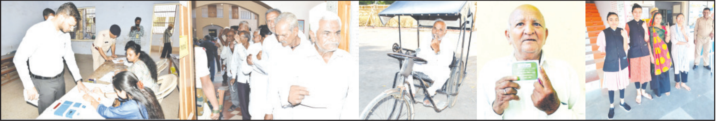
અમરેલી, તા. ૭ અમરેલી લોકસભા બેઠકનું મતદાન આજે પૂર્ણ થયું છે. અંદાજિત ૫૦ ટકા જેટલું મતદાન થયું હોય અને અંદાજિત ૬ લાખ મતદારોએ ક્યાં પક્ષ તરફી મતદાન કર્યું તે તો રામખણે પરંતુ જિલ્લાનાં રાજકીય પક્ષોનાં કાર્યકરો હવે બુધ દીઠ મતદાનનાં આંકડા મેળવીને આગામી ૨૭ દિવસ સુધી મત ગણતરી કર્યા કરશે. અમરેલી જિલ્લો એ સમગ્ર રાજ્યનાં રાજકારણનું એપી સેન્ટર છે. જિલ્લામાં ઉદ્યોગોની કમી જોવા મળે છે અને રાજકારણ એ ઉદ્યોગ બન્યો હોય. પાલિકાથી લઈને પાલામેન્ટ સુધી કોઈ પણ ચૂંટણી હોય જિલ્લાનાં રાજકારણમાં ગરમાવો આવી જતો હોય છે અને રાજકીય કાર્યકરો જેમાં ભાજપ-કોંગ્રેસ તરફી કાર્યકરો ચર્ચા અને દલીલો કર્યા કરશે અને મીડિયા પ્રતિનિધિઓને પણ પુછપરછ શરૂ કરશે કે ક્યાં પક્ષને સફળતા મળશે અને કોને નિષ્ફળતા મળશે અને આગામી ૪ જૂને મતગણતરી હોયર ઉદિવસ સુધી મત ગણતરી કર્યા કરશે.

જો કે લોકસભા વિસ્તારનાં અંદાજિત ૬ લાખ મતદારોએ ક્યાં પક્ષ તરફી મતદાન કર્યું તે તો રામખણે