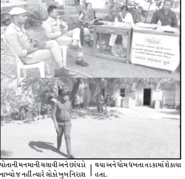
પોતાની મનમાની ચલાવી અને છાંયડો નાખ્યો જ નહીં ત્યારે લોકો ખુબ નિરાશ હતા.

વડિયા, તા. ૭ વડિયાના એક પણ બુથ પર મંડપ કે છાંયડો નહીં કરતાં મતદારો તડકામાં શેકાયા લોકોએ ઓપજરવેસને કરી ફરીયાદ એક તરફ સરકાર દ્વારા મોટી જાહેરાતો કરી હતી કે મતદારો કોઈપણ પ્રકારની તકલીફોના પર તેની ખાસ તકેદારી રાખવી, ત્યારે વડિયાના આઠ મતદાન બુથ આવેલા છે તેમાંથી એક પણ બુથમાં છાંયડો કે મંડપ નાખવામાં આવ્યો ન હતો. એક તરફ જોરદાર હિટ વે તડકો તો બીજી તરફ મંડપ કે છાંયડાની વ્યવસ્થાના હોવાના કારણે મતદાન નિરાશ થયા હતા. જોકે ઓપજરવેસને અધિકારીએ મંડપ સર્વિસ કે જેમને અહીયા છાંયડો નાખવાનો કોન્ટ્રાક્ટને ગય કાલ સાંજથી સતત ફોન કર્યો હતો છતાં પણ મંડપ સર્વિસ વાળાએ