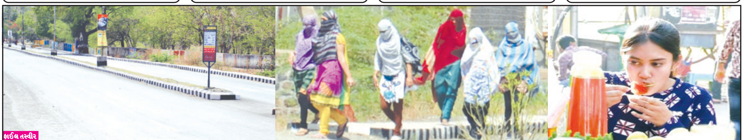
શાઈલ તસ્વીર | અમરેલી, તા. ૨૫ | તાપમાનનો પારો છેલ્લા ઘણા દિવસોથી ગરમી પડી રહી છે અને સામાન્ય અમરેલી જિલ્લામાં ૪૩ થી ૪૬ ડીગ્રી વચ્ચે રહેતા કાળજીળ જનજીવન અસ્ત વ્યસ્ત બની ગયું છે.

છેલ્લા ૧૦-૧૫ દિવસથી સવારનાં ૯થી સાંજનાં ૬ સુધી અને બાદમાં ૯ સુધી વાતાવરણમાં ગરમી જોવા મળે છે કમોસમી વરસાદનાં માહોલ વચ્ચે અચાનક ગરમીમાં તોતીંગ વધારો જતાં સૌ કોઈ પરેશાન આગામી અઠવાડિયામાં ગરમીનો પારો ૪૦ આસપાસ આવે તેવી હવામાન નિષ્ણાંતોની આગાહી ભારે ગરમીથી સામાન્ય જનજીવન અસ્તવ્યસ્ત બની ગયું છે