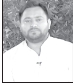
વિડીયો મેસેજ વાયરલ કરીને જણાવેલ છે કે, ૪ જૂન બાદ દેશમાં ઈન્ડિયાની સરકાર બનશે, ઈન્ડિયા ગઠબંધનને ૩૦૦ કરતાં વધારે બેઠકો મળશે. જો કે ઈન્ડિયા ગઠબંધનનાં