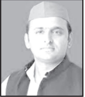
અને ૪ જૂન બાદ દેશમાં ઈન્ડિયા ગઠબંધનની સરકાર રચાશે. બીજી તરફ આજે સવારે આમ આદમી પાર્ટીનાં સર્વેસર્વા અરવિંદ કેજરીવાલે પણ સોશયલ મીડિયામાં