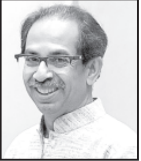
નેતાઓ રાહુલ ગાંધી, અખિલેશ યાદવ, તેજસ્વી યાદવ, ઉદ્ધવ ઠાકરે સહિત તમામે આત્મ વિશ્વાસ સાથે દાવો કરેલ છે કે દેશમાં આગામી સરકાર ‘ઈન્ડિયા’ ગઠબંધનની બનશે.