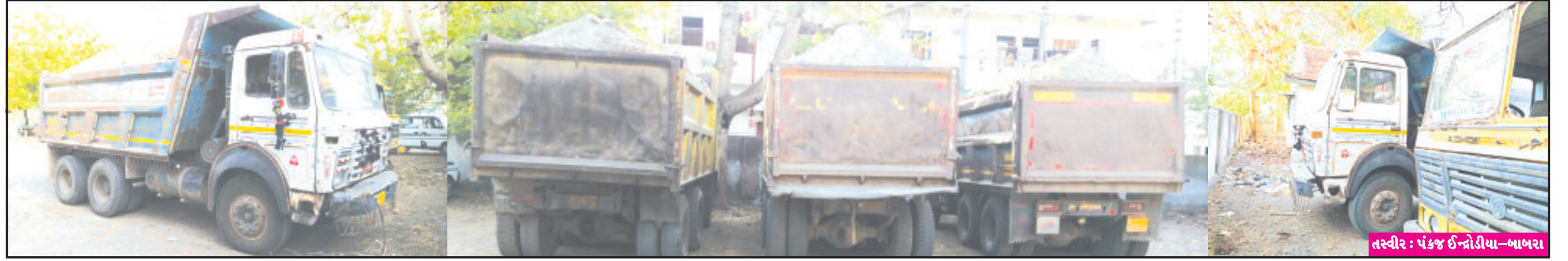
બાબરા, તા. ૨૧ બાબરામાં ખનિજ ચોરી કરતા તત્ત્વો પર મામલતદાર દ્વારા ગત મોડી રાત્રે રેડ કરી ત્રણ જેટલા માટી ભરેલા ડમ્પરને પકડી લેતા માટી ચોરી કરતા તત્ત્વોમાં ફફડાટ ફેલાય ગયો છે. બાબરામાં નદી, તળાવ અને ખાલી ડેમ વિસ્તારમાં મોટા પ્રમાણમાં માટીની ચોરી કરવામાં આવી રહી છે. ક્યાંક તંત્રની મીટી નજર હેઠળ તો ક્યાંક છાને ખૂણે માટીનો કારોબાર ચાલી અનુસંધાન પાના ૬ ઉપર

સુજલામ સુફલામ યોજનાનો દુરુપયોગ કરનારને છોડવામાં નહીં આવે તેવી તંત્રની ચીમકી નદી, તળાવ અને ખાલી ડેમ વિસ્તારમાં વ્યાપક પ્રમાણમાં ખનિજ ચોરી થતી હોવાની ફરિયાદ ઉભી થઈ રહી હતી ક્યાંક તંત્રની મીટી નજરતળે પણ ખનિજ ચોરી થતી હોવાની ચર્ચાઓ થતી હતી ખેડૂતોનાં હિતમાં શરૂ થયેલ યોજનાનો લાભ લેવા અનેક શખ્સો સક્રીય બન્યા હતા