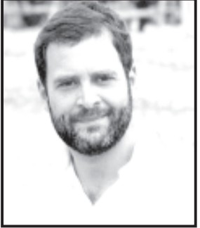
આગામી ૨૫ મે અને ૧લી જૂનનાં રોજ ૫૭-૫૭ બેઠકોનું મતદાન પૂર્ણ થશે અને ૪ જૂનનાં રોજ મત ગણતરી પ્રક્રિયા હાથ ધરાશે.