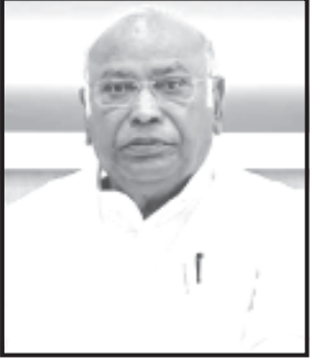
અમરેલી, તા. ૨૧ સમગ્ર વિશ્વમાં સૌથી મોટી લોકશાહી ધરાવતાં ભારત દેશમાં દેશની સર્વોચ્ચ પંચાયત ગણાતી

જો કે વિપક્ષી નેતાઓનો દાવો કેટલો સાચો રહેશે તે તો આગામી ૪ જૂનનાં રોજ ખબર પડશે