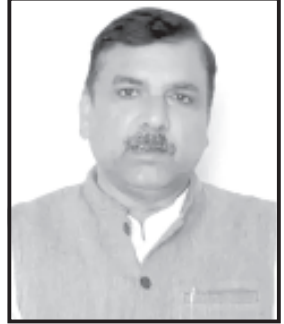
જો કે દેશની જનતા ઉત્સાહભરે મતદાન કરી રહી છે ત્યારે જનતા કોના પર પસંદગીનો કળશ ઢોળશે તે માટે ૪ જૂનનાં રોજ યોજાનારી મત ગણતરીની રાહ જોવી રહી.