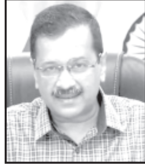
દરમિયાનમાં ગઈકાલે કોંગ્રેસનાં રાષ્ટ્રીય પ્રવક્તા ગુલટીપ સંપાનને ચંડીગઢ ખાતે યોજાયેલાં પત્રકાર પરિષદમાં ઈન્ડિયા ગઠબંધનનો ૩૦૦ કરતાં વધારે બેઠક ઉપર વિજય થશે