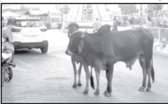
રાહદારીઓને ભોગવવી પડતી પરેશાની દૂર કરવા માટે જનતાને સાથે રાખીને પ્રશાસને સંકલન કરીને યોગ્ય અને નક્કર કામગીરી-કાર્યવાહી કરવાનો સમય-સમય બલવાન છે એમ આવી ગયો છે હવે વિચાર કરવાનો સમય નથી. ખોરાક-પાણી માટે જાહેર રસ્તાઓ ઉપર ફરતા મુક પશુઓ માટે કંઈક કરી છૂટવા માટે 'સત્ય-પ્રેમ-કરુણા' શબ્દોને સાથે કરવા જોઈએ એવો મત છે.

દામનગર, તા. ૯ ચૂંટણી સમયે ઉમેદવારને જીતાડવા માટે મોટી સંખ્યામાં કાર્યકરોને મતદારો પાસે જવાનો સમય હોય છે, એમ સ્થાનિક સમસ્યા હલ કરવા માટે જો એક થઈને કાર્ય કરવામાં આવે તો કંઈક કરી શકાય છે. ગામે-ગામે રસ્તે રાજીતા પશુઓ મુક પશુઓ માટે રહેવા અને ખોરાક-પાણીની યોગ્ય વ્યવસ્થા ન હોવાથી કોઈને કોઈ રીતે વાહન ચાલકો અને