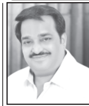
શુભેચ્છા મેળવેલ. આ પરીણામને