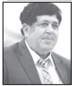
વડાલીયા અને ઉપસ્થિત સહકારી

સહકારી ક્ષેત્રમાં ભાજપા પ્રદેશ પ્રમુખે શરૂ કરેલ મેન્ડેટ પદ્ધતિ સફળ ન થઈ