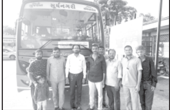
એ.આ.બસ મહુવા, તળાજા, ભાવનગર, વડોદરા અને સુરત આ રૂટ ઉપર દરરોજ નિયમિત રીતે ચાલશે. તો વધુમાં વધુ લોકો આ બસનો લાભ લે તેવું સુરતના રૂપે મેનેજરની યાદીમાં જણાવવામાં આવેલ છે. આ બસ રાજુલાથી દરરોજ સાંજે ૬.૦૦ કલાકે અને સુરતથી સાંજે દરરોજ ૭.૩૦ કલાકે ઉપડશે.